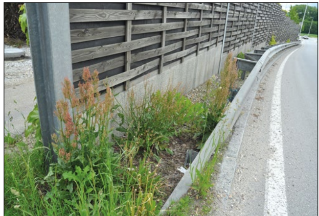
Abb. 25: Einige Exemplare des Gemüse-Ampfers ( Rumex rugosus ) am Straßenrand bei Mehrnbach – vielleicht sogar Abkömmlinge von im 19. Jhdt. aus Gärten verwilderten Pflanzen?

Kulturrelikt im Bereich alter Burgen und Ruinen (DEHNEN-SCHMUTZ 2000).