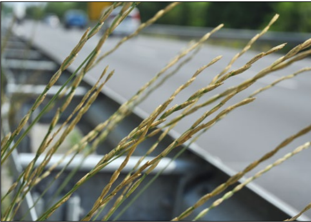
Abb. 44: Die Verlängerte Quecke ( Elymus obtusiflorus ) – unsichtlicher Bestandteil von Saatgutmischungen zur Straßenböschungsbegrünung.