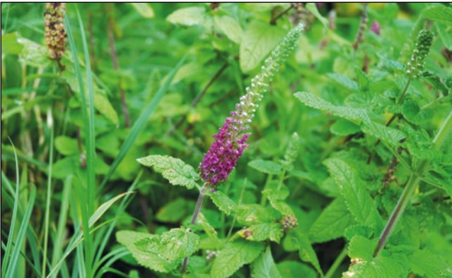
Abb. 33: Der Kaukasus-Gamander ( Teucrium hyrcanicum ) – eine Zierpflanze mit Verwildерungspotential – hier am Auwaldrand des Gurtenbaches bei Obernberg am Inn.