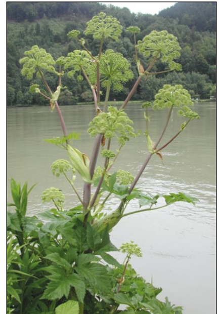
Abb. 6: Die Echte Engelwurz ( Angelica archangelica ) – wanderte in den letzten Jahrzehnten entlang der Donau bei uns ein.

Bei Gehölzen ist es heute in manchen Fällen fast unmöglich, Heimisches von Fremdem zu trennen. In den Fluss-