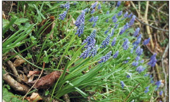
Abb. 34: Gelangt vor allem mit Gartenabfällen an unsere Waldränder – die Aucher-Traubenhyazinte ( Muscari aucheri ).