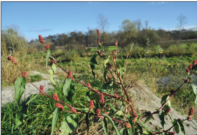
Abb. 28: Der erste Nachweis des Pennsylvanischen Knöterichs ( Persicaria pensylvanica ) in Österreich – auf Schwemmsand des Inn an der Gurtenbachmündung nahe Obernberg am Inn.