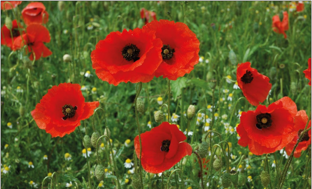
Abb. 1: Der Klatsch-Mohn ( Papaver rhoeas ) – von den Siedlern der Jungsteinzeit ins Land gebracht.

Therese-Riggler-Straße 16 A-4982 Obernberg am Inn m.hohla@eduhi.at