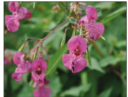
Abb. 7: Das Drüsen-Springkraut ( Impatiens glandulifera ) aus dem Himalaya – heute fixer Bestandteil unserer Flora und von Bienen und Hummeln geschätzt.