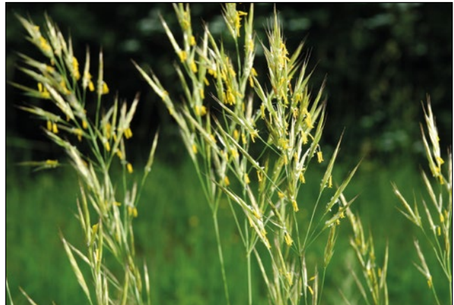
Abb. 5: Vermutlich seit der Römerzeit bei uns – die Aufrechte Trespe ( Bromus erectus ).

rhoeas – Abb. 1), Kornblume ( Cyanus segetum ) und viele weitere Blumen unserer Äcker dürfen heute als lebende Naturdenkmäler angesehen werden, ein Fall für den erweiterten Denkmalschutz sozusagen!