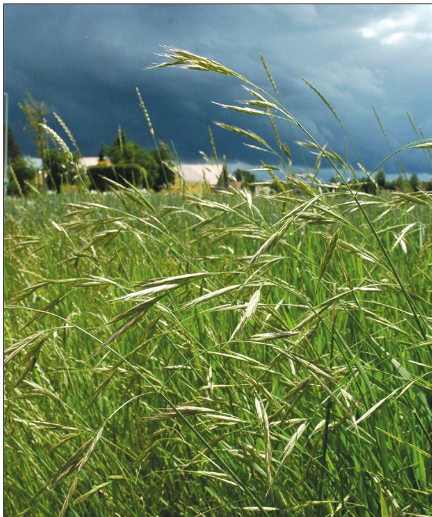
Abb. 46: Die Sitka-Trespe ( Bromus sitchensis ) – landet mit Saatgut in Futterwiesen und taucht in der Folge auch an Maisfeld- und Waldrändern auf – hier in Reichersberg.

Persönlich möchte ich an dieser Stelle noch zum Ausdruck bringen, dass ich mich trotz meiner Faszination für Ruderalpflanzen bzw. Neophyten von