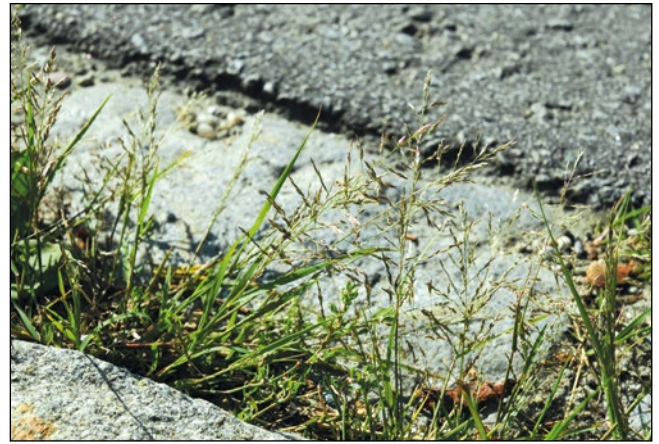
Abb. 27: Das Japanische Liebesgras ( Eragrostis multicaulis ) – in besonders starker Ausbreitung an den österreichischen Straßen.