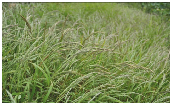
Abb. 38: Die Wiesen-Mühlenbergie ( Muhlenbergia mexicana ) wird vor allem von Gärtnereien unabsichtlich verbreitet – hier an der Oberkante der Salzachleite in Hochburg/Ach.