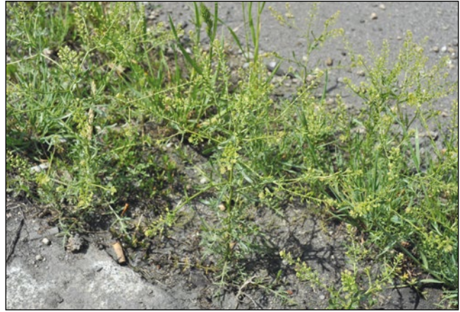
Abb. 23: Die streng riechende Ruderal-Kresse ( Lepidium ruderale ) – eine vermutlich heimische Art in starker Ausbreitung an unseren Straßen.