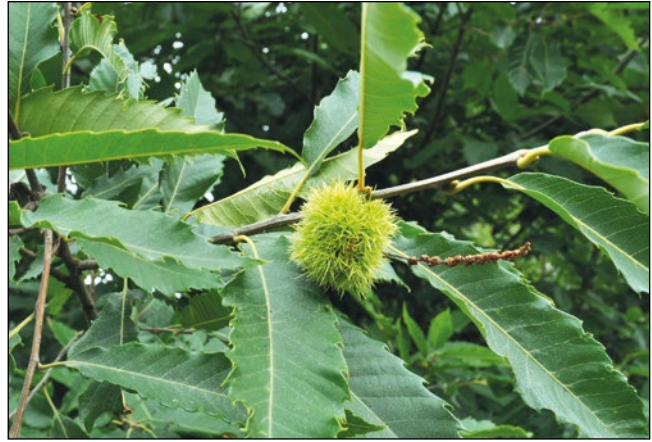
Abb. 3: Die Esskastanie ( Castanea sativa ) in Unterach am Attersee – vermutlich erst im 18. Jahrhundert angepflanzt.