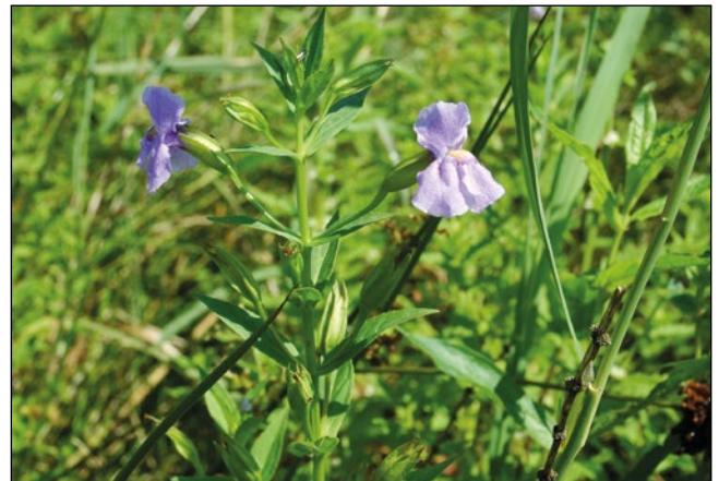
Abb. 29: Die Blaue Gauklerblume ( Mimulus ringens ) – nur vorübergehend auf den Schlamm­bänken im Stauraum bei Kirchdorf am Inn.

Und jährlich gibt es eine Fülle von Marktneueinführungen, darunter auch Arten, die leicht verwildern, entweder durch Aussamen oder durch Ausläufer bzw. Wurzelstückchen. Aus diesem Grund werden auch die nationalen Listen der verwildernden Arten immer länger. Es wäre mittlerweile vermutlich einfacher, jene Zierpflanzen aufzulisten, welche nicht verwildern! Aber Achtung: Gerade bei den Gartenpflanzen haben manche durchaus das Potential, sich nach deren Verwildern aus unseren Gärten dauerhaft in der Landschaft anzusiedeln. Drüsen-Springkraut ( Impatiens glandulifera ), Japan-Flügelknöterich ( Fallopia japonica ) und Riesen-Bärenklau ( Heracleum mantegazzianum ) haben dies bereits – begünstigt durch die seit den 1970er-Jahren losgetretene Nährstoffflut in unserer Landschaft (Abb 13) – eindrucksvoll vorgezeigt. Warnhinweise in den Verkaufskatalogen bei ausbreitungsfreudigen Kulturpflanzen (ähnlich der Allergenauszeichnung) wären vermutlich angebracht!