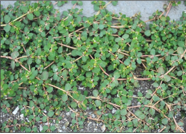
Abb. 42: Die Schlängelnde Wolfsmilch ( Euphorbia serpens ) aus Südamerika – bisher in Oberösterreich nur in Ried im Innkreis und St. Martin im Innkreis gefunden (HOHLA 2013 und unveröff.).