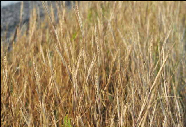
Abb. 18: Ein Neuzugang unserer Straßenrandflora – das Verkannte Fallsamengras ( Sporobolus neglectus ) aus Nordamerika.