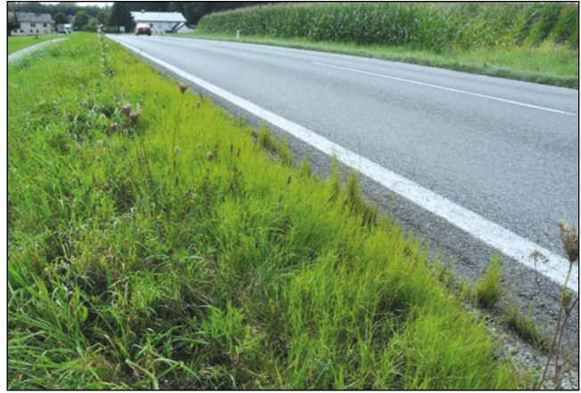
Abb. 19: Im August durch seine frischgrüne Farbe auffällig – die dichten Bestände des Verkannten Fallsamengrases ( Sporobolus neglectus ) – hier bei Moosdorf im Innviertel.