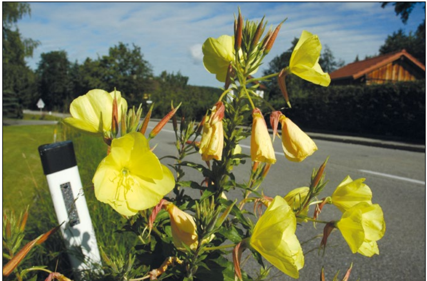
Abb. 15: Die attraktive Rotkelch-Nachtkerze ( Oenothera erythrosepala ) aus Amerika – wird von den Mähfahrzeugen am Straßenrand teilweise bewusst stehen gelassen.

Diese angeblich weltweite Bedrohung der Biodiversität durch biologische Invasionen wird immer wieder gerne als Argument für Neophytenkriegszüge verwendet und findet sich unreflektiert in diversen Kampfschriften und auf Posters. Aber schon KOWARIK (2003) relativiert: „Aus Mitteleuropa ist dagegen kein Fall bekannt, in dem eine nichteinheimische Art zum Aussterben einer indigenen Art geführt hätte.“ Ähnlich auch SCHOLZ (2011), der betont, dass von den 42 in Deutschland etablierten fremdländischen Gräsern keine negativen Effekte auf Vegetation und Flora bekannt geworden seien.