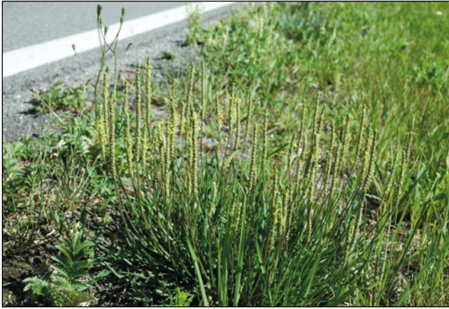
Abb. 20: Seit wenigen Jahren in Ausbreitung an unseren Autobahnen – der Krähenfuß-Wegerich ( Plantago coronopus ) aus dem Mittelmeerraum.