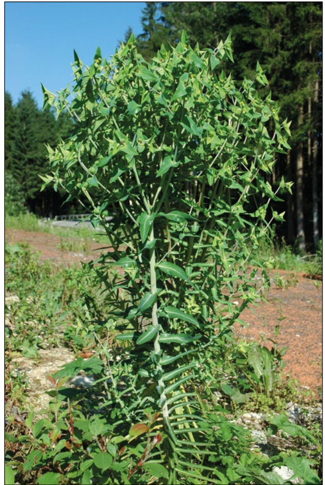
Abb. 11: Die Spring-Wolfsmilch ( Euphorbia lathyris ) – Vorsicht ätzend!

befähigt, sich an ändernde Umweltbedingungen anzupassen bzw. die Fähigkeit ihnen auszuweichen. Ohne diese wären sie (und wir) nicht auf der Welt.