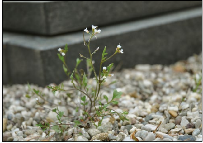
Abb. 43: Das Japanische Reisfeld-Schaumkraut ( Cardamine flexuosa subsp. debilis ) – in unseren Gärten, Blumenrabatten, Friedhöfen usw. – eingeschleppt mit Pflanzen aus Gärtnereien und Gartencentern.