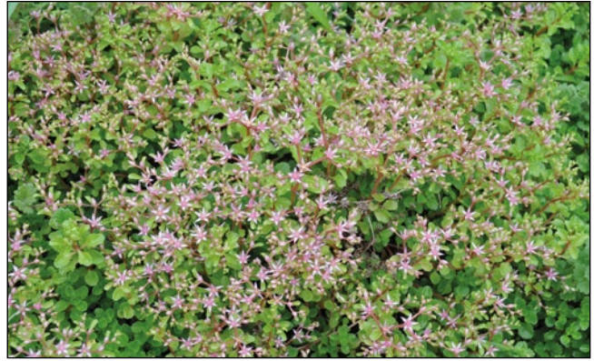
Abb. 32: Wo sie über Gartenabfälle hinkommt, bildet sie dichte Bestände, sogar in Wiesen – die Ausläufer-Asienfetthenne ( Phedimus stolonifer ).