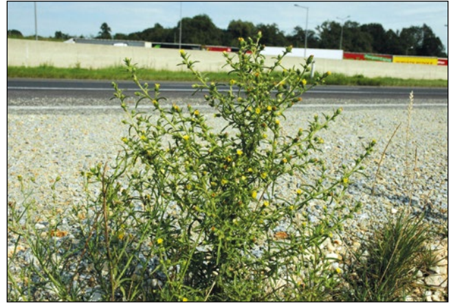
Abb. 21: Innerhalb von knapp 15 Jahren an Autobahnen in allen Bundesländern Österreichs – der Duftende Klebalant ( Dittrichia graveolens ), Heimat: Mittelmeerraum.

einst durch die Eisenbahnen aus dem Osten und Süden Europas eingeschleppten Wärme liebenden und konkurrenzschwachen Arten verschwand rasch wieder oder konnten sich nur auf den trocken-heißen Schotter- und Grusflächen im Bereich der Gleisanlagen halten. Nur relativ wenigen Arten gelang es, sich in der umgebenden Landschaft zu etablieren. Der Pyrenäen-Storchschnabel ( Geranium pyrenaicum ) ist eine davon, um ein Beispiel zu nennen. Der mediterrane Purpur-Storchschnabel ( Geranium purpureum ), der erst vor etwa 25 Jahren neu für Österreich nachgewiesen wurde (MELZER 1990), wächst zwar bereits auf fast jedem Bahnhof des Innviertels, bleibt dem Bahnschotter jedoch immer sehr treu.