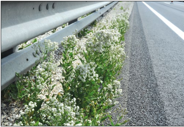
Abb. 26: Die Breitblättrige Kresse ( Lepidium latifolium ) am Autobahn-Mittelstreifen der A8 bei Aistersheim – in Deutschland bereits eine typische Autobahn­pflanze.