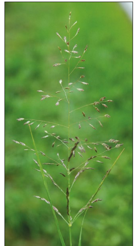
Abb. 30: Seit wenigen Jahren auch ein Gras der Straßenränder in Oberösterreich – das Elbe-Liebesgras ( Eragrostis albensis ).

Zu den erfolgreichen Newcomern der letzten Jahre zählt die Ausläufer-Asienfetthenne ( Phedimus stolonifer – Abb. 32), eine Fetthennenart, die auch in Wiesen dichte Bestände aufbauen kann, was sie zu einem potentiellen Weide-, Futter- und Heuwiesenunkraut macht (KLEESADL 2011, HOHLA 2011b). Zwei weitere Beispiele von Zierpflanzen, die sich etwa über Gartenabfälle an Waldrändern festsetzen könnten: der Kaukasus-Gamander ( Teucrium hyrcanicum – Abb. 33) und die Aucher-Traubenhyazinte ( Muscari aucheri – Abb. 34). Von letzterer habe ich bereits große Trupps in der steilen Salzachleite bei Hochburg-Ach gesehen (HOHLA 2011b). Für die meisten verwilderten Zierpflanzen heißt es jedoch in Schubert'scher Manier: „Fremd bin ich eingezogen, fremd zieh' ich wieder aus!“