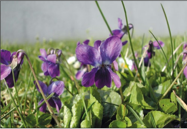
Abb. 2: Das März-veilchen ( Viola odorata ) – historischer Burggartenflüchtling oder aktueller Gartenausflüger ... das ist jeweils die Frage!