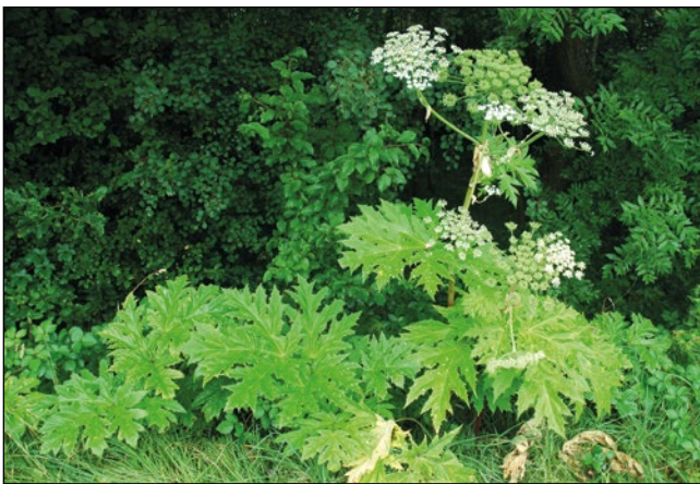
Abb. 10: Mit dieser Pflanze unbedingt Hautkontakt meiden – die ätzende Riesen-Bärenklau ( Heracleum mantegazzianum ).