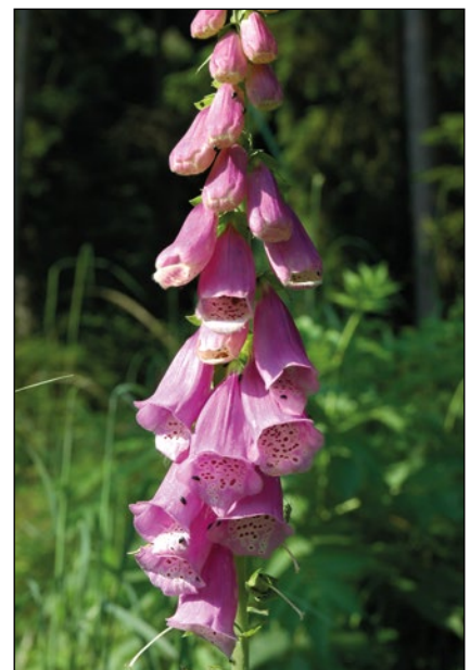
Abb. 8: Der Rote Fingerhut ( Digitalis purpurea ) – wurde in Oberösterreich vermutlich früher zur Behübschung unserer Wälder ausgepflanzt – heute häufig und noch immer in Ausbreitung.