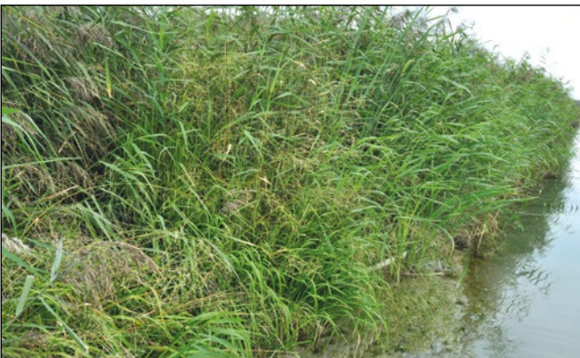
Abb. 35 u. 36: Der Amerikanische Schwaden ( Glyceria grandis ) – am Inn im Röhricht auf Anlandungen der Hagenauer Bucht – Gartenflüchtling oder verschleppt durch Zugvögel?