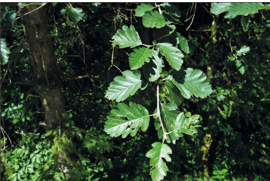
Abb. 14: Die Schweden-Mehlbeere ( Sorbus intermedia ) – verwildert selten aus unseren Gärten.

hungrige Brennnessel ( Urtica dioica ), etwa an den einst ausgehagerten Waldrändern, oder das heute allgegenwärtige Schilf-Reitgras ( Calamagrostis epigejos ), das von VIERHAPPER (1885-1889) im Innkreis nur „dort und da“ und in der näheren Umgebung von Ried im Innkreis gar nicht gefunden wurde. Ein anderes Beispiel: In den ausgedämmten Auen am unteren Inn sind heute weite Teile mit dem Winter-Schachtelhalm ( Equisetum hyemale ) bedeckt. Diese Art wurde dort erst gegen Ende des 19. Jahrhunderts zum ersten Mal festgestellt (VIERHAPPER 1885-1889), heute bildet sie Massenvorkommen, die so dicht sind, dass darin kaum andere Pflanzen des Auwalds aufkommen können. Diese Dominanz lässt sogar viele der besonders ausbreitungsfreudigen Neubürger vor Neid erblassen. Wäre der Winter-Schachtelhalm ein Neophyt, stünde er auf der Liste der zu bekämpfenden Arten ziemlich weit oben!