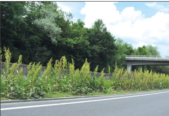
Abb. 24: Großer Bestand des Garten-Ampfers ( Rumex patientia subsp. patientia ) an der Innkreis-Autobahn (A8) bei Antiesenhofen – hier ungenießbar!