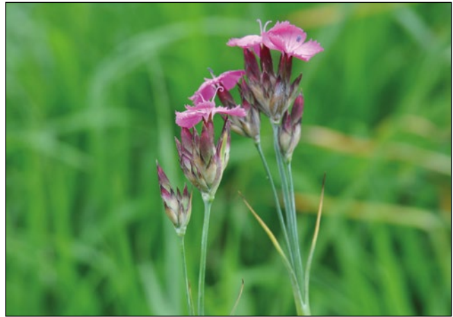
Abb. 45: Die Riesen-Nelke ( Dianthus giganteus ) aus Südosteuropa – ebenfalls Bestandteil von Saatgutmischungen – hier an einer Straßenböschung in Münzkirchen.

( Cardamine corymbosa – Abb. 40), das erst kürzlich mit Handelspflanzen aus englischen Gärtnereien nach Österreich eingeschleppt wurde (HOHLA 2011a), weiters die aus Nordamerika stammende Liegende Wolfsmilch ( Euphorbia prostrata – Abb. 41) oder die in Südamerika beheimatete Schlängelnde Wolfsmilch ( Euphorbia serpens – Abb. 42, HOHLA 2013).