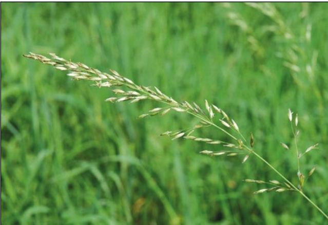
Abb. 4: Der Grannenlose Glatthafer – wird seit einigen Jahren häufig in unseren Wiesen angesät.