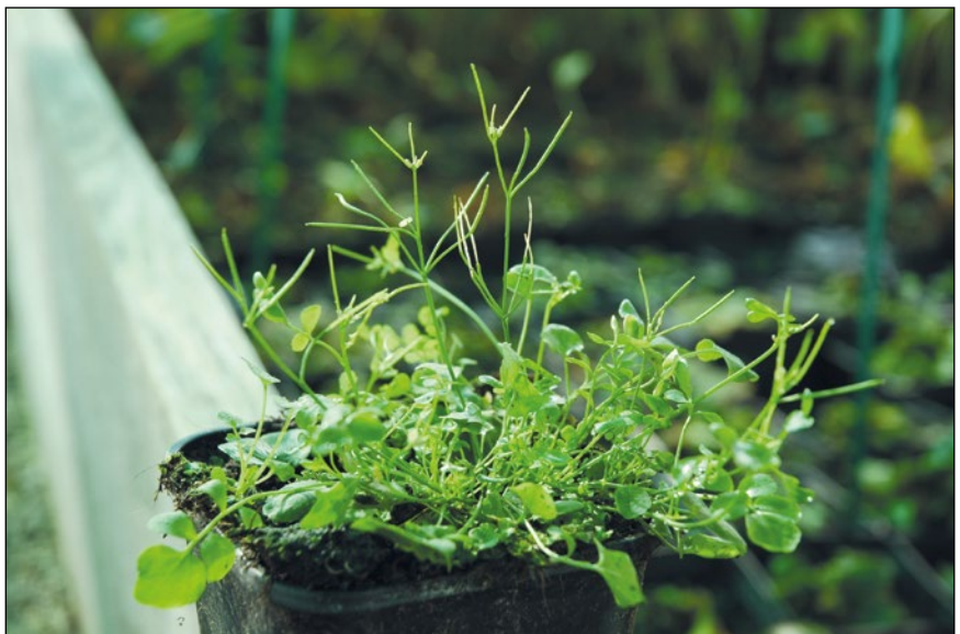
Abb. 40: Das Neuseeland-Schaumkraut ( Cardamine corymbosa ) – frisch durch Handelspflanzen aus England eingeschleppt – hier in Reichersberg.