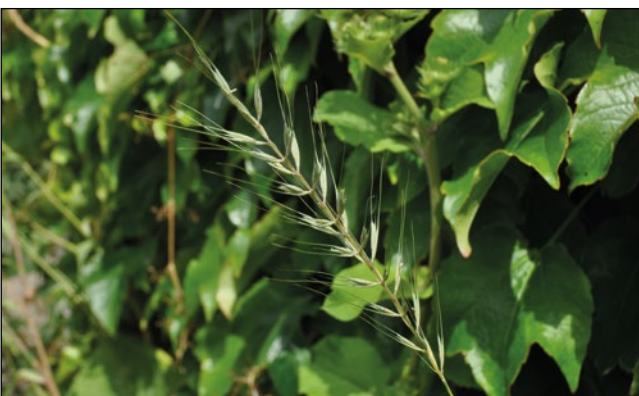
Abb. 37: Das Flaschenbürstengras ( Hystrix patula ) – ein einsamer, spontan verwilderter Exote am Gehsteigrand in Ried im Innkreis.