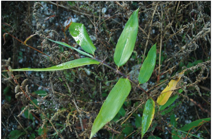
Abb. 39: Es gibt auf der Welt weit über 1000 Arten von Bambus – manche können sich über Ausläufer ausbreiten.

Gemeinsam mit den Zierpflanzen gelangen über das Netzwerk der Gärtnereien und Gartencenter laufend neue Begleitarten ins Land. Diese sind in der Regel unscheinbar, klein, unauffällig. Einige Jahre später sind sie dann verbreitet in unseren Gärten, Parks und Friedhöfen zu finden und stellenweise so häufig, dass sie „plötzlich“ auch auffallen. Zu diesen unscheinbaren Pflänzlein gehört das Neuseeland-Schaumkraut