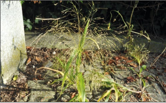
Abb. 31: Die sich langsam ausbreitende Flussufer-Rispenhirse ( Panicum riparium ) alias Panicum barbipulvinatum aus Nordamerika.