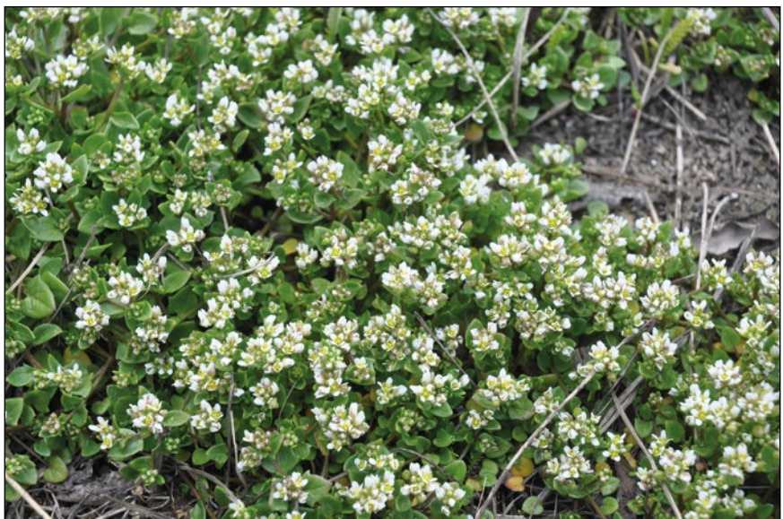
Abb. 17: Das Dänische Löffelkraut ( Cochlearia danica ) – eine Meeresstrandpflanze, erst seit einigen Jahren an unseren Autobahnen.