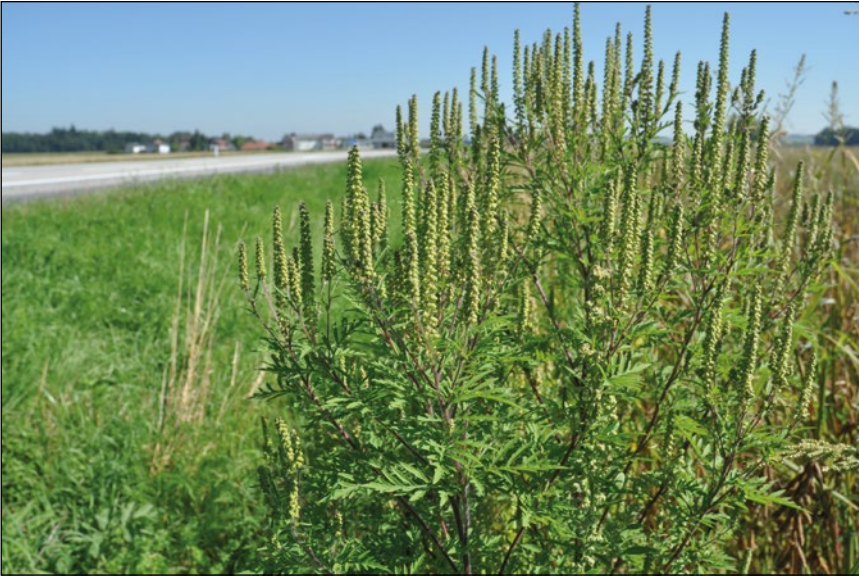
Abb. 12: Allergiepflanze an unseren Straßen und Autobahnen – die aus Nordamerika stammende Ambrosie ( Ambrosia artemisiifolia ).