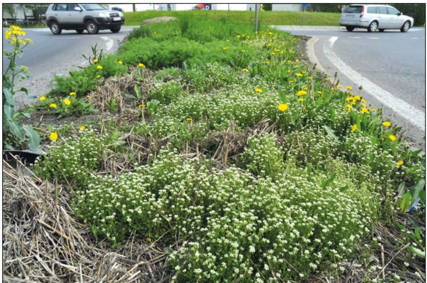
Abb. 16: Im April zu erkennen – die niedrigen weißen Blütenteppiche des Dänischen Löffelkrauts ( Cochlearia danica ) an der Innkreis-Autobahn (A8).