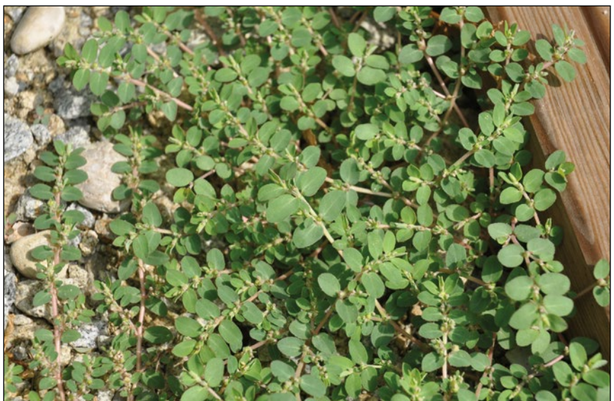
Abb. 41: Es mehren sich die Nachweise der aus Nordamerika stammenden Liegenden Wolfsmilch ( Euphorbia prostrata ) in unseren Gärten, Vorplätzen und Friedhöfen.