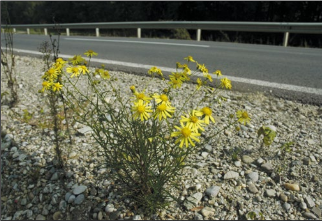
Abb. 22: Das Schmalblättrige Greiskraut ( Senecio inaequidens ) aus Südafrika – bildet erst seit einigen Jahren kilometerlange gelbe Bänder an den oberösterreichischen Autobahnen.