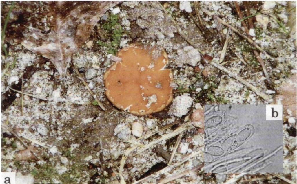
Abb. 3. Koilabaea delectans . a Habitus, b Sporen. Deutschland, Potsdamer Forst.