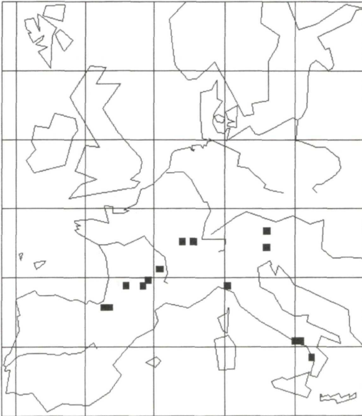
Abb. 2. Gyalecta sbarbari , bisher bekannte Verbreitung.

chenwald über Kalk, 23. 5. 2001, A. M. BRAND 43522; Calabria: Aiello Calabro, auf Cupressus im Wald auf dem Hügel, 21. 5. 2001, A. M. BRAND 43403.