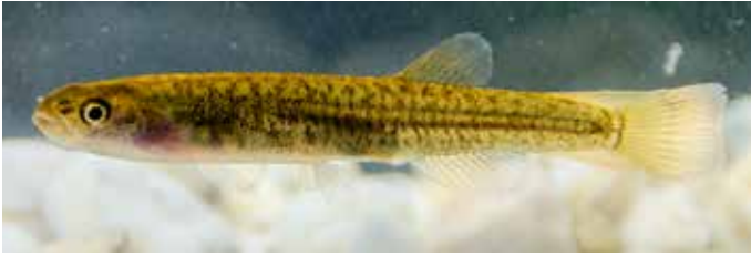
Abb. 13. Kap-Galaxias ( Galaxias sp.) aus dem Noetzie River; ca. 4,5 cm TL.

Wie mehrere molekularbiologische Studien erkennen ließen, besteht eine beachtliche genetische Divergenz zwischen den einzelnen Populationen der Kap-Galaxias. Fünf verschiedene Linien wurden festgestellt, die zwischen 7 % und 17 % voneinander divergieren. Das bedeutet die größte intraspezifische genetische Diversität, die bei Fischen jemals beobachtet wurde und spricht für die Präsenz von mindestens fünf kryptischen Arten innerhalb des bisherigen Taxons Galaxias zebratus (Wishart et al., 2006). Die äußeren Merkmale variieren zwischen den Populationsgruppen bei weitem nicht so stark wie die genetische Distanz es vermuten ließe. Nichtsdestotrotz lassen sich unterschiedliche Farbmuster erkennen, wie es die zwei abgebildeten Exemplare (Abb. 13 und 14) zeigen, deren Fundorte 440 km Luftlinie voneinander entfernt liegen. Weitere genetische und morphologische Studien sind erforderlich, um die taxonomische Einordnung der einzelnen Populationsgruppen zu gewährleisten. Es bleibt nur zu hoffen, dass die verbliebenen Populationen der Kap-Galaxias nicht durch Fraßdruck eingesetzter Fischarten oder den Verlust des Lebensraumes weiter dezimiert werden.