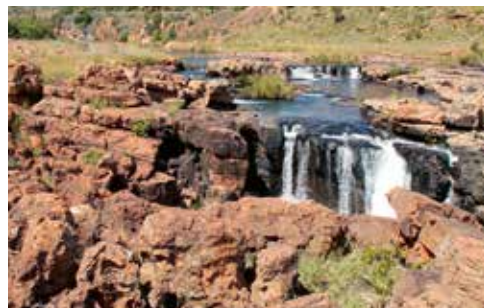
Abb. 2. Treur River – bei der Mündung in den Blyde River.