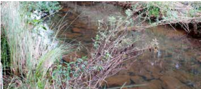
Abb. 4. Elandspruit – einer der Quellflüsse des Crocodile River; Habitat von Kneria sp. nov. und Enteromius anoplus .

Etwa 70 km südlich des Ursprungs der Flüsse Blyde und Treur fließt der Crocodile River Richtung Osten, wo er dann an der Grenze zu Mosambik in den Komati mündet, der zwischen der Hauptstadt Maputo und der Mündung des Limpopo den Indischen Ozean erreicht. In der Quellregion des Crocodile River gibt es, beschränkt auf sieben kleine Zuflüsse, das geografisch eng begrenzte, isolierte Vorkommen einer interessanten Fischart. Diese sieben Subpopulationen stellen die südlichste Verbreitung der Ohrenfische ( Kneria ) dar. Die Gattung Kneria umfasst 13 beschriebene Arten, die in Afrika südlich des Äquators schnell fließende Bäche höherer Lagen bewohnen. Benannt wurde die Gattung nach dem berühmten österreichischen Ichthyologen Rudolf Kner (1810–1869). Kneria gehört zur Familie der nur in Afrika verbreiteten Schlankfische (Kneriidae). Lange Zeit war die systematische Stellung der Kneriidae umstritten. Der russische Ichthyologe L. S. Berg stellte 1958 in seinem Werk »System der rezenten und fossilen Fischartigen und Fische« die Familie Kneriidae noch zu den Heringsfischen, jedoch unter der Bezeichnung »incertae sedis« (ungewisse Stellung). Heute fasst man die Kneriidae gemeinsam mit den Chanidae (Milchfischen) und zwei weiteren Familien in der Ordnung Gonorhynchiformes zusammen. Diese Ordnung gehört ebenso wie auch die Cypriniformes (Karpfenartigen), die Characiformes (Salmartertigen) und die Siluriformes (Welsartigen) zur Überordnung Ostariophysi (Nelson, 2006).