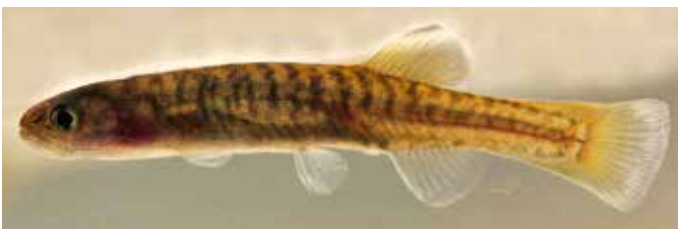
Abb. 14. Kap-Galaxias ( Galaxias sp.) aus dem Silvermine Stream südlich des Tafelberges bei Kapstadt; ca. 4 cm TL.