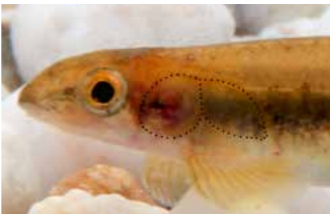
Abb. 6. Kneria sp. nov. – Schwarze Punkte markieren die Position des Occipitalorgans.

Die Vorkommen im Einzugsgebiet des Crocodile River befinden sich auf Seehöhen zwischen 1.100 und 1.400 m. Die Bäche sind meist 2 bis 3 m breit und bis zu 1 m tief, führen klares, kühles Wasser (< 20 °C) und weisen ein moderates Gefälle auf. Das Bachbett enthält Kies und mit Algen bewachsene Steine. Wie der Autor beim Schnorcheln in einem der Bäche (Elandspruit) beobachten konnte, schwimmen die Ohrenfische in gemischten Schwärmen mit einer kleinen Barbenart ( Enteromius anoplus ). Ohrenfische bis zu einer Gabellänge von 2 cm ernähren sich von Wirbellosen, größere Tiere (die Maximallänge beträgt ca. 7 cm) leben von Aufwuchs, insbesondere Kieselalgen. Die Länge des Darms in Relation zur Körperlänge nimmt nach dem Wechsel zur pflanzlichen Nahrung zu. Eine lange Laichperiode (Oktober bis April) kompensiert die Verluste von Eiern und Brut während der sommerlichen Überflutungen