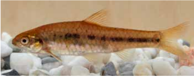
Abb. 3. Enteromius neeffi – ca. 7 cm TL; aus dem Treur River.

beschrieben, einem Zufluss des Blyde River im Einzugsgebiet des Limpopo an der östlichen Randstufe. Jedoch führte in den späten 1960ern der Besatz mit nicht heimischen Prädatoren, wie den bereits erwähnten Regenbogen- und Bachforellen sowie dem Schwarz-barsch ( Micropterus dolomieu ), zum Verschwinden dieser Population. Nur im Oberlauf des Blyde River, dank eines Wasserfalls vom Vordringen der invasiven Arten geschützt, blieb eine Restpopulation erhalten. Im Jahre 1995 wurden 504 Exemplare aus dieser Population in den Treur River gebracht, wo sich die Spezies wieder etablieren konnte (Roux & Hoffman, 2017). Beim Schnorcheln im April 2018 konnte der Autor hier keine der genannten invasiven Fischarten beobachten. Neben den wenigen kleinen Gruppen von Treur-Barben wurden noch zahlreiche Buntbarsche ( Tilapia sparrmanii ), ein Quappenwels ( Amphilius natalensis ) und Exemplare einer weiteren Barbenart ( Enteromius neeffi ) gesichtet. Die zwei kleinen, voneinander isolierten Restpopulationen der Treur-Barbe scheinen dennoch gefährdet, und zwar durch Habitatverschlechterung aufgrund der intensiven Forstwirtschaft und der Verbreitung von Pestiziden.