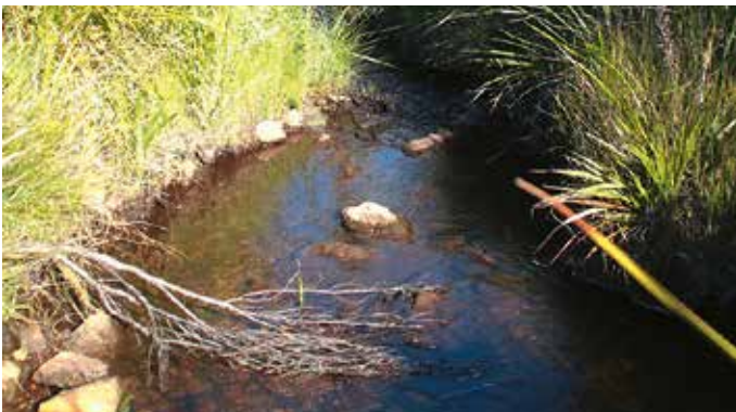
Abb. 12. Noetzie River – oberhalb des Brackenhill Wasserfalls; Habitat von Galaxias sp.

Das Verbreitungsgebiet der Kap-Galaxias erstreckt sich vom südlichen Einzugsgebiet des Olifants River im Westen der Provinz Westkap bis zu den Quellbächen der Flüsse Krom und Gamtoos im Südwesten der Provinz Ostkap. Dazwischen liegen etliche Küstenbäche, die isolierte Vorkommen von Kap-Galaxias aufweisen. Ein Beispiel ist der Noetzie River oberhalb des Brackenhill Wasserfalls etwa 10 km östlich von Knysna. In dem durchschnittlich zwei Meter breiten und kaum einen halben Meter tiefen Bach kommt ausschließlich diese kleine Fischart vor. Aufgrund der teebraunen Färbung des Wassers ist es kaum möglich, die Fische von außerhalb zu erkennen, zumal sie bei Annäherung sofort in Verstecke flüchten. Dies erklärt, warum viele der Populationen erst vor nicht allzu langer Zeit entdeckt wurden, wie die des Krom und Gamtoos. Die Kap-Galaxias wird mit etwa 4 cm TL geschlechtsreif und kann maximal eine Länge von 7,5 cm erreichen. Im Aquarium gehaltene Tiere wurden bis 10 Jahre alt (Skelton, 2001).