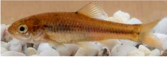
Abb. 8. Dickkopffarbe ( Enteromius anoplus ) aus dem Elandspruit; ca. 5 cm TL.

(Kleynhans, 1988). Der Name »Ohrenfisch« bezieht sich auf eine anatomische Besonderheit bei geschlechtsreifen Männchen: ein napfartiger, runder Aufsatz am Kiemendeckel und im Anschluss daran, oberhalb der Brustflosse, ein länglich-ovales, quengeripptes Gebilde. Beide Teile treten erhaben über der Körperoberfläche hervor und werden Occipitalorgan genannt (Abb. 6 und 7). Man nimmt an, dass dieses Organ zur Paarung dient, wobei sich das Männchen seitlich an das Weibchen kurzzeitig anheftet (Sterba, 1977). Weitere Merkmale sind ein kleines, leicht unterständiges Maul (Abb. 5a) und kleine, nur schwer zählbare Schuppen. Der für die Spezies oftmals verwendete englische Name »Airbreathing Shell ear« (Luftatmender Ohrenfisch) weist auf die besondere Fähigkeit der Luftatmung hin. Die Fische sollen außerdem imstande sein, während der Regensaison feuchtes Gelände zu überqueren oder über nasse Felsen seitlich von Wasserfällen emporzuklettern (Bell-Cross & Minshull, 1988).