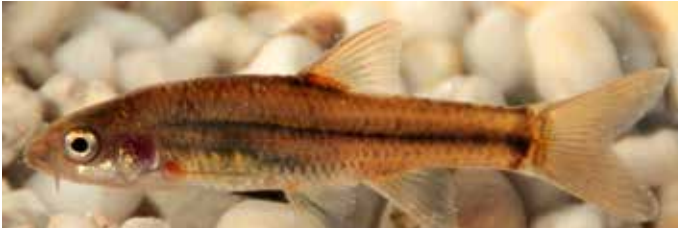
Abb. 10. Dickkopffarbe ( Enteromius anoplus ) aus dem Grobbelaars – Einzugsgebiet des Gourits im Südosten der Provinz Westkap; ca. 5,5 cm TL.

Bächen des Kap-Faltengebirges (Skelton, 2001). Die deutsche Übersetzung des Trivialnamens aus dem Englischen (Chubbyhead barb) oder dem Afrikaans (Dikkop-ghieliemientjie) wäre »Dickkopffarbe«. Der Fisch wird nicht größer als 10 cm (Männchen) oder 12 cm (Weibchen). Er bevorzugt kühles Wasser unterschiedlicher Habitats und ernährt sich von Insekten, Zooplankton, Samen und Algen. Wie bei allen anderen Arten, die dieser Gattung angehören, wurde der Gattungsname von Barbus auf Enteromius geändert (Yang et al., 2015). Jüngere Untersuchungen zeigten, dass die verschiedenen Populationen der Dickkopffarben in ihrem großen Verbreitungsgebiet bedeutende genetische Unterschiede aufweisen und möglicherweise eigenständige Arten darstellen. Bisher wurden nur einige der Populationen aus dem westlichen Einzugsbereich des Limpopo der Marico-Barbe ( E. motebensis ) zugeordnet. Es wird aber vermutet, dass viele Vorkommen, die heute noch als E. anoplus oder E. motebensis klassifiziert werden, in Wahrheit eine neue Spezies repräsentieren (Woodford, 2017). Eine umfassende taxonomische Revision zu diesem Arten-Komplex steht noch aus.