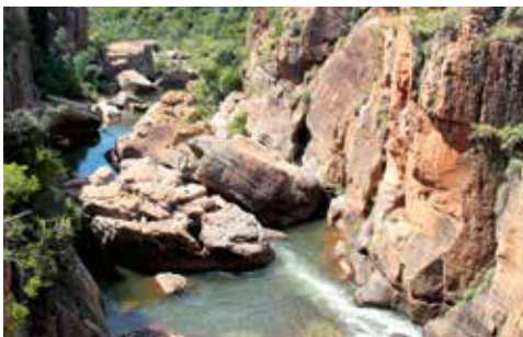
Abb. 1. Blyde River – kurz nach der Mündung des Treur River; östliche Große Randstufe.

Eine der am meisten gefährdeten Fischarten Südafrikas ist die Treur-Barbe ( Enteromius treurensis ). Auf der Roten Liste gefährdeter Arten (IUCN) wird sie als »vom Aussterben bedroht« (CR) eingestuft. Ursprünglich wurde dieser kleine Fisch (bis zu 10 cm TL) aus dem Treur River