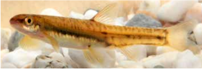
Abb. 5a. Ohrenfisch ( Kneria sp. nov.) aus dem Elandspruit; ca. 4,5 cm TL.

Die Ohrenfische aus den Quellbächen des Crocodile River in Südafrika wurden früher gemeinsam mit den Populationen aus den Bergbächen im Osten Zimbabwes und der angrenzenden Gebirgsregion von Mosambik als eine Art klassifiziert: Kneria auriculata . Neueren Studien zufolge unterscheiden sich aber die südlichen Ohrenfische signifikant von jenen Exemplaren, die vom Typusfundort in Mosambik bekannt wurden. Für die Population des Crocodile schlug man daher eine noch unbeschriebene neue Art ( Kneria sp. nov.) vor (Roux & Hoffman, 2017). Weitere Arten von Ohrenfischen im südlichen Afrika findet man bei den Epupafällen an der Grenze zwischen Namibia und Angola, den Kunene-Ohrenfisch ( Kneria maydelli ), und in den Oberläufen der Flüsse Kunene, Okavango und Sambesi, den »Nördlichen Ohrenfisch« ( Kneria polli ). Im Gegensatz dazu wird Kneria auriculata auch als »Südlicher Ohrenfisch« bezeichnet (Skelton, 2001).