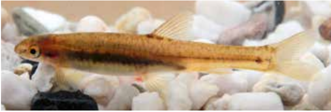
Abb. 5. Ohrenfisch ( Kneria sp. nov.) aus dem Elandspruit; ca. 4,5 cm TL.