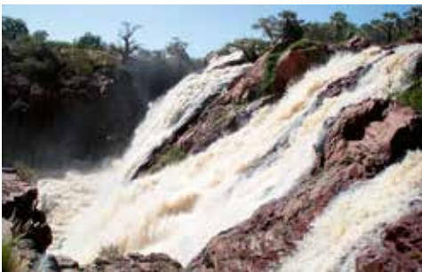
Abb. 9. Die Epupafälle an der Grenze zwischen Angola und Namibia; der Kunene stürzt hier 37 m über die westliche Große Randstufe. Der Typusfundort des Kunene-Ohrenfisches ( Kneria maydelli ) befindet sich in Nähe der Fälle. Über seine weitere Verbreitung ist nichts bekannt.

Die mit den Ohrenfischen koexistierende Barbenart, Enteromius anoplus , hat ein weites Verbreitungsareal im Inneren Südafrikas: vom Hochland von Limpopo und KwaZulu-Natal im Osten über die Provinz Ostkap bis zum oberen und mittleren Oranje und den Flüssen des Kapgebietes (Olifants, Gourits, Gamtoos, Sundays und Great Fish River). Sie fehlt aber in den