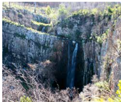
Abb. 11. Brackenhill Wasserfall – ca. 10 km östlich von Knysna; Galaxias -Population oberhalb der Fälle.