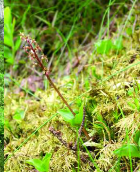
oben: typischer Habitus von blühenden und nicht blühenden Pflanzen; unten: seltene dicht stehende Pflanzengruppe von Listera cordata