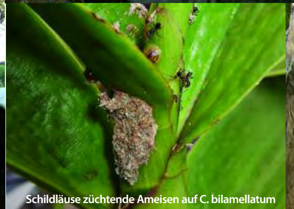
Schildläuse züchtende Ameisen auf C. bilamellatum