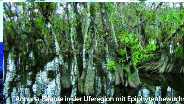
Annona-Bäume in der Uferegion mit Epiphytenbewuchs