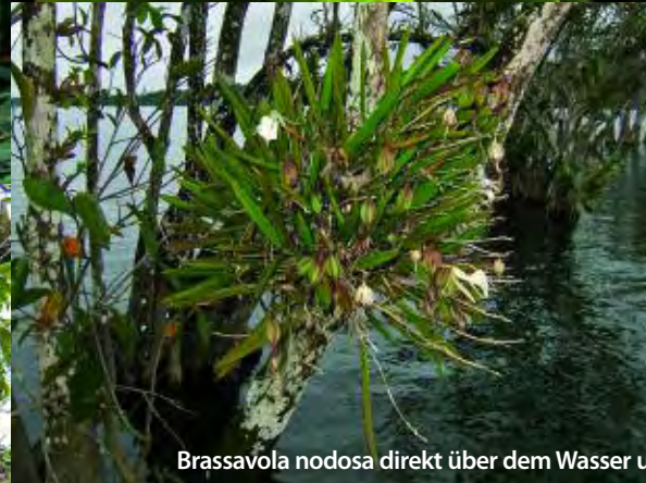
Brassavola nodosa direkt über dem Wasser und Einzelblüte