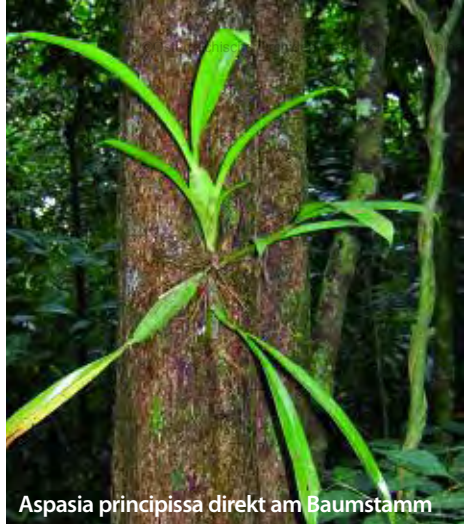
Aspasia principissa direkt am Baumstamm

Als bei weitem häufigste Art besiedelt Caularthron bilamellatum manche Bäume lückenlos. Zur Blütezeit im Jänner/Februar müssen diese Pflanzen einen beeindruckenden