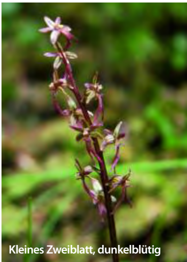
Kleines Zweiblatt, dunkelblütig

Im Moos verborgen liegt ein Rhizom, dessen