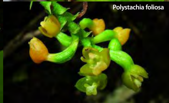
Polystachya foliosa Aguti