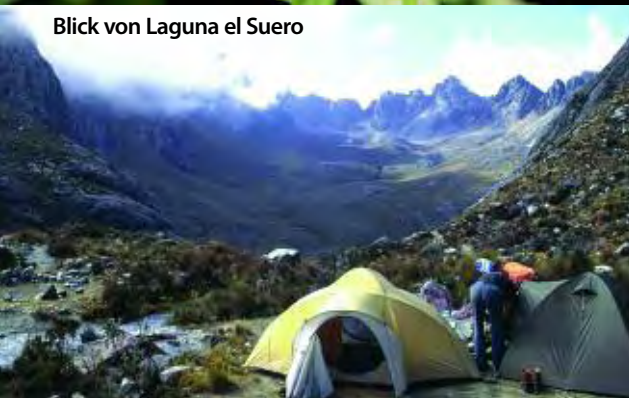
Blick von Laguna el Suero