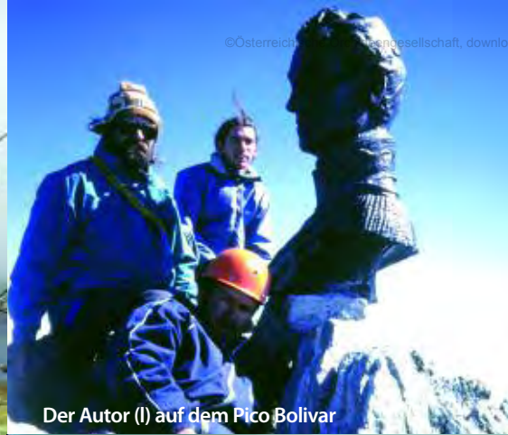
Der Autor (I) auf dem Pico Bolívar