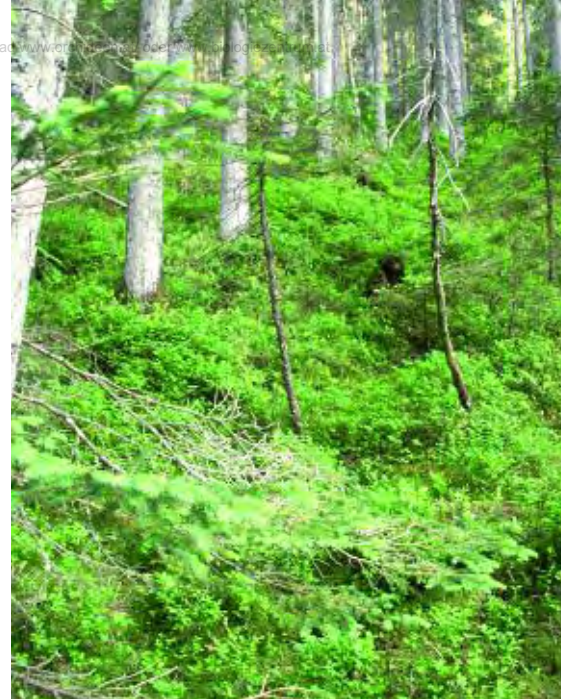
Zwei unterschiedliche Standorte – oben: nordseitiger Fichtenhochwald, unten: feuchte Straßenböschung (1200 m), Listera nur im oberen Drittel