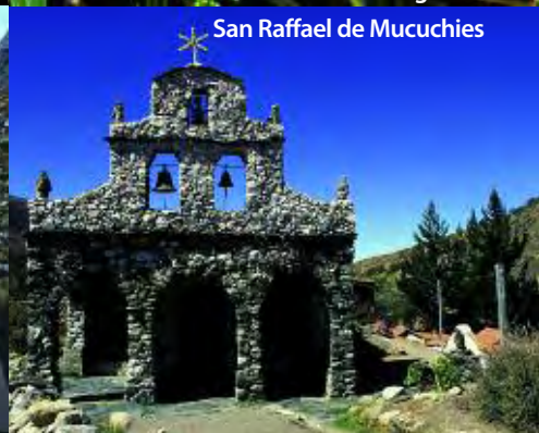
San Raffael de Mucuchies