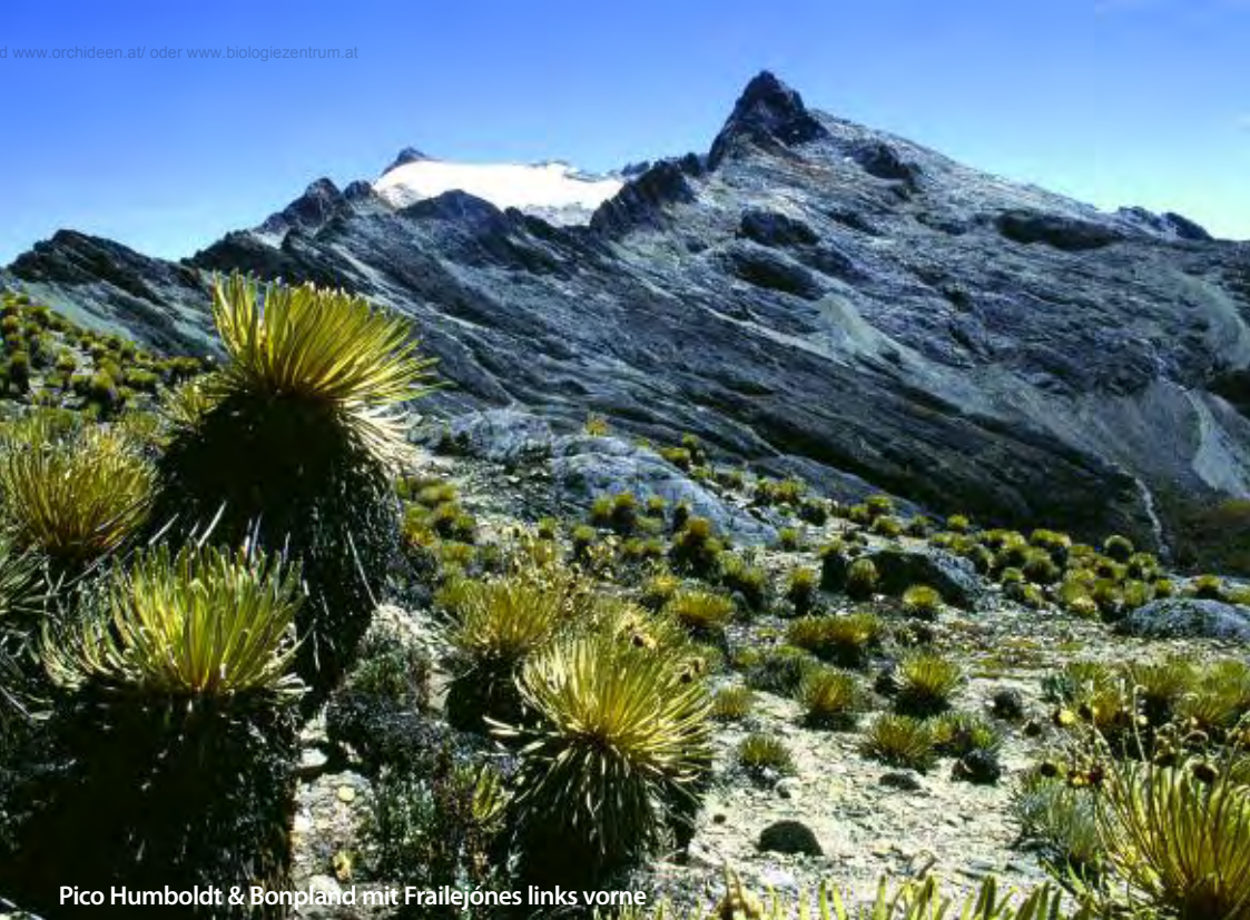
Pico Humboldt & Bonpland mit Frailejones links vorne

unsere Zelte an den Abfluss der Lagune. Ein Bad im kalten Gletscherwasser belebt die Sinne und lässt das Blut schneller zirkulieren. Schnell sind die Zelte aufgebaut und bei heißem Tee erfahren wir, dass die Blüten der Tabacote Morado ( Senecio formosus ), von den Bergbauern als Tee gegen Asthma verwendet werden. Bis zu 300 Bolivar (ca. 0,01 Euro) zahlen sie für eine Blüte.