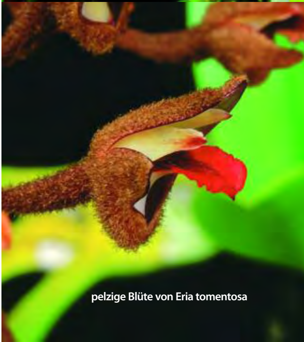
pelzige Blüte von Eria tomentosa