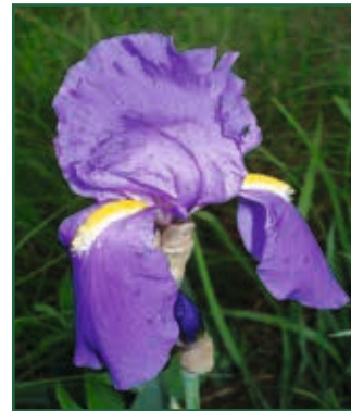
Cengialto-Schwertlilie, Iris pallida subsp. cengialti