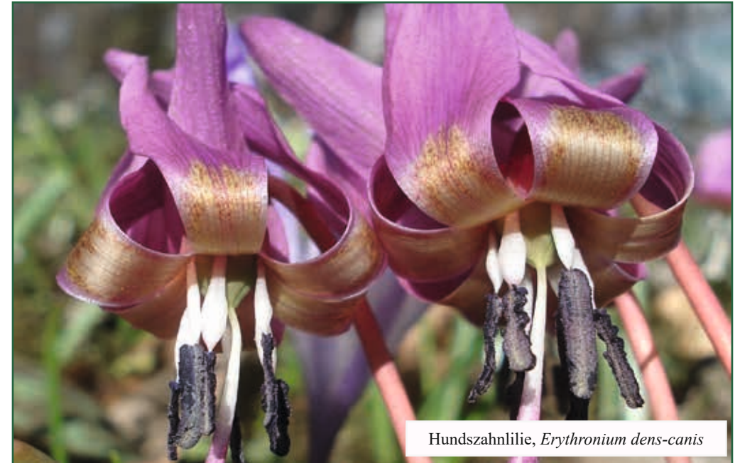
Hundszahnlilie, Erythronium dens-canis

blume, Fritillaria messanensis ; Gras-Schwertlilie, Iris graminea ; Muschelblümchen, Isopyrum thalictroides ; Riesen-Taubnessel, Lamium orvala ; Bunt-Platterbse, Lathyrus venetus ; Echt-Pfingst-rose, Paeonia officinalis ; Rotblatt-Rose, Rosa glauca ; Fuchsschwanz-Klee, Trifolium rubens