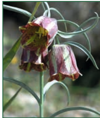
Messana-Schachbrettblume, Fritillaria messanensis F. SCHREIBER