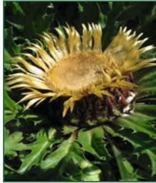
Akanthus-Eberwurz, Carlina acanthifolia