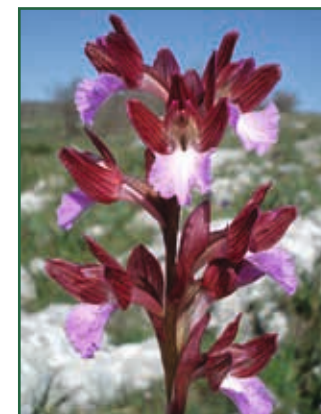
Schmetterling-Hundswurz Anacamptis papilionacea