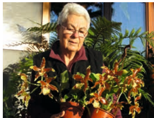
Rossioglossum Maria Heuberger

Es stimmt einen Naturfreund sehr nachdenklich, wenn sogar so wertvolle prächtige Pflanzen wie Rossioglossum hagsaterianum ein so trauriges Schicksal erleiden müssen.