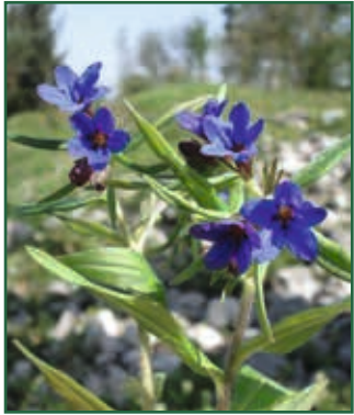
Purpurblau-Rindszunge, Buglossoides purpurocaerulea