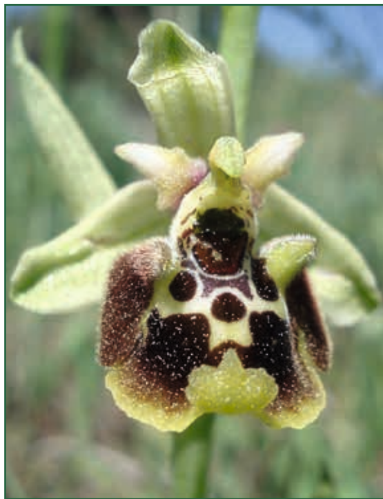
Untchj-Ragwurz, Ophrys untchjii