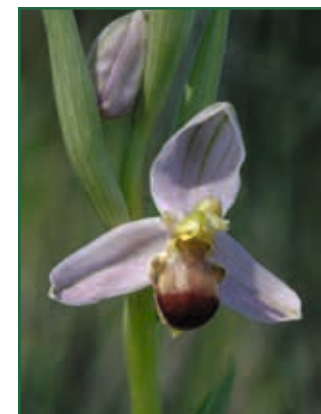
Zweifarbige Bienen-Ragwurz, Ophrys apifera var. bicolor P. HUBERT