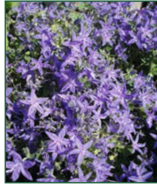
Istrien-Glockenblume, Campanula fenestrellata ssp. istriaca