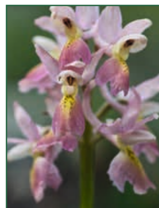
Orchis masula subsp. speciosa x O. pauciflora K. SCHUBERT