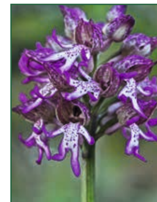
Orchis purpurea x Orchis simia , B. SCHUBERT