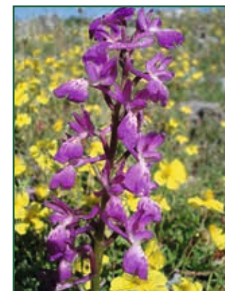
Orchis mascula subsp. speciosa x O. provincialis