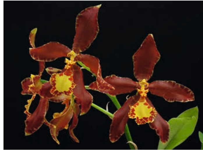
Rossioglossum hagsaterianum

Im Haus von Sr. Hake angekommen, öffnete uns eine jüngere Frau, die über unseren Besuch sichtlich erstaunt war und uns mitteilte, dass ihr Mann verreist sei und wir ihn daher leider nicht sprechen könnten. Wir konnten ihr mit unserem dürftigen Spanisch verständlich machen, aus welchem Grund wir aus dem fernen Österreich, für sie völlig unvermutet, bei ihr aufkreuzten. Wir wiesen vorsichtshalber besonders darauf hin, dass wir zwar an der von ihrem Mann entdeckten und