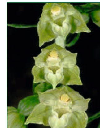
Dinarisch-Ständelwurz, Epipactis leptochila subsp. dinarica S. HERTEL