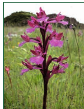
Anacamptis morio x A. papilionacea K. SCHEBESTA