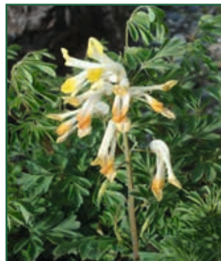
Weiß-Scheinerdrauch, Pseudofumaria alba