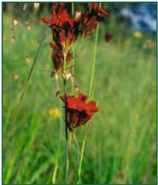
Blut-Nelke, Dianthus sanguineus