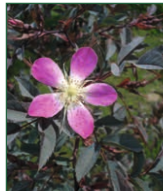
Rotblatt-Rose, Rosa glauca