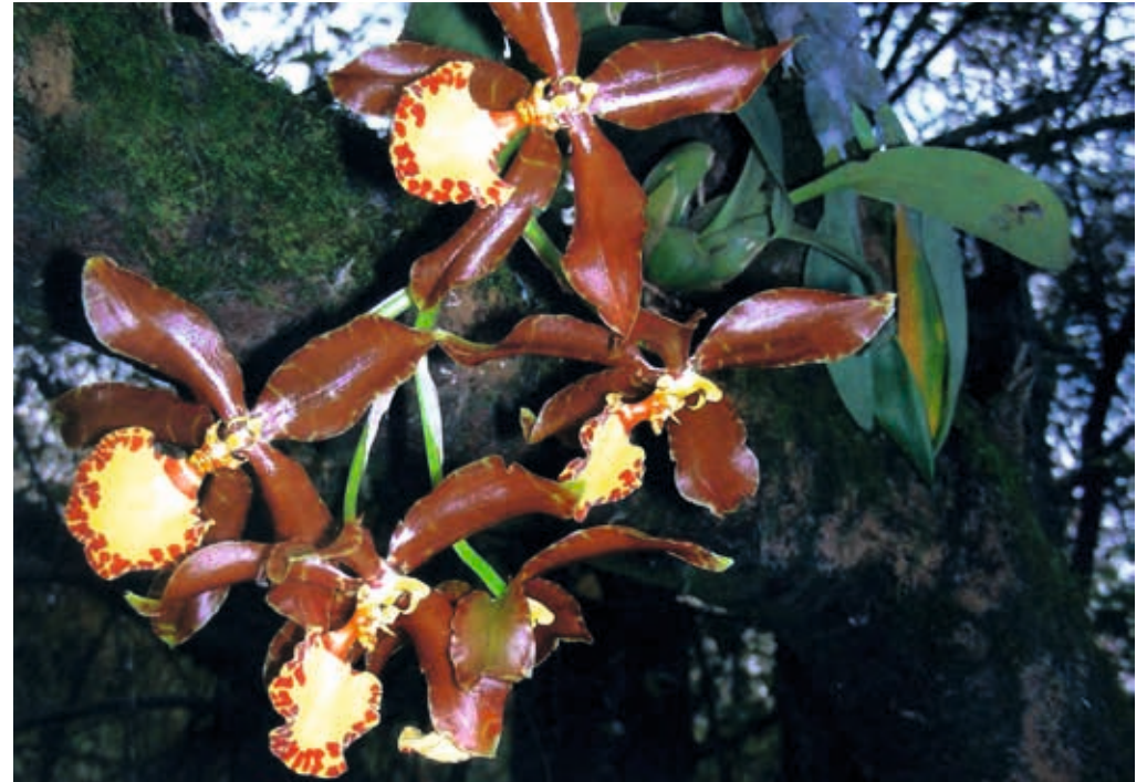
Rossioglossum hagsaterianum und Euchile citrina (rechts oben) am Naturstandort