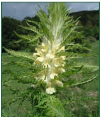
Hörmann-Läusekraut, Pedicularis hoermanniana