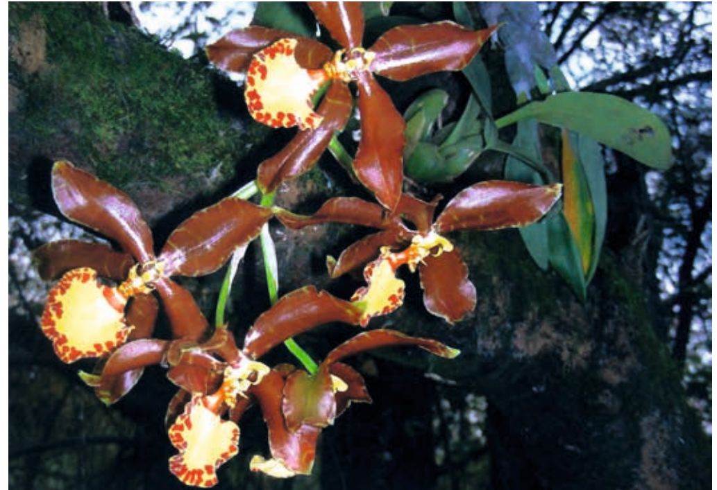
Rossioglossum hagsaterianum und Euchile citrina (rechts oben) am Naturstandort