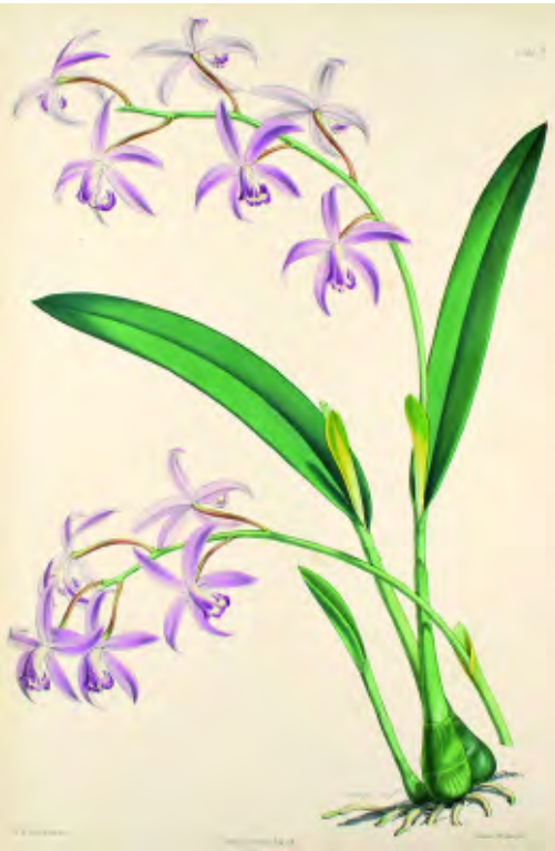
Sophronitis crispata (Laelia rupestris), Robert Warner, Select Orchidaceous Plants, 1865–1875, Tafel 6

Für die systematisch-taxonomische Forschung sind Herbarien nach wie vor von größter Wichtigkeit. Sie dienen als Vergleichssammlungen und sind wichtige Quellen für Revisionen,