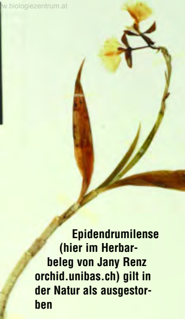
Epidendrumilense (hier im Herbar- beleg von Jany Renz orchid.unibas.ch) gilt in der Natur als ausgestor- ben

Frischimporte aus Asien oder Südamerika, die zwar offiziell als künstliche Nachzuchten gehandelt und auch mit Papieren ausgestattet wurden, in Wirklichkeit aber garantiert Naturentnahmen sind, die nur aus einem Grund aus dem Regenwald gerissen wurden: Um unsere Gier nach günstigen seltenen Pflanzen zu befriedigen. Und wenn Orchideen zu kommerziellen Zwecken gesammelt werden, beschränkt sich die Sammlung nicht auf die „vom Baum gefallene“ Pflanze am Wegesrand. Da wird alles gesammelt, was nicht weglauen kann.