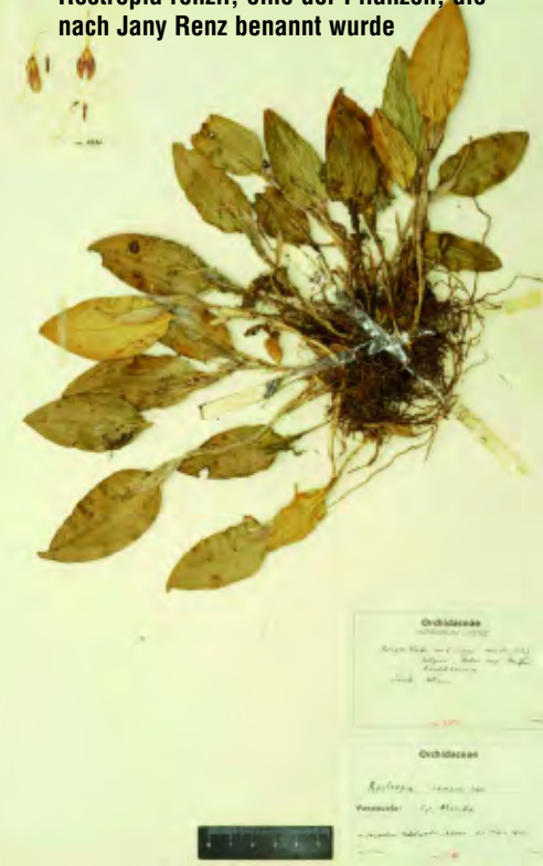
Restrepia renzii , eine der Pflanzen, die nach Jany Renz benannt wurde

Der Dachstock seines Wohnhauses enthielt sein privates Herbarium mit 20.000 Belegen, einschließlich sämtlicher Typen der von ihm neu beschriebenen Orchideentaxa sowie eine der weltweit umfangreichsten Bibliotheken mit Orchideenliteratur.