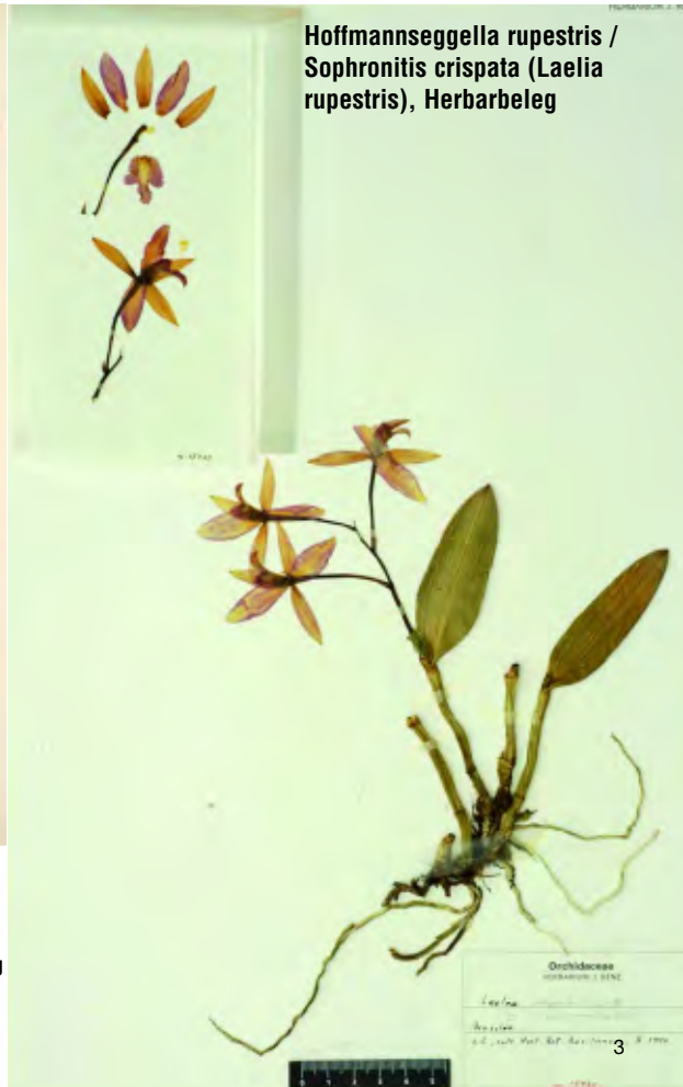
Hoffmannseggella rupestris / Sophronitis crispata (Laelia rupestris), Herbarbeleg