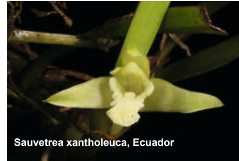
Sauvetrea xantholeuca, Ecuador