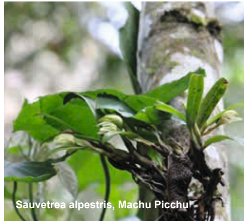
Sauvetrea alpestris, Machu Picchu