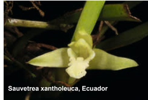
Sauvetrea xantholeuca, Ecuador