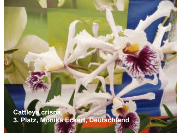
Cattleya crispa , 3. Platz, Monika Eckert, Deutschland

Der D.O.G.-Vorstand ist in diesem Fall stets bemüht, einen erfahrenen Bewerber als Betreuer zur Verfügung zu stellen.