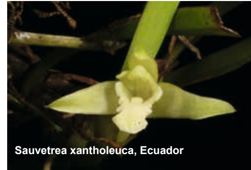
Sauvetrea xantholeuca, Ecuador