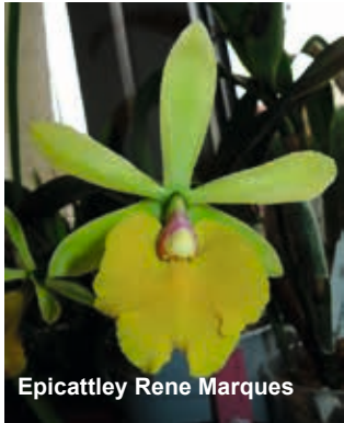
Epicattleya Rene Marques