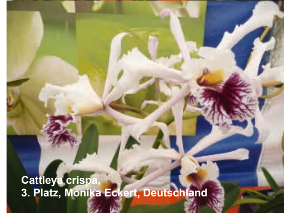
Cattleya crispa , 3. Platz, Monika Eckert, Deutschland

Der D.O.G.-Vorstand ist in diesem Fall stets bemüht, einen erfahrenen Bewerber als Betreuer zur Verfügung zu stellen.