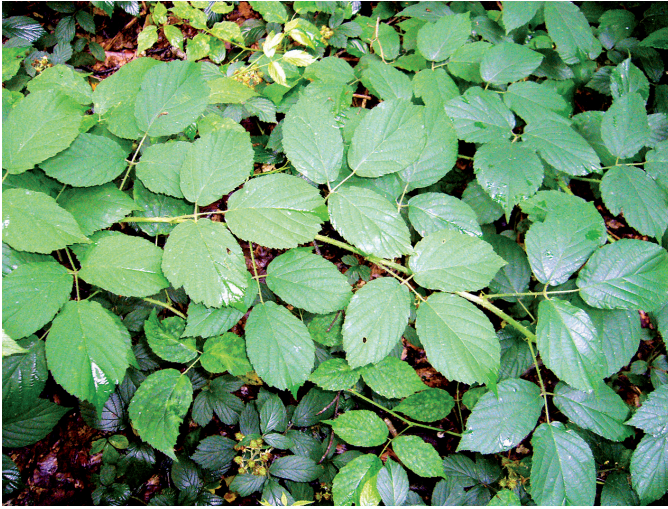
Abb. 1: Rubus hilsianus am Eselspatt in Osnabrück-Hellern (13.7.2007).

des Viertelquadranten, We 87.817.6 (Herb. We). – 3708/23: Weg westlich des NSG Gildehauser Venn, We 78.908.6 (Herb. We).