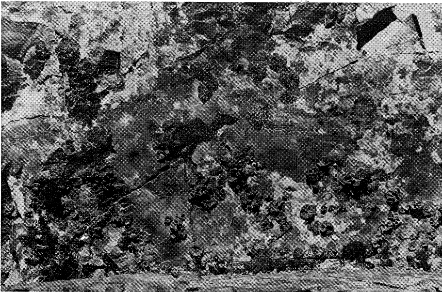
Abb. 1. Umbilicarietum cylindricae FREY mit vorherrschendem Omphalodiscus decussatus (VILL.) SCHOL. (dunkle Nabelflechte) und Acarospora oxytona (ACH.) MASS. (helle Krustenflechte) an nordexponierter Andesitstufe am Nordabfall der Montaña de Guajara, Las Cañadas, Tenerife (Abbildungsmaßstab 1 : 5)

auffallend breite mattschwarze Prothalluspartien sichtbar sind (Abb. 2). Die letzten können lückenhaft erscheinen, weil sie Unebenheiten der Unterlagen „umwachsen“. Anatomisch (Sporen braun, wenigzellig, 10–14 x 23–27 \mu\text{m} ) und chemisch (Sekundärstoffe Psoromsäure, Rhizocarpsäure) lassen sich keine Unterschiede zwischen kanarischem und mitteleuropäischem Sammelgut feststellen. Ursprünglich aus Sibirien beschrieben (RÄSÄNEN 1944), war die arktisch-alpine Krustenflechte bisher aus den Hochgebirgen Europas sowie den arktischen Klimagürteln Amerikas, Asiens und Europas bekannt (RUNEMARK 1956 b). In der temperaten Holarktis scheint Rhizocarpon frigidum RAES. nur in der alpinen Höhenstufe optimale Entwicklungsbedingungen zu finden.