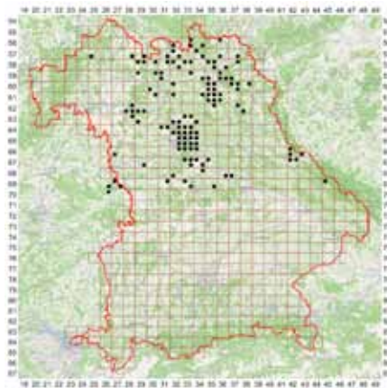
Karte 3: Rubus schleicheri , Verbreitung in Bayern. Kartenerstellung: GIS-Editor, SNSB IT-Center; Kartengrundlage: OpenStreetMaps.