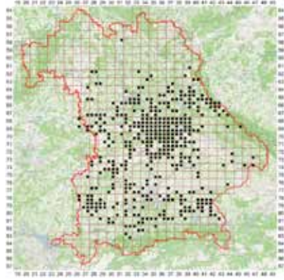
Karte 1: Rubus bavaricus , Verbreitung in Bayern. Kartenerstellung: GIS-Editor, SNSB IT-Center; Kartengrundlage: OpenStreetMaps.