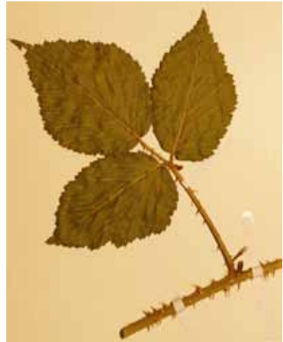
Abb. 9: Rubus meierottii , Herbarexemplar. Originalgröße ca. 14 × 12 cm.

Karten bei WEBER 1996 S. 184, MEIEROTT 2008 S. 486 und NETPHYD et al. 2013, S. 670.