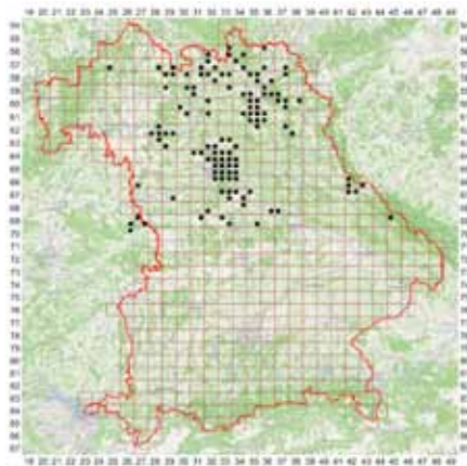
Karte 3: Rubus schleicheri, Verbreitung in Bayern.