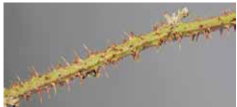
Abb. 2: Schössling von Rubus bavaricus . Natürliche Größe des Achsendurchmessers ca. 2 cm