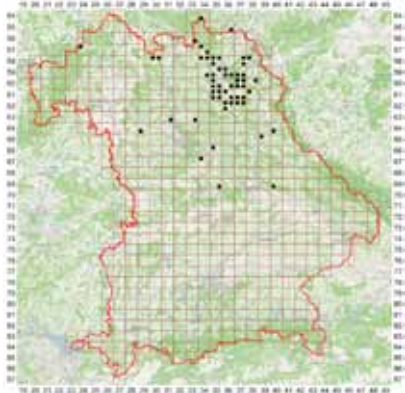
Karte 2: Rubus koehleri , Verbreitung in Bayern. Kartenerstellung: GIS-Editor, SNSB IT-Center; Kartengrundlage: OpenStreetMaps.

Verbreitung: Allgemeine Verbreitung herzynisch-polonisch, siehe bei KURTO et al. 2010 (Map 4437 S. 220). Während des Rubus-Konzils 2014 in der Oberlausitz wurde Rubus koehleri nahezu an jeder während der Exkursion aufgesuchten Stelle registriert. In Bayern ist Rubus koehleri durch die östlichen und nord-östlichen Mittelgebirge verbreitet (siehe Karte 2).