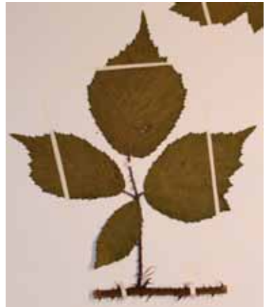
Abb. 12: Rubus schleicheriformis , Herbarexemplar.