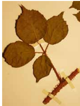
Abb. 6: Rubus koehleri , Herbarexemplar. Originalgröße ca. 16 × 15 cm.