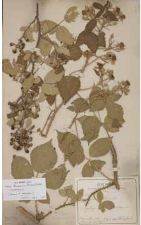
Abb. 1: Rubus bavaricus (Focke) Utsch, Lectotypus. Überseemuseum Bremen, Inventarnummer 0000083 gem. Lizenzvertrag v. 9.1.2015

Die Serie Hystrix umfasst in Europa nach KURTTO et al. (2010) 55 Arten, wobei ein Großteil mittelatlantische Verbreitung besitzt (hauptsächlich Britische Inseln). Die bayerischen Hystrix -Arten sind in der Regel gut und sicher zu erkennen, singuläre Formen oder Spontanhybriden treten, außer manchmal im Südwesten Bayerns, selten auf.