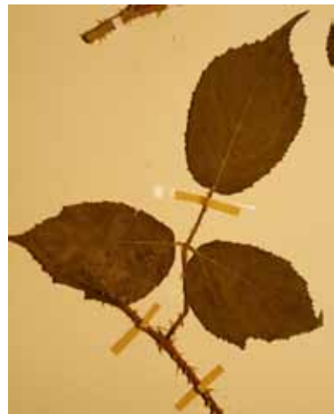
Abb 7: Rubus schleicheri , Herbarexemplar. Originalgröße ca. 20 × 17 cm.