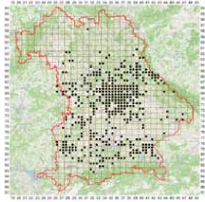
Karte 1: Rubus bavaricus, Verbreitung in Bayern.