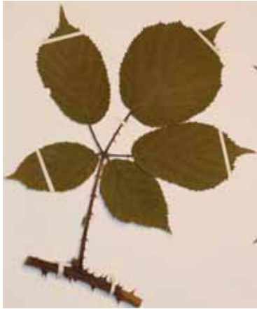
Abb. 11: Rubus thuringensis , Herbarexemplar. Aufn. W. Jansen.