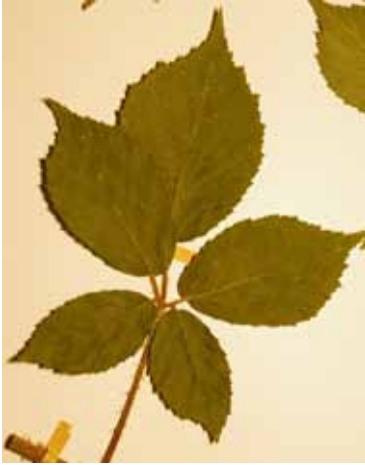
Abb. 8: Rubus apricus , Herbarexemplar. Originalgröße ca. 20 × 18 cm.

Verbreitung: Vom Donaurand durch ganz Mitteleuropa bis zur Ostsee, nach Osten bis ins zentrale Polen. In Bayern fehlt Rubus schleicheri südlich der Donau. (siehe Karte 3) Weitere Karten bei KURTTO et al. Map 4452 S. 225 und NETPHYD et al. 2013 S. 677.