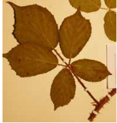
Abb. 10: Rubus dasyphyllus , Herbarexemplar. Originalgröße ca. 22 × 15 cm.