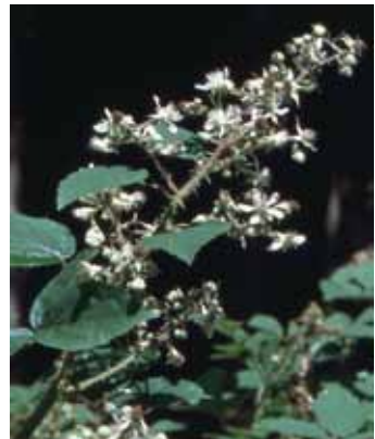
Abb. 4 und 5: Rubus bavaricus . Links: Beblätterter Schössling, am Blattrand ist stellenweise die „grau-bäuchige“ Unterseite der Blätter zu sehen. Rechts: Blütenstand. An sonnigen Waldstandorten kann die bayerische Brombeere umfangreiche und deutlich pyramidale Blütenstände entwickeln.