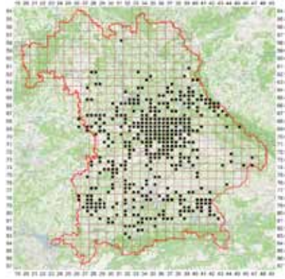
Karte 1: Rubus bavaricus, Verbreitung in Bayern.