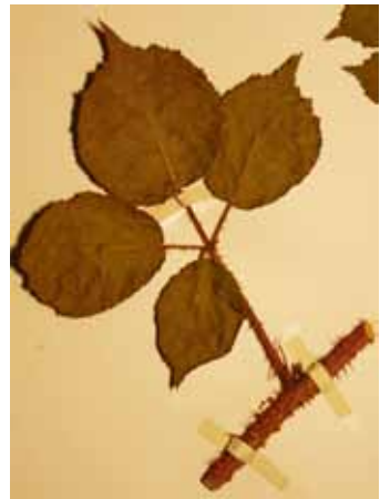
Abb. 6: Rubus koehleri , Herbarexemplar. Originalgröße ca. 16 × 15 cm.