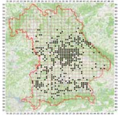
Karte 1: Rubus bavaricus , Verbreitung in Bayern. Kartenerstellung: GIS-Editor, SNSB IT-Center; Kartengrundlage: OpenStreetMaps.