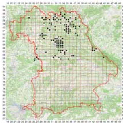
Karte 3: Rubus schleicheri, Verbreitung in Bayern.