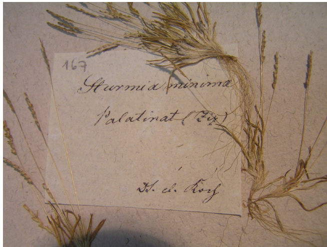
Abb. 1: Schede von Sturmia minima ( Mibora minima ) aus dem Palatinat (Pfalz) mit den Namen Ziz und Koch

Begründet wurde das „Herbarium Erlangense“ ab dem Jahr 1824, als Wilhelm Daniel Joseph Koch (1771-1849) nach Erlangen berufen wurde, wo er bis zu seinem Tode wirkte. Er galt als der bedeutendste deutsche Botaniker mit organismisch orientierter Ausrichtung seiner Zeit. Sein Hauptwerk, die „Synopsis florae germanicae et helveticae“ (1836) war das Standardwerk der deutsch-