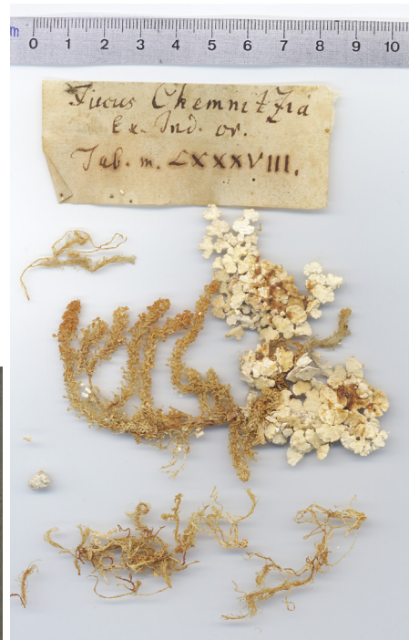
Abb. 3: Typus von Fucus chemnitzia Esper