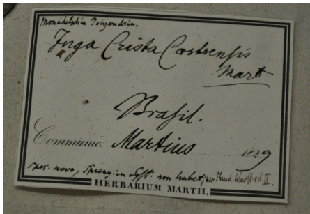
Abb. 2: Schede von Inga crista castrensis aus Brasilien von Martius, 1829