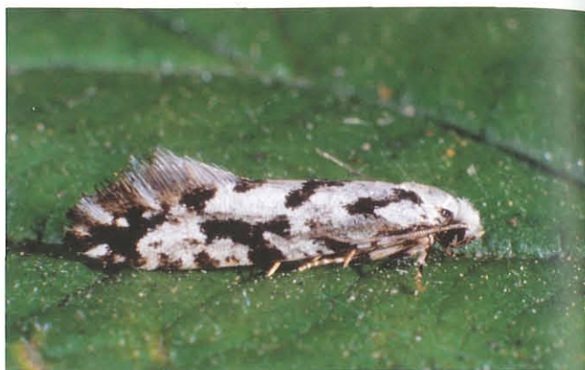
Abb. 10: Nemapogon nigralbella .

Die Art wurde bereits bei Höfner (1909–1918) für Kärnten unter dem heutigen Synonym Tinea albipunctella Hw. angegeben. Bei Huemer & Tarmann (1993) scheint die Art nicht auf und fehlt in weiterer Folge auch in der Checkliste (Wieser & Huemer 1999) für Kärnten. Bei Wieser (2003a) wird die Art als Neufund für Kärnten aus den Sattnitzwänden angegeben. Mittlerweile konnte Nemapogon wolffiella von mehreren Fundorten, unter anderem der Gipritze, bestätigt werden.