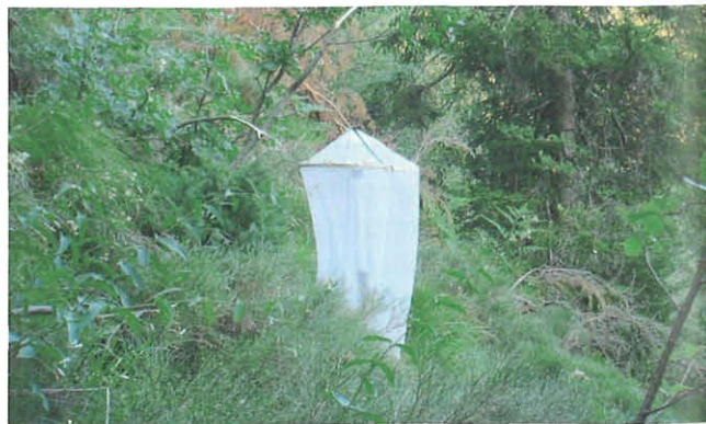
Abb. 6: Leuchtturm im Kugelginsterbestand.