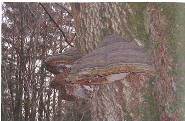
Abb. 11: Buchenschwamm.