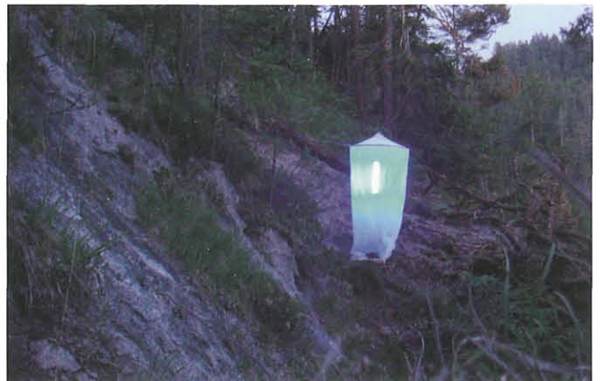
Abb. 3: Das superaktinische Licht zieht auch winzige Kleinschmetterlinge wie Zwergmotten an, um durch den Entomologen registriert zu werden.

Neben der klassischen Methode, tagaktive Arten mittels Beobachtung oder Käscherfang zu registrieren, lag das Hauptaugenmerk auf der Erhebung der Imagines von Nachtfaltern. Für die Erfassung von größeren und flugaktiveren Arten eignen sich automatische Minnesota-Jermy-Lichtfallen (Wieser 1986) im Dauerbetrieb bzw. Kübellichtfallen (Abb. 2) recht gut, allerdings ist für kleine bis sehr kleine Arten der Einsatz von Leuchttürmen mit persönlicher Dauerbeobachtung unumgänglich. Kleine und gewichtsmäßig verhältnismäßig leichte Arten sind in den Fallen eher Zufallsfänge, da sich die Tiere bestenfalls um die Lichtquelle oder in den Trichter setzen und nicht in das Fanggefäß fallen.