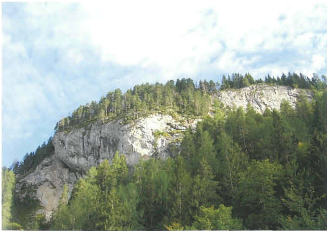
Abb. 1: Die überhängenden Felsen der Freiwand prägen die Landschaft nördlich von St. Lorenzen im Gitschtal.

Nördlich von St. Lorenzen im Gitschtal sticht die überhängende Felsformation der Freiwand aus den steilen Abhängen der Gailtaler Alpen hervor (Abb. 1). Durch die südexponierte und somit xerotherme Lage haben sich vor allem in den unterhalb anschließenden Steilhängen der Gipritze flächige Felssteppen mit einer spezialisierten Flora und Fauna entwickelt.