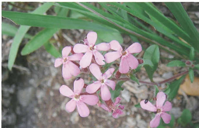
Abb. 15: Saponaria ocymoides (Rotes Seifenkraut).

Ex.; Madatsche N Hermagor, 11.8.2004, 1 Ex.; Gipritze, 29.7.2005, 5 Ex.; 16.7.2007, 4 Ex.