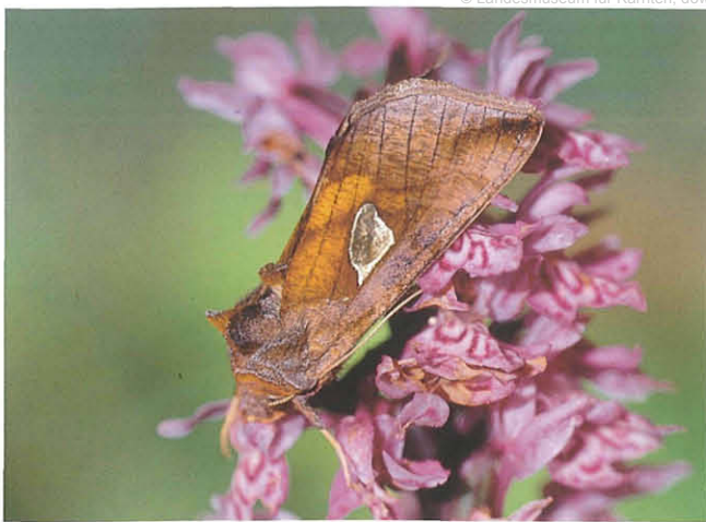
Abb. 19: Autographa bractea .