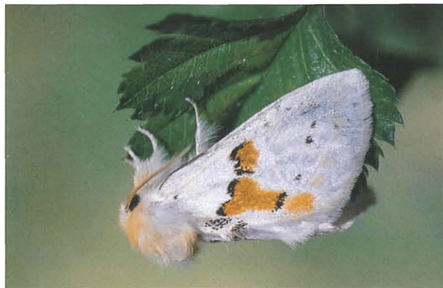
Abb. 18: Leucodonta bicoloria .

Ulrichsberg, Maria Saaler Berg (Thurner 1948). Auf der Gipritze dürfte Chesias rufata auf Genista radiata leben.