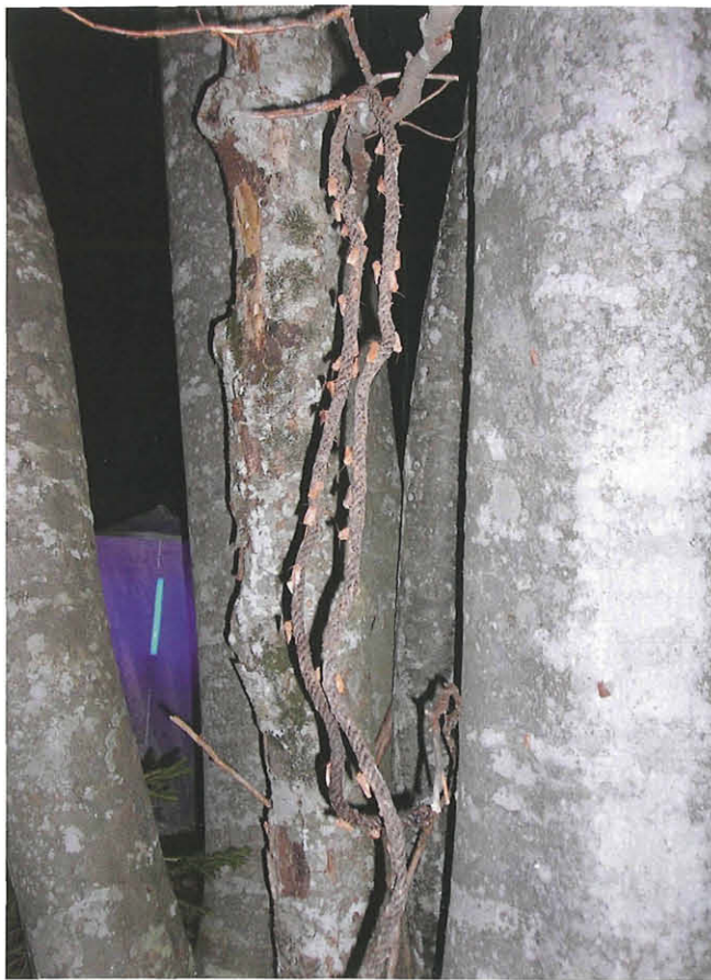
Abb. 4: Köderschnur mit Nachtfalter und Leuchtturm im Hintergrund.

Ergänzend erfolgte Dämmerungsfang mit dem Käscher und Köderfang mit Pheromonen für Glasflügler (Sesiidae) und im Frühlings- und Herbstaspekt mit Weinköder (Abb. 4) für diverse Eulenfalter (Noctuidae) und Spanner (Geometridae).