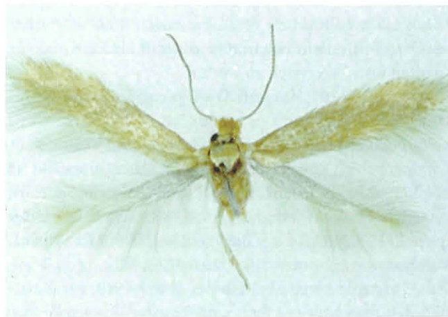
Abb. 8: Trifurcula cytisanthi A. & Z. Laštuvka, 2005.

Diese Zwergmotte wurde bisher nicht aus Kärnten nachgewiesen. Laut Laštuvka & Laštuvka (1997) leben die Larven der 4–5 mm Flügelspannweite messenden Art blattminierend in den Blättern von Salix sp., speziell in Salix incana und S. eleagnos (Lavendelweide). Im Umfeld der Vernässungen und am Rand des Forstweges sind entsprechende Salix -Bestände vorhanden.