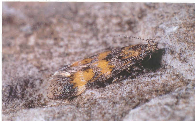
Abb. 14: Athrips amoenella .