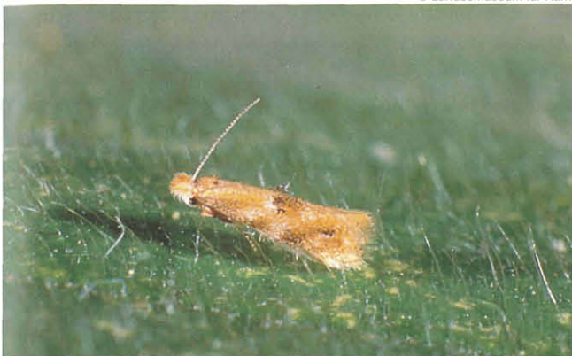
Abb. 12: Bucculatrix demaryella .