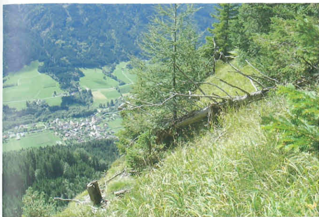
Abb. 7: Oberer Rand der Freiwand mit St. Lorenzen im Gitschtal im Hintergrund.

am verwachsenen Weg. Als botanische Besonderheit für Kärnten mit einem nicht geringen Einfluss auf die Artzusammensetzung der Schmetterlingsfauna sind die Bestände an Kugelginster ( Genista radiata ) (Abb. 6). Bei Wieser (1986, 1990) wurde der Ginster noch fälschlicherweise als Genista tinctoria (Färberginster) angesprochen. Der Standort des Kugelginsters wurde erst in den letzten Jahren durch Botaniker (G. Leute, W. Franz mündl. Mitt.) bestätigt. Als weitere typische wärmeliebende Gehölzarten der Felsabhänge sind Fraxinus ornus (Mannaesche), Ostrya carpinifolia (Hopfenbuche), Sorbus aria (Mehlbeere) und Amelanchier ovalis (Felsenbirne) zu erwähnen. Ergänzend stammen einzelne Fundmeldungen in der Artenliste aus dem oberen Randbereich der Freiwand (Abb. 7) vom so genannten Freiboden aus einer Seehöhe von etwa 1340 m (siehe Artenliste).