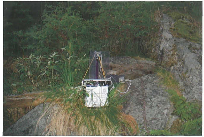
Abb. 2: Vor allem für den Nachweis flugtüchtiger Nachtfalter eignen sich Kübellichtfallen mit Schwarzlicht optimal. Aufn. Ch. Wieser

Lepidopterologische Untersuchungen werden durch den Autor in dem Gebiet um die Freiwand bereits seit Anfang der achtziger Jahre des vorigen Jahrhunderts durchgeführt. Im Rahmen einer Dissertation (Wieser 1986) erfolgte ein zweijähriger Lichtfallenzyklus (1983, 1984), wobei allerdings nur ausgesuchte Schmetterlingsfamilien (so genannte Großschmetterlinge) behandelt wurden. In den Folgejahren sind weitere stichprobenartige faunistische Erfassungen durchgeführt und gesammelt publiziert worden (Wieser 1990). Die zum Teil faunistisch hochinteressanten Ergebnisse führten zwangsläufig dazu, dass mit der Ausweitung der Untersuchungsschwerpunkte des Autors auf die gesamte Schmetterlingsfauna die Felssteppen der Gipritze erneut in den Blickpunkt gerückt sind.