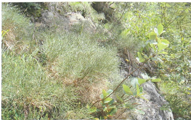
Abb. 9: Kugelginster in Knospe.

terbeständen ( Genista radiata ) in Italien erstmals nachgewiesen werden. In der Sammlung des Landesmuseum Kärnten befindet sich eine Serie (15 Exemplare, davon 2 Paratypen) der Art, die am 26.7.2003 im Bereich der Sella di Grubia SW des Monte Canin in den Julischen Alpen in der Dämmerung um Kugelginster schwärmend gefangen wurde (leg. Ch. Wieser, det. A. Laštuvka). Bei der Überprüfung der Nepticuliden aus der Sammlung Wieser durch A. Laštuvka wurde auch ein am Licht gefangenes Exemplar von Trifurcula cytisanthi von der Gipritze aus dem Beschreibungsjahr 2005 stammend bestätigt. Parallel dazu wurde durch G. Leute und W. Franz das Vorkommen von Genista radiata (Abb. 9) im Bereich des Gitschtales (Schwarze Wand) bekannt und die starken Bestände auf der Gipritze nach dem Hinweis des Autors als Kugelginster bestimmt.