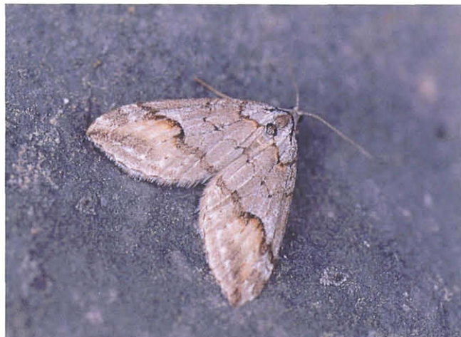
Abb. 17: Chesias rufata .

Von dieser ebenfalls an Ginster lebenden Spannerart gibt es außerhalb des Bereiches um die Freiwand (Gipritze, Paulwand, Jadersdorfer Alm) nur ältere Funde von Wolfsberg,