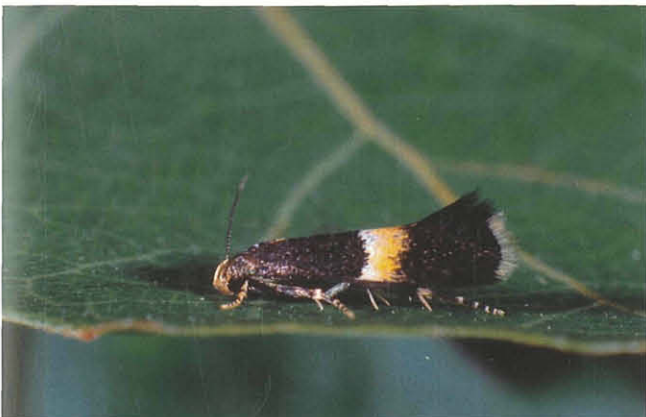
Abb. 13: Elachista bisulcella .