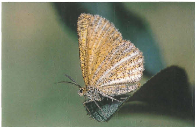
Abb. 16: Isturgia limbaria rablensis .

Bei Huemer & Tarmann (1993) für Kärnten ausgewiesen. Bei Thurner (1948) nur von Raibl aus dem heutigen Slowenien genannt. Vermutlich wurde dieser ehemals