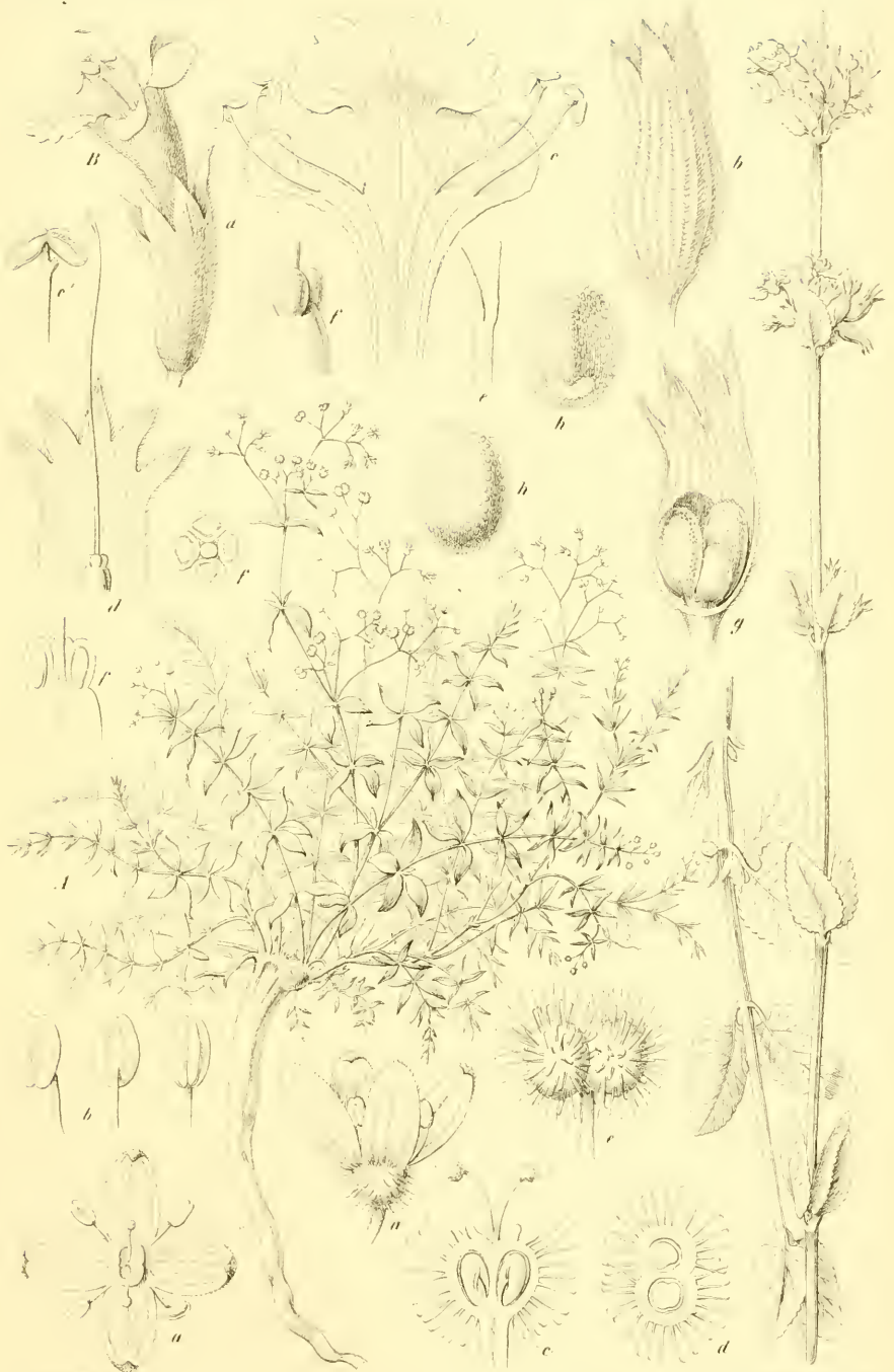
A. Galium Jemenense Kotschy.