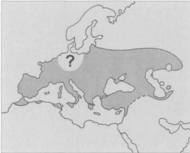
Abb. 1: Verbreitungsgebiet von Emys orbicularis . Insbesondere in Mitteleuropa ist unklar, wo die natürliche Arealgrenze verläuft.

Zweifellos wanderten die Vorfahren der heutigen Europäischen Sumpfschildkröte von Nordamerika nach Eurasien ein. Nach allem, was wir wissen, geschah dies im Miozän oder Oberoligozän, vor 15-29 Millionen Jahren, über die Beringbrücke (HUTCHISON 1981). Von Ostasien aus drangen diese Vorläufer von E. orbicularis immer weiter nach Westen vor. Die ältesten bislang bekannten Fossilien stammen aus dem mittleren Miozän im zentralen Kasachstan (CHKHIKVADE 1989); die Funde aus weiter westlich gelegenen Regionen sind durchweg jüngeren Datums (FRITZ 1995a). Heute besiedelt E. orbicularis unter den Schildkrötenarten der Welt eines der größten Areale. Es erstreckt sich von Nordafrika nörd-