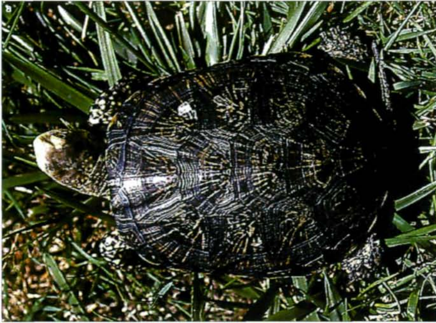
Abb. 5 a, b: Emys o. occidentalis (Weibchen aus der Umge- bung von Ifrane, Marokko) Dorsalansicht (a), Ventralansicht (b)