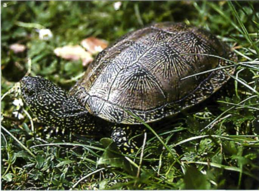
Abb. 3 a, b: Emys o. fritzjuergenobsti (Männchen aus Valencia, Spanien) Dorso-lateral-Ansicht (a), Ventralansicht (b). Südliche Unterarten wie z. B. E. o. fritzjuergenobsti sind in der Regel heller gefärbt und kleiner als Vertreter nördlicher Sub- spezies