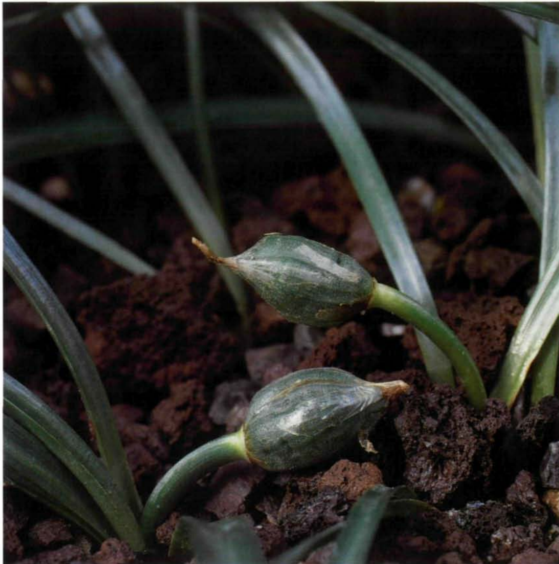
Abb. 4: Sternbergia schuberti , Fruchtstände, 28.2.2001.

Perigon oben blumenkronenartig, gelb, sechsgeteilt. Röhre aufrecht, zylindrisch, sich nach oben zu ein wenig verbreiternd, 8-9 linig, innen kahl, 6 Perigonsegmente, länglich-linealisch, stumpf, die äußeren etwas breiter, 3-6 mm breit, die inneren schmaler, 2-4 mm, nach unten schmaler zulaufend, alle einander gleich, 3-8 cm lang, glatt, nervig gestreift. 6 Staubblätter am oberen Ende der Perianthröhre eingesetzt, 3 längere Filamente, 2,5 cm lang, 3 kürzere, 1,8 cm lang, aufrecht, glatt, fadenförmig, Fruchtknoten sitzend, länglich, unterständig, 4 mm breit, 8-10 mm lang, grün. Griffel fadenförmig, gerade, etwa gleichlang wie die Antheren, Narbe stumpf