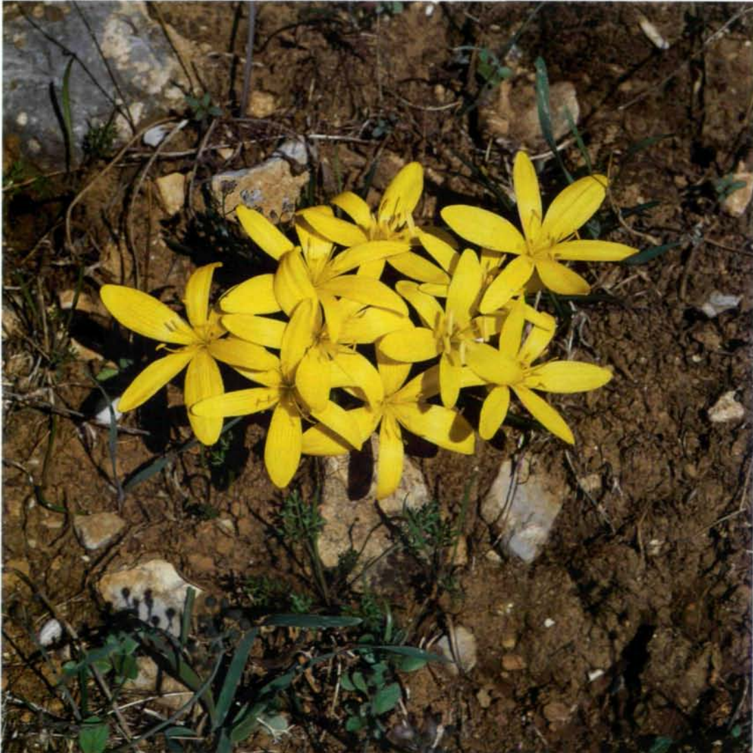
Abb. 2: Sternbergia sicula auf Kreta, 16.11.1994.

genförmig überhängend und oft den Boden berührend. Stängellänge zur Blütezeit 0,3-5(7)cm über der Erde, sich während der Fruchtreife bogenförmig zur Erde neigend. Blütenscheide 2,5-4 cm. Blüten sitzend, dottergelb; Perianthröhre 4-10 mm; Segmente verkehrt lanzettlich (manchmal sehr schmal), am oberen Ende gelegentlich kapuzenförmig zusammengezogen, 2-3 x (0,5)0,8-1,2(2) cm, Filamente 1-1,7cm. Samen mit Elaiosom.