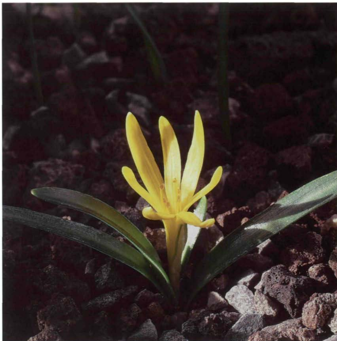
Abb. 9: Sternbergia pulchella in Kultur, 17.10.2000.

Im Habitus erinnert S. pulchella an S. schubertii . Letztere unterscheidet sich jedoch deutlich durch die viel längere Perianthröhre und die deutlich längere Blütenscheide sowie durch die längeren und breiteren Segmente.