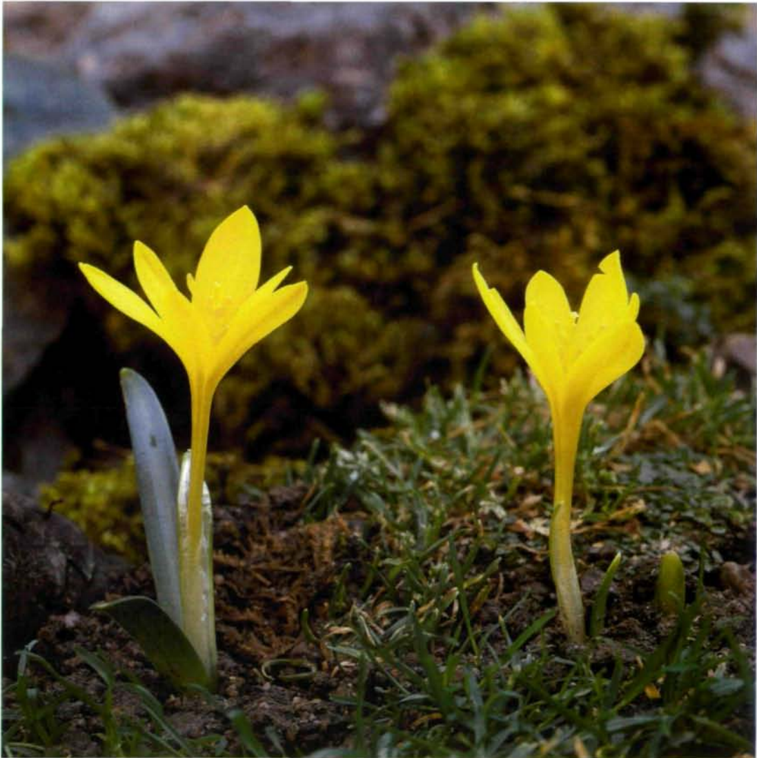
Abb. 3: Sternbergia schuberti in Kultur, 13.9.1999.

"Die Art zwischen Sternbergia citrina SIBTH. (heute S. colchiciflora WALDST. & KIT.) und S. lutea KER stehend und von beiden dennoch deutlichst unterschieden. Unterscheidet sich von ersterer durch die oben zweilappige Spathe, die geschlossenen Perianthsegmente und die stumpfe Narbe; von der anderen durch die Blütenscheide, die fast bis zur Blütenkrone reicht, die linealischen Perianthsegmente sowie durch den mit den Antheren fast gleich langen Griffel."