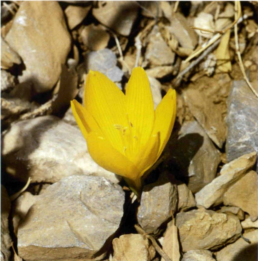
Abb. 7: Sternbergia clusiana in der SW-Türkei, 9.11.1992.

K u l t u r : Um gut oder überhaupt zu blühen, braucht S. clusiana in Kultur eine lang ausgeprägte, trocken-warme Ruhephase. Diese lohnt sie mit einem unglaublich schönen Flor, der jedoch, wie bei allen Sternbergien, ziemlich schnell vergeht.