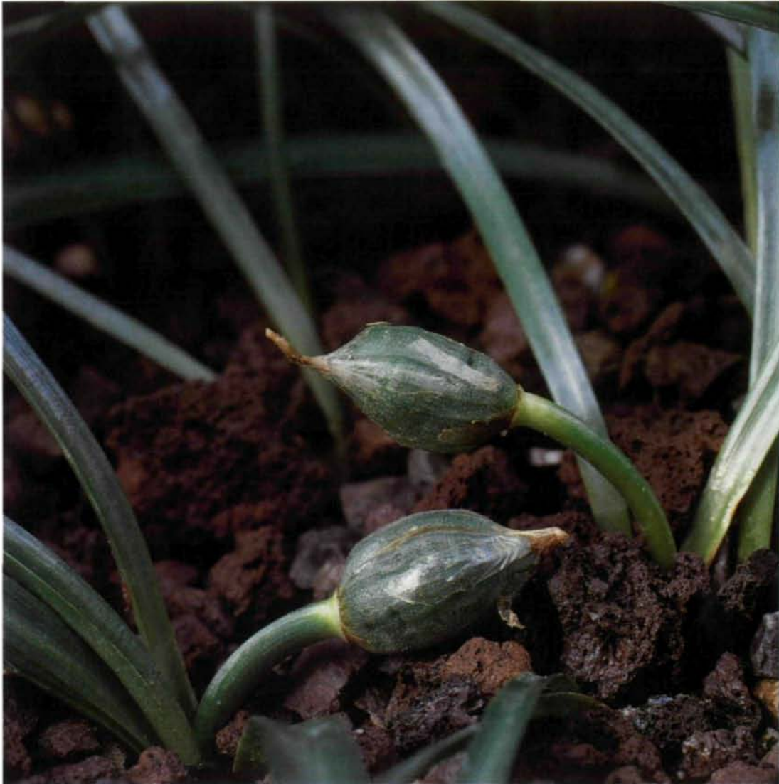
Abb. 4: Sternbergia schuberti , Fruchtstände, 28.2.2001.

Perigon oben blumenkronenartig, gelb, sechsgeteilt. Röhre aufrecht, zylindrisch, sich nach oben zu ein wenig verbreiternd, 8-9 linig, innen kahl, 6 Perigonsegmente, länglich-linealisch, stumpf, die äußeren etwas breiter, 3-6 mm breit, die inneren schmaler, 2-4 mm, nach unten schmaler zulaufend, alle einander gleich, 3-8 cm lang, glatt, nervig gestreift. 6 Staubblätter am oberen Ende der Perianthröhre eingesetzt, 3 längere Filamente, 2,5 cm lang, 3 kürzere, 1,8 cm lang, aufrecht, glatt, fadenförmig, Fruchtknoten sitzend, länglich, unterständig, 4 mm breit, 8-10 mm lang, grün. Griffel fadenförmig, gerade, etwa gleichlang wie die Antheren, Narbe stumpf