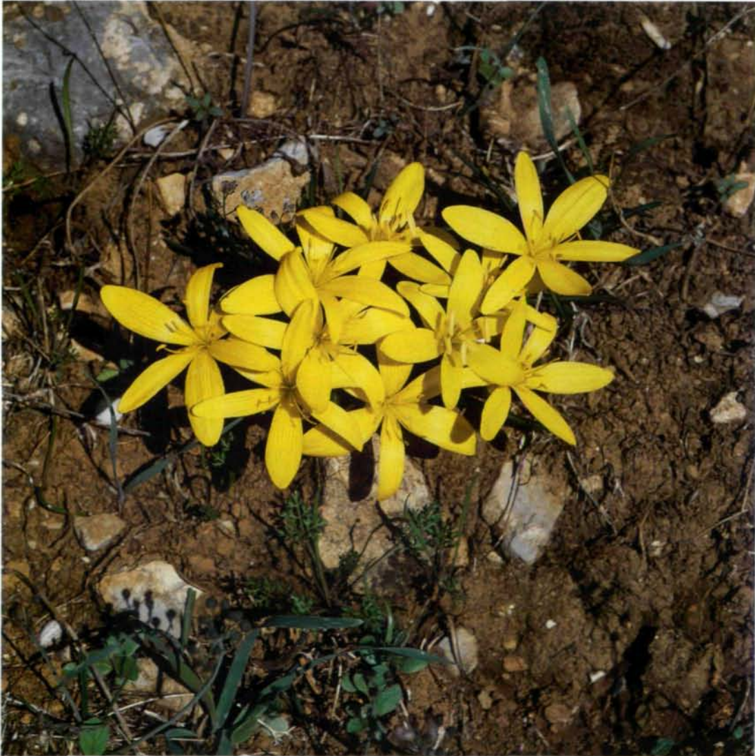
Abb. 2: Sternbergia sicula auf Kreta, 16.11.1994.

genförmig überhängend und oft den Boden berührend. Stängellänge zur Blütezeit 0,3-5(7)cm über der Erde, sich während der Fruchtreife bogenförmig zur Erde neigend. Blütenscheide 2,5-4 cm. Blüten sitzend, dottergelb; Perianthröhre 4-10 mm; Segmente verkehrt lanzettlich (manchmal sehr schmal), am oberen Ende gelegentlich kapuzenförmig zusammengezogen, 2-3 x (0,5)0,8-1,2(2) cm, Filamente 1-1,7cm. Samen mit Elaiosom.