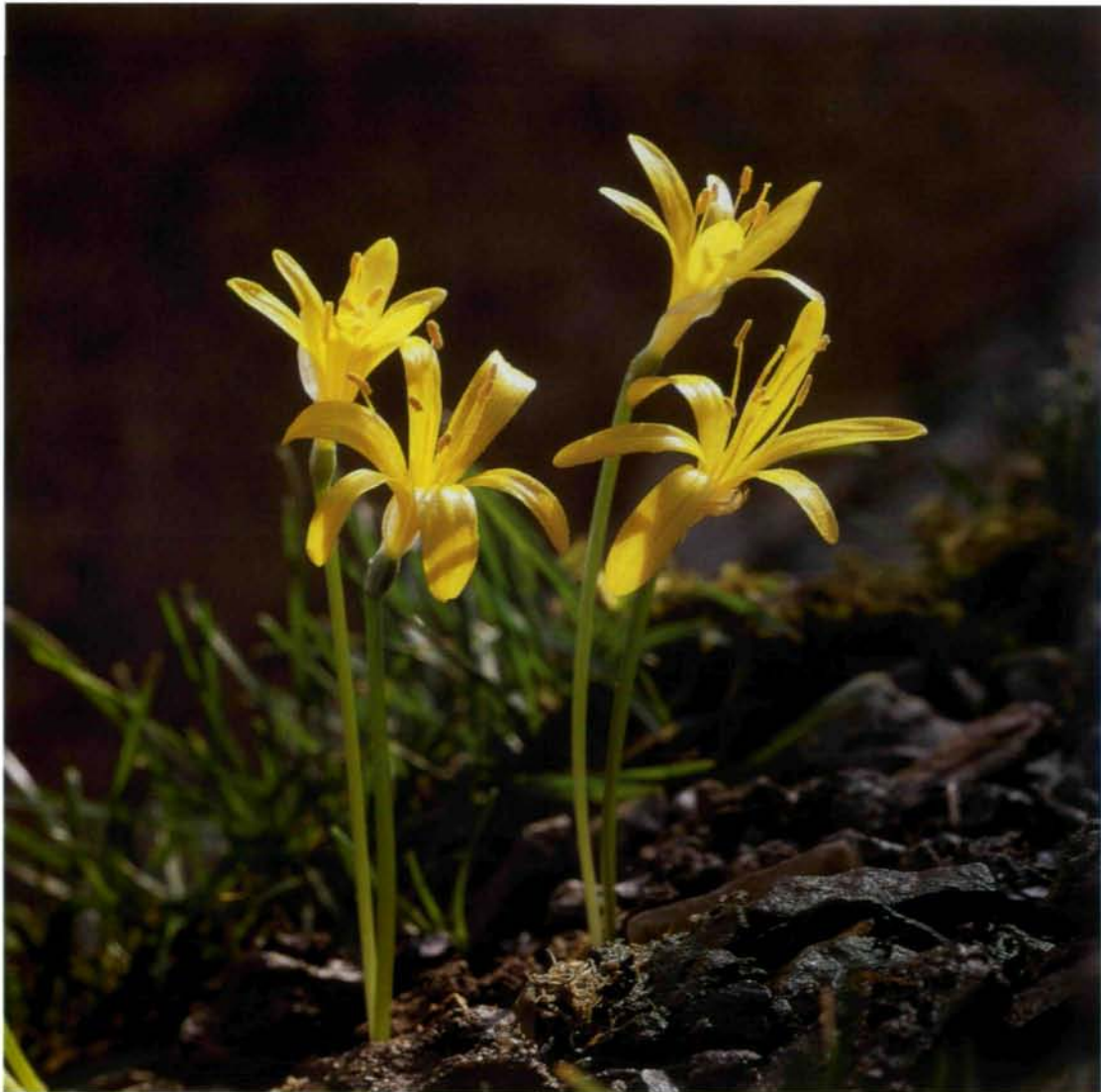
Abb. 10: Sternbergia greuteriana in Kultur, 13.10.1999.