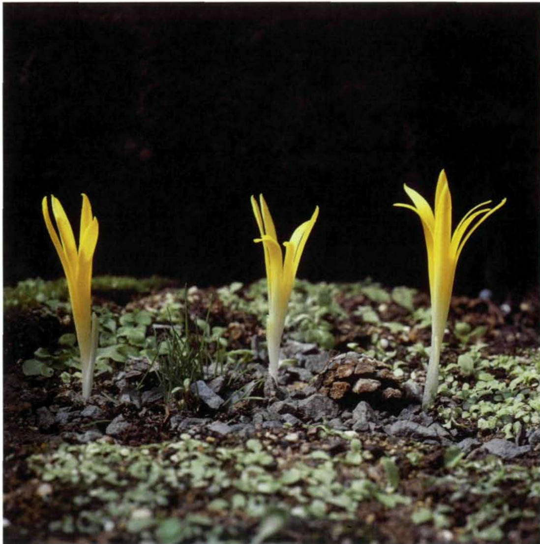
Abb. 8: Sternbergia colchiciflora in Kultur, 4.8.1981.

S y n o n y m e: Narcissus autumnalis minor CLUSIUS, Rar. Pl. Hist. 164 (1601); Amaryllis colchiciflora (WALDST. & KIT.) KER-GAWL. In Curtis's Bot. mag. 27: sub t. 1089 (1808); Amaryllis etnensis RAF., Carat. 84, t. 18 f. 3 (1810), Chloris 12 (1815) als A. aetnensis ; Oporanthus colchiciflorus (WALDST. & KIT.) HERBERT (1827); Sternbergia aetnensis (RAF.) GUSSONE, Fl. Sic. Prodr. 1: 395 (1827); S. colchiciflora var. aetnensis (RAF.) ROUY in Bull. Soc. Bot. France 31: 182 (1884).