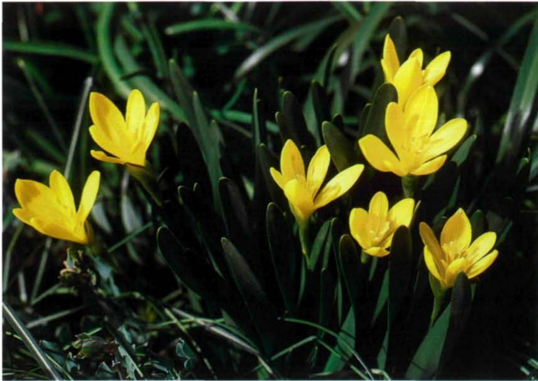
Abb. 5: Sternbergia fischeriana in Kultur.

Kultur: Sternbergia fischeriana und S. candida repräsentieren die beiden frühjahrsblühenden Arten der Gattung. Unter Kulturgesichtspunkten ist erstere eher von begrenzter Schönheit, wird schnell von Viren befallen und hat darüber hinaus die Unart, sich stark zu teilen und schlecht zu blühen. Letztere Eigenschaft hat sie mit der ihr eng verwandten S. candida gemeinsam. Tiefes Pflanzen der Zwiebeln wirkt dem Aufteilen entgegen. Der Blüherfolg hängt entscheidend von der Zwiebelgröße und der Gewährung einer ausgedehnten "Ausbackphase" während des Sommers ab. Zu diesem Zweck kann man die Zwiebeln aus der Erde nehmen und einige Monate an einem trocken-warmen Ort aufbewahren, der mindestens 22°C haben sollte. Gute Voraussetzungen bieten auch ein Gewächshaus oder Zwiebelkasten, wo die Pflanzen unter Glas während ihrer Ruhezeit warm und trocken gehalten werden können.