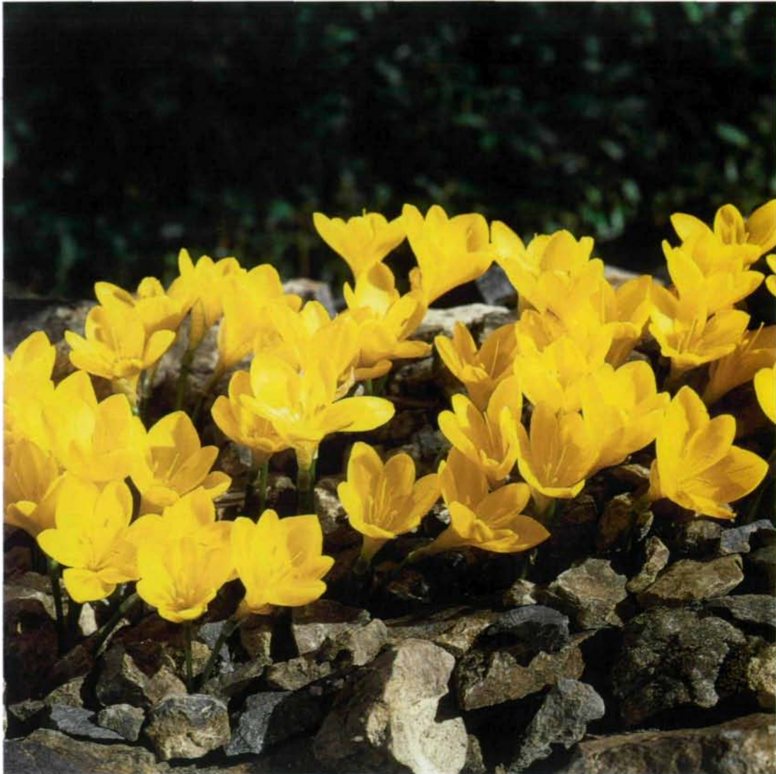
Abb. 1: Sternbergia lutea in Kultur, 4.10.1995.

In den achtziger Jahren wurden große Mengen Sternbergia lutea zu Kulturzwecken aus der Türkei nach Europa exportiert, die häufig mit S. clusiana durchmischt waren.