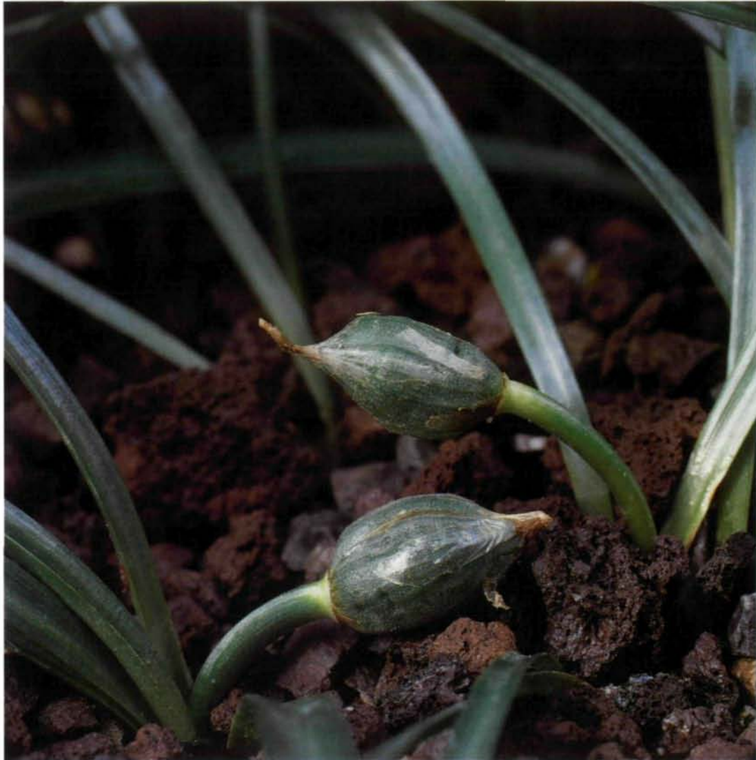
Abb. 4: Sternbergia schuberti , Fruchtstände, 28.2.2001.

Perigon oben blumenkronenartig, gelb, sechsgeteilt. Röhre aufrecht, zylindrisch, sich nach oben zu ein wenig verbreiternd, 8-9 linig, innen kahl, 6 Perigonsegmente, länglich-linealisch, stumpf, die äußeren etwas breiter, 3-6 mm breit, die inneren schmaler, 2-4 mm, nach unten schmaler zulaufend, alle einander gleich, 3-8 cm lang, glatt, nervig gestreift. 6 Staubblätter am oberen Ende der Perianthröhre eingesetzt, 3 längere Filamente, 2,5 cm lang, 3 kürzere, 1,8 cm lang, aufrecht, glatt, fadenförmig, Fruchtknoten sitzend, länglich, unterständig, 4 mm breit, 8-10 mm lang, grün. Griffel fadenförmig, gerade, etwa gleichlang wie die Antheren, Narbe stumpf