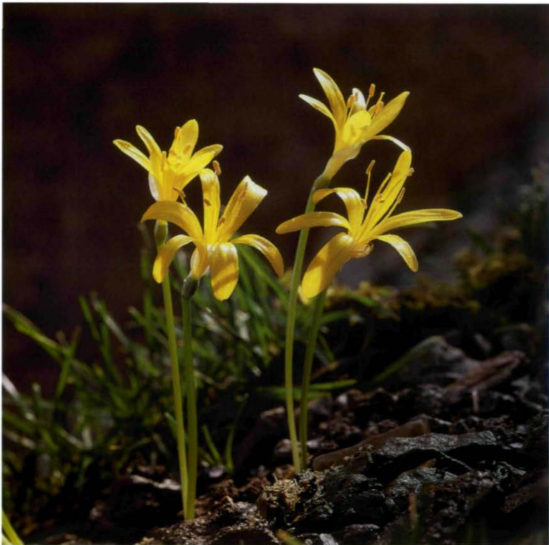
Abb. 10: Sternbergia greuteriana in Kultur, 13.10.1999.

S y n o n y m : S. sicula auct. plur. fl. cret., non TINEO ex GUSS.