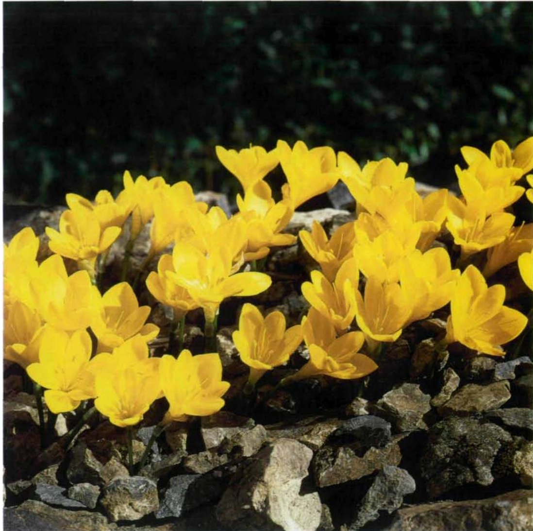
Abb. 1: Sternbergia lutea in Kultur, 4.10.1995.

In den achtziger Jahren wurden große Mengen Sternbergia lutea zu Kulturzwecken aus der Türkei nach Europa exportiert, die häufig mit S. clusiana durchmischt waren.