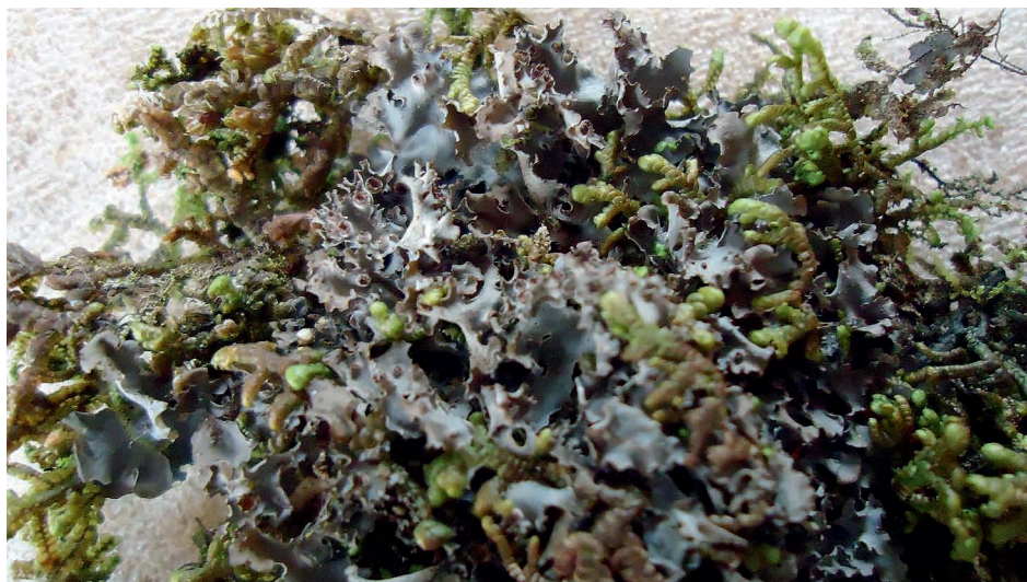
Abb. 3. Leptogium velutinum . Habitus