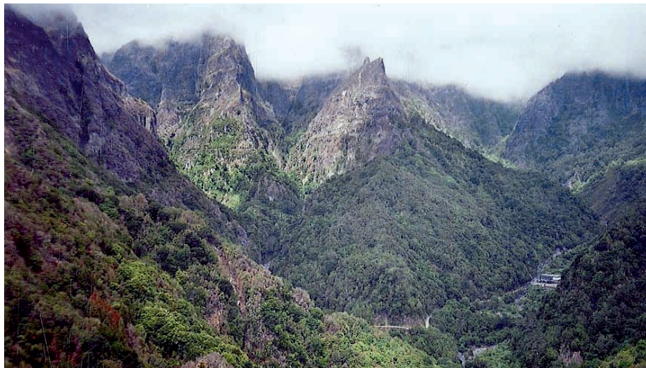
Abb. 2. Bergland mit Lorbeerwald bei Ribeiro Frio