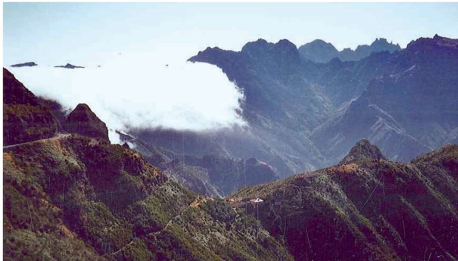
Abb. 1. Zentrales Bergland Madeiras. Eine Wolkenbank wird vom Nordostpassat über einen Gipfel gedrückt (Nähe Encumeadapass)