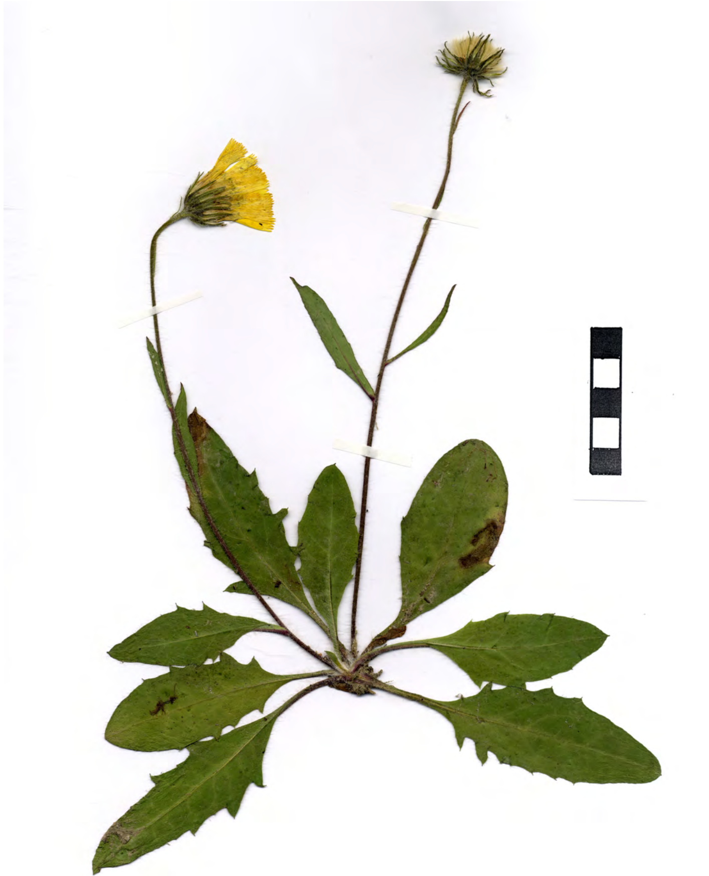
Fig. 1: Hieracium cirsiopsis GOTTSCHL. & DUNKEL, Habitus.