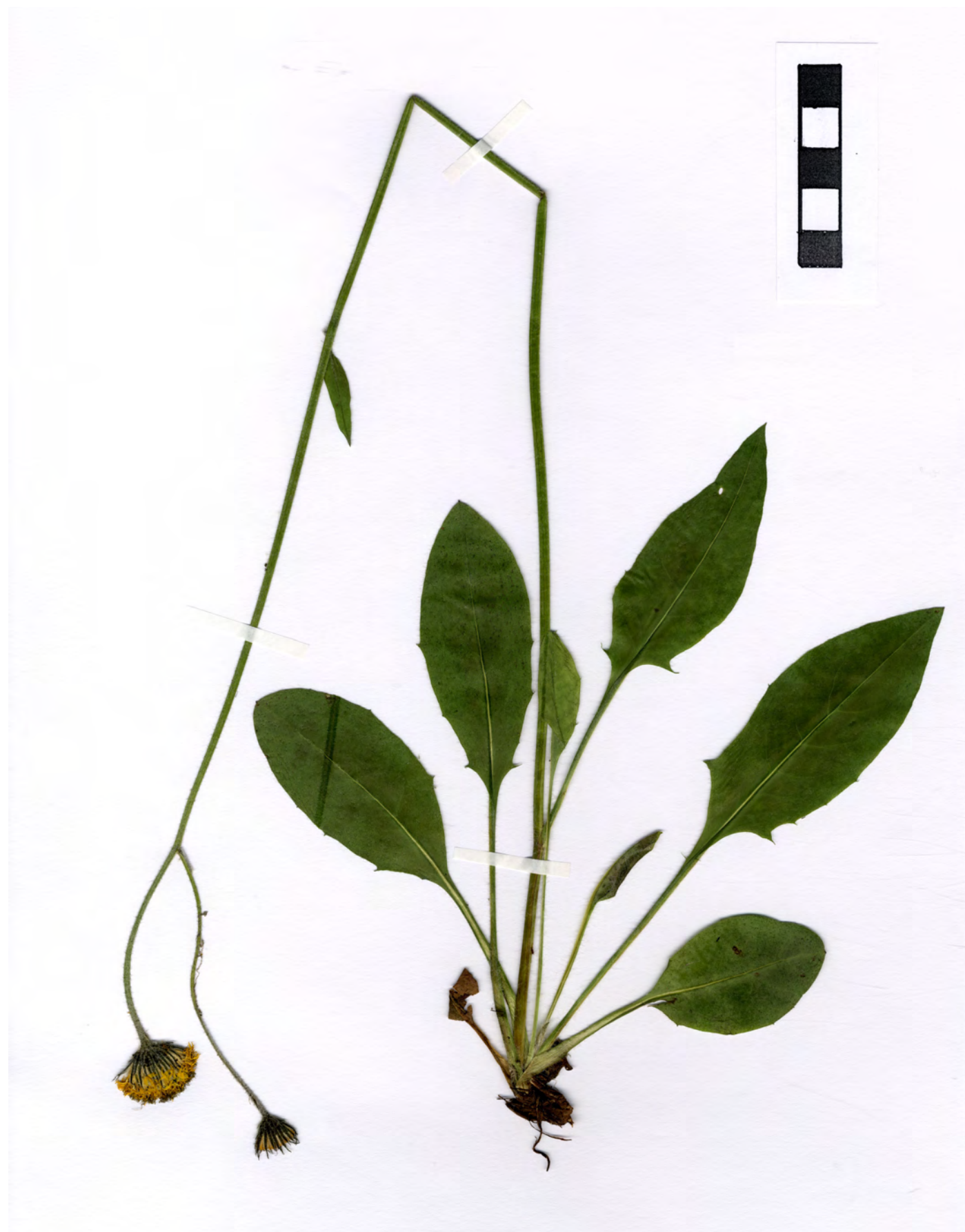
Fig. 4: Hieracium cirritum subsp. pseudocochleare GOTTSCHL., Habitus.