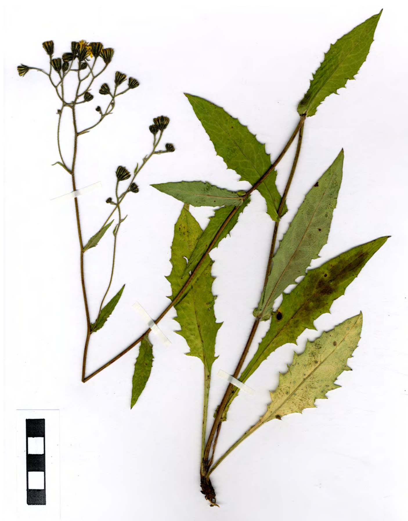
Fig. 6: Hieracium dermatophyllum subsp. acutidens GOTTSCHL., Habitus.