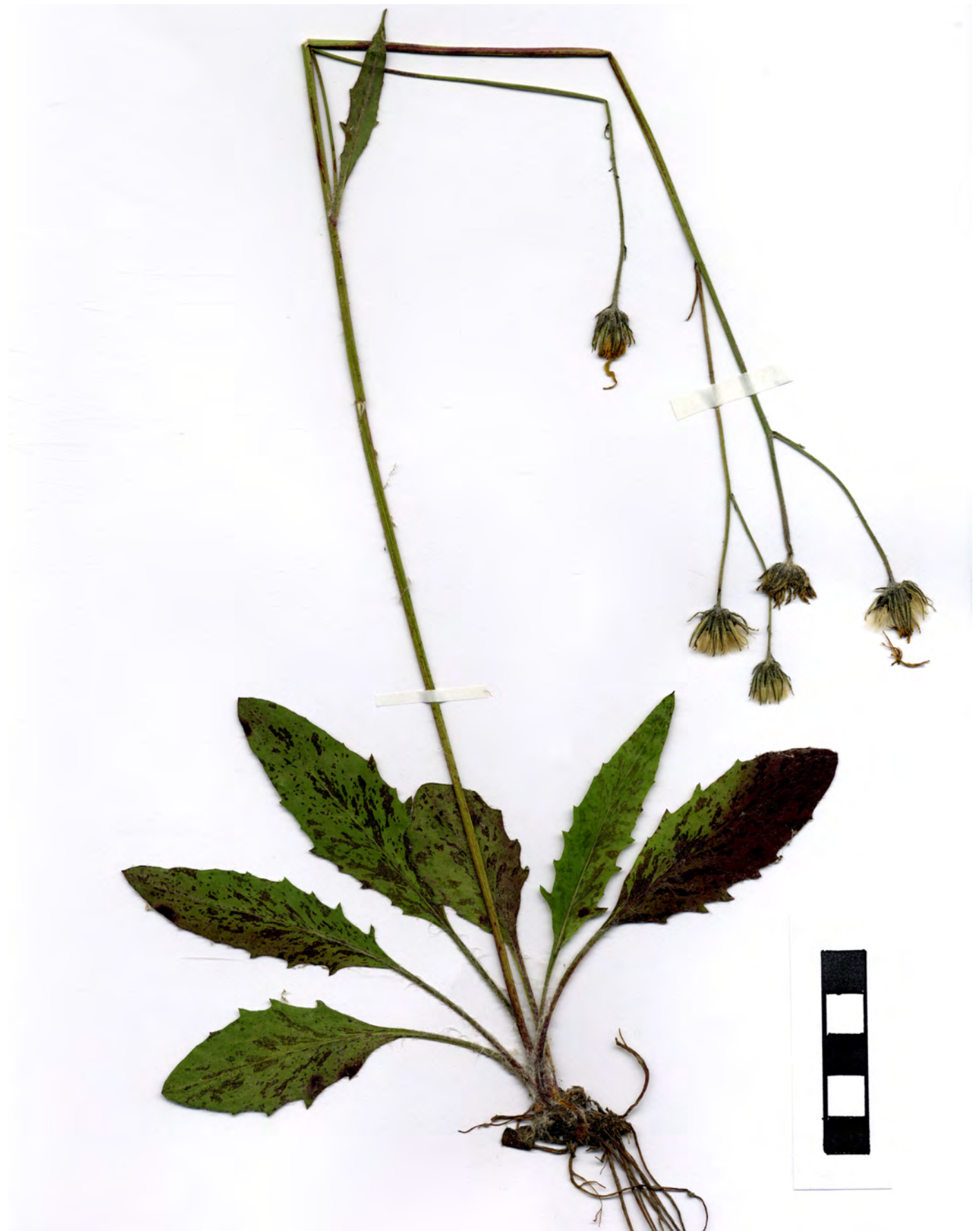
Fig. 3: Hieracium bifidum subsp. elvense GOTTSCHL. & DUNKEL, Habitus.