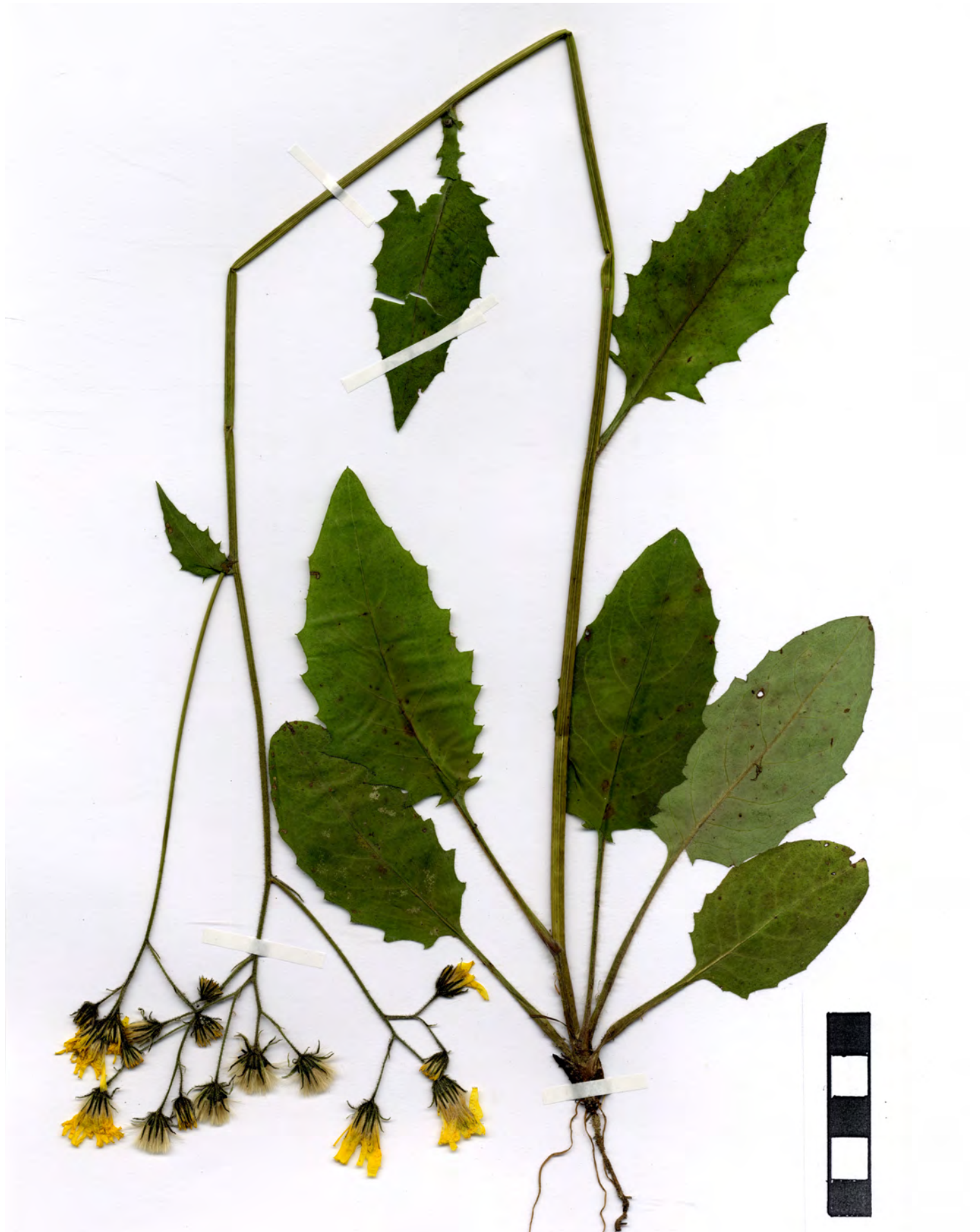
Fig. 5: Hieracium obscuratum subsp. sampeyrense GOTTSCHL., Habitus.