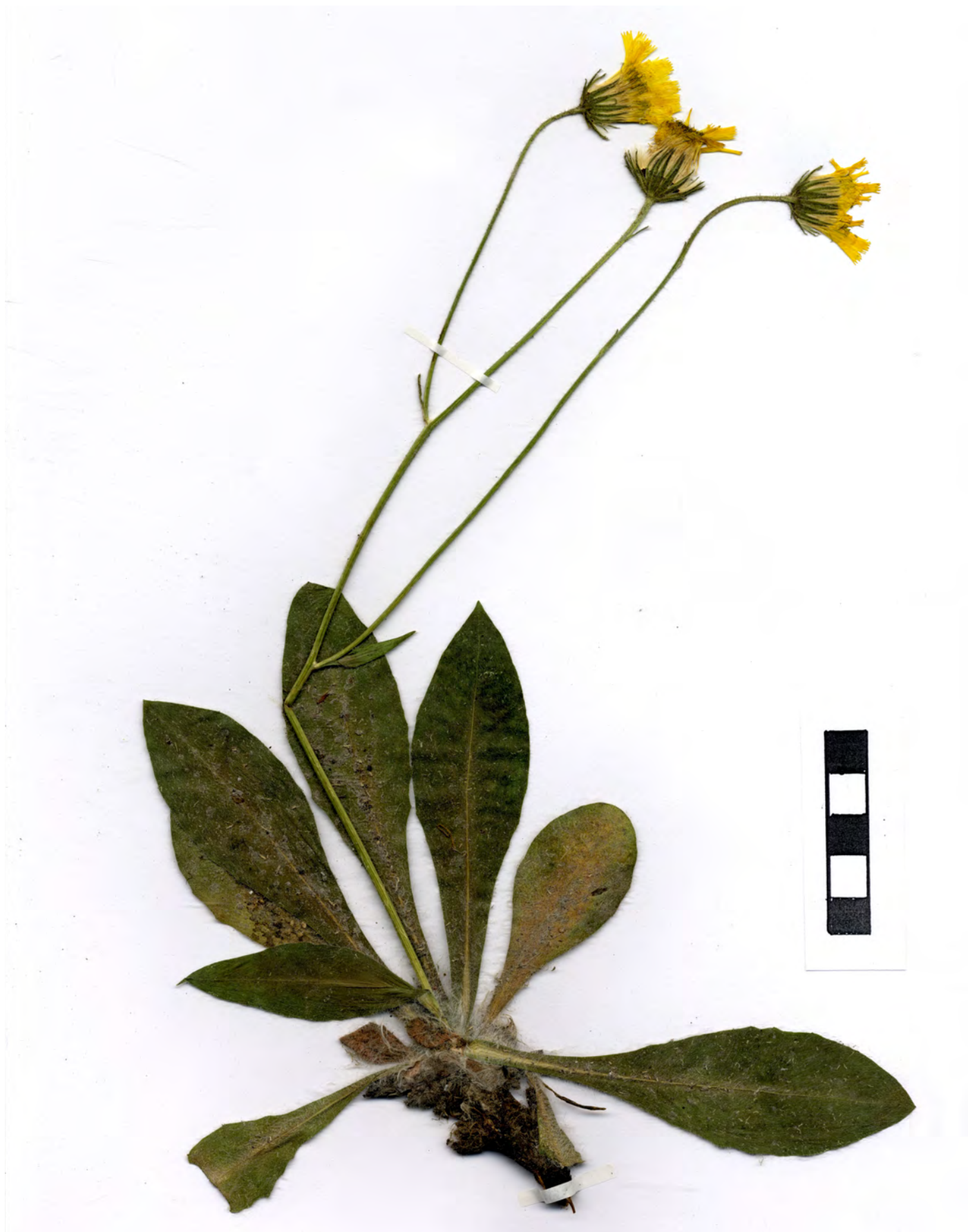
Fig. 2: Hieracium lawsonii subsp. elvae GOTTSCHL. & DUNKEL, Habitus.