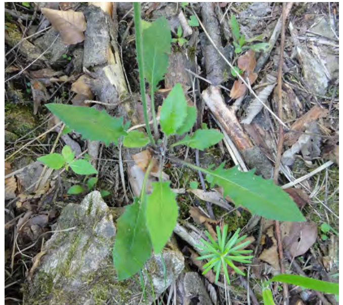
Abb. 3: Hieracium rotundatum am Standort E vom Erlauffluss in Bayern, Grundblattrosette.