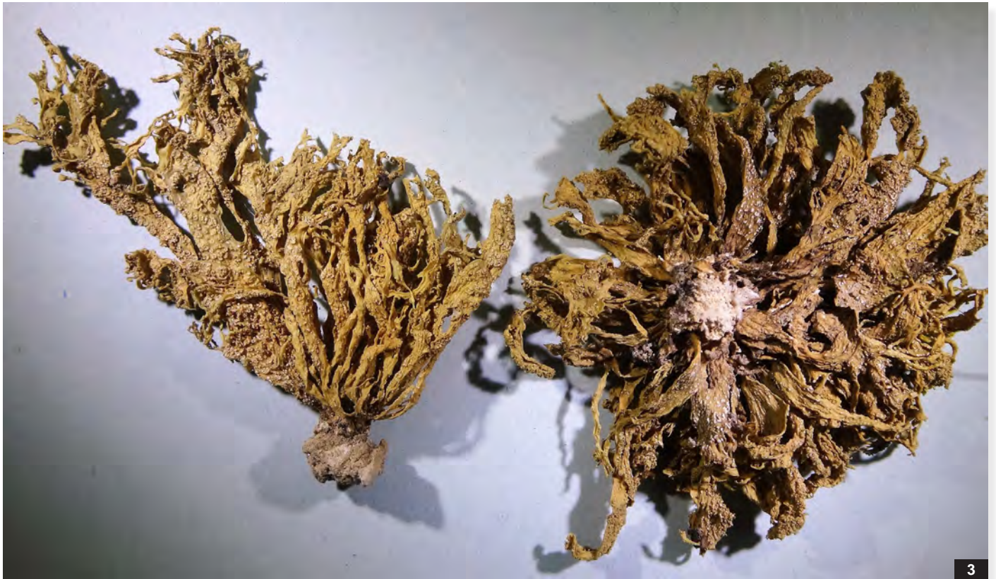
Abb. J 3: Ramalina polymorpha . Thalli 4 cm, Seitenansicht und Unterseite.