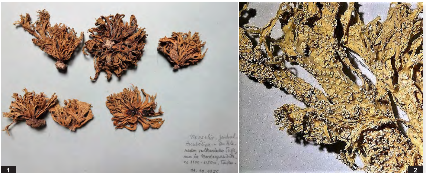
Abb. J: Ramalina polymorpha . 1 — Originaltafel mit 6 Thalli, Größe 3-4 cm; 2 — isidienähnliche Granula an laminalen Pseudocyphellen. Ausschnitt 2 cm. Fundort: Türkei.

Ein weiterer Beleg der Spezies wurde bereits im Jahre 1955 von HELMUT GUSTAV BECKER im türkischen Nevsehir (Zentral-Anatolien, c. 1070 m) gesammelt, blieb aber leider ohne Angaben zur genauen Höhe und des Substrates. Wieder besticht – wie bei allen Belegen von BECKER – die ansprechende Präparation in Form von Tafeln mit bis zu 15 Thalli, was vergleichende Untersuchungen der Oberflächen wesentlich erleichtert. Die Lager lassen isidien-ähnliche Körner an laminalen Pseudocyphellen erkennen, die über die gesamte Thallus-Oberfläche verteilt sind (WIRTH 2013). Die ähnliche R. requienii ist mit Küstenfelsen assoziiert.