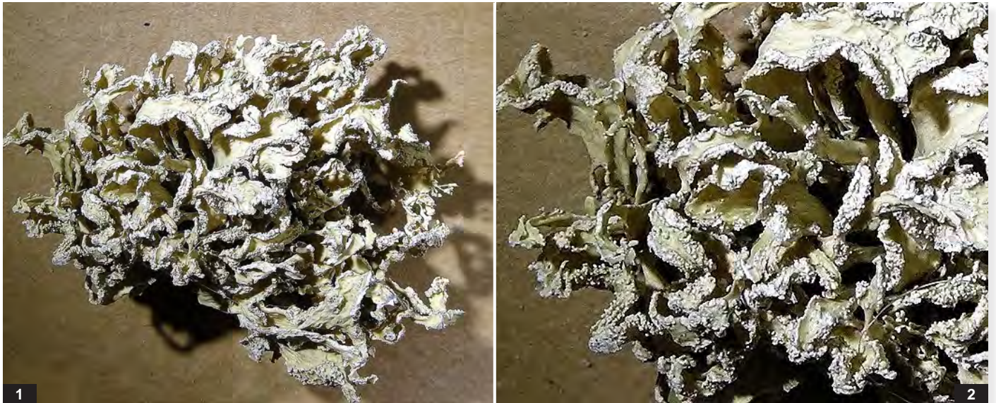
Abb. I: Ramalina polymorpha . 1 — Thallus, Durchmesser ca. 3 cm; 2 — Ränder mit Bortensoralen, Ausschnitt 2 cm. Fundort: Griechenland, Mykonos.