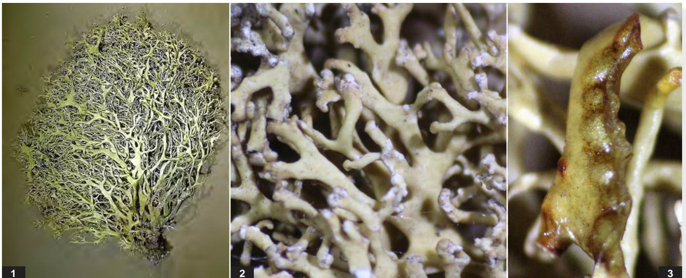
Abb. F: Ramalina hamulosa . 1 — Thallushöhe 6 cm; 2 — Ästchen mit hakenförmigen Strukturen, Ausschnitt 2 cm; 3 — Mark: K + rot-Reaktion (Salizinsäure).

Merkmale der Art, die nur saxikol vorkommt, sind vor allem die reich verzweigten, strauchigen Thalli mit kurzen Ästchen, die in knoten- oder hakenförmigen Strukturen enden (SCHUMM 2008). Die Art reagiert mit einer K + rot - Färbung des Markes. Soralen und Pyknidien fehlen, Pseudocyphellen sind selten.