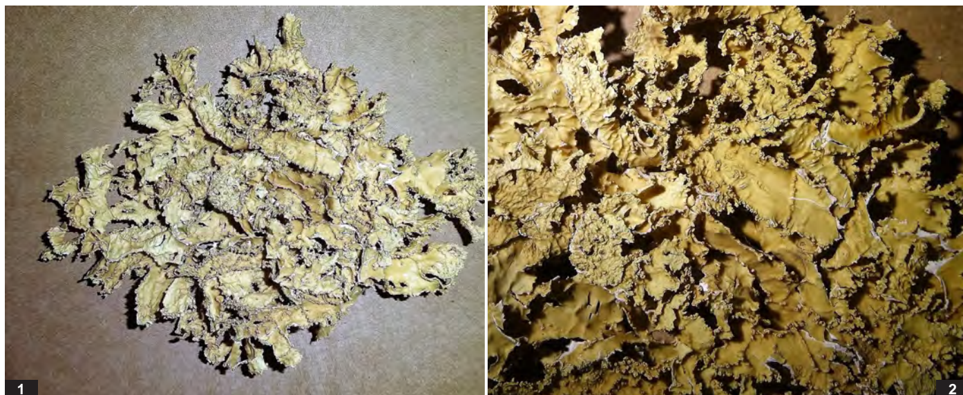
Abb. D: Ramalina crispatula . 1 — Thallus, Durchmesser 9 cm; 2 — Ausschnitt 3 cm.

Die chemischen Reaktionen des Marks sind gut erkennbar: K+ rot weist auf Salazinsäure hin, die P+ orange – Färbung ist ein Indikator für Protocetrarsäure.