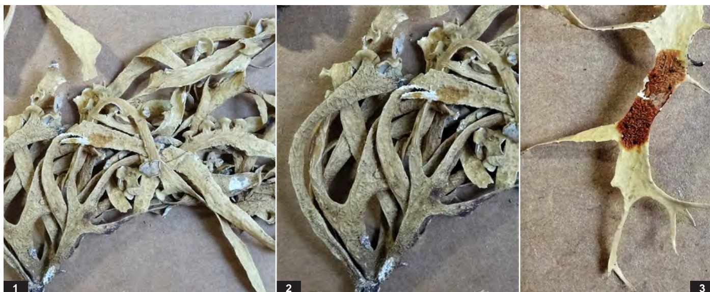
Abb. H: Ramalina subwebbiana . 1 — Thalluslappen bis 4 cm; 2 — netzgrubige Vertiefungen im Thallus, Ausschnitt ca. 4 cm; 3 — chemische Reaktion des Markes: K + rot (Salazinsäure).

Auffallend sind die flachen, bandartigen Äste der Art mit ihren netzgrubigen Strukturen und die vielen Apothecien. Die deutliche K + rot - Reaktion zeigt das Vorhandensein von Salazinsäure an.