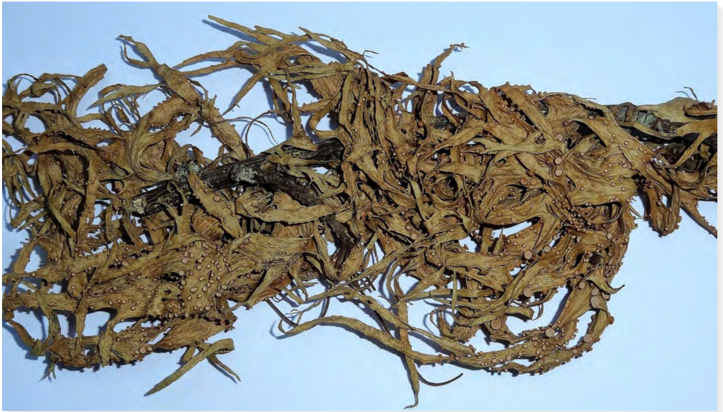
Abb. B: Ramalina celsa . — Thallus mit Apothecien, Bildbreite 14 cm.

In den Asci entstehen 2-zellige gebogene oder gerade Ascosporen, die ein wesentliches Unterscheidungsmerkmal der Arten darstellen.