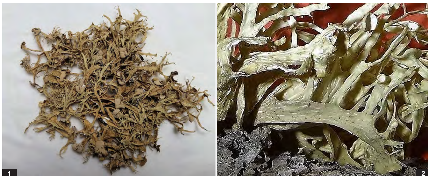
Abb. G: Ramalina huei . 1 — Thallus, Durchmesser 11 cm; 2 — basale Pseudocyphellen, Ausschnitt 3 cm.