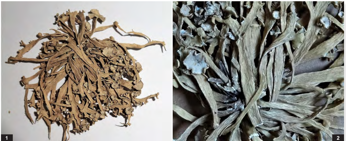
Abb. E: Ramalina decipiens . 1 — Thallus 5 cm, Apothecien bis 6 mm; 2 — basaler Thallus mit Pseudocyphellen, Ausschnitt 4 cm.

Ramalina decipiens MONT. LI 477592 (Abb. E 1-2), LI 477591, 481528, 481545