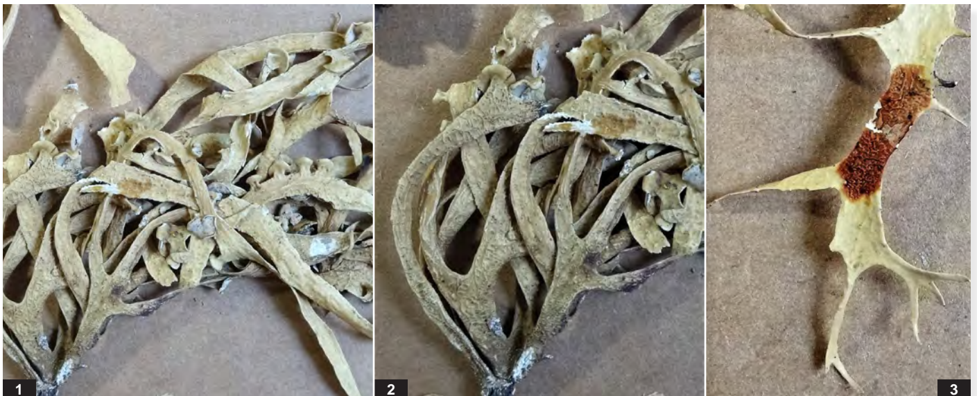
Abb. H: Ramalina subwebbiana . 1 — Thalluslappen bis 4 cm; 2 — netzgrubige Vertiefungen im Thallus, Ausschnitt ca. 4 cm; 3 — chemische Reaktion des Markes: K + rot (Salazinsäure).

Auffallend sind die flachen, bandartigen Äste der Art mit ihren netzgrubigen Strukturen und die vielen Apothecien. Die deutliche K + rot - Reaktion zeigt das Vorhandensein von Salazinsäure an.