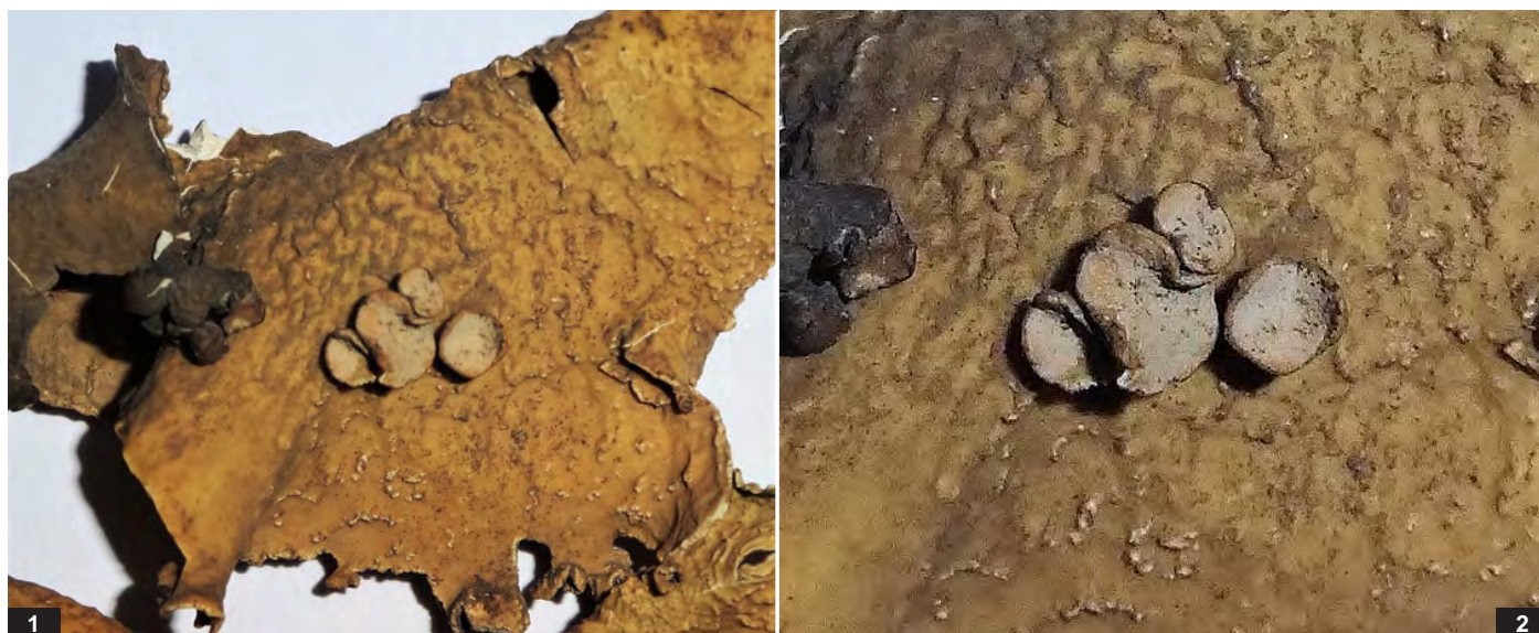
Abb. C: Ramalina bourgaeana . 1 — Thallus-Abschnitt 4 cm; 2 — Apothecien, Durchmesser 3-4 mm.

Ramalina bourgaeana MONT ex NYL., LI 481536 (Abb. C 1-2), LI 481534-41