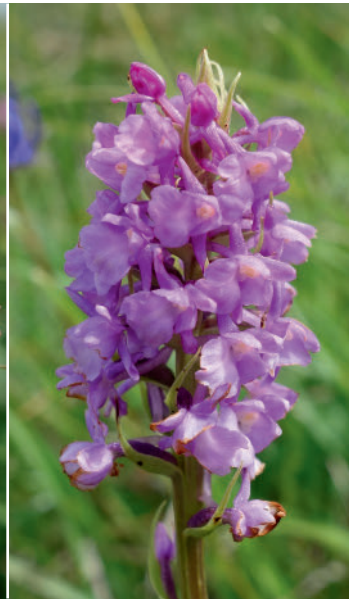
Abb. 11: Gymnadenia × intermedia , Spital am Pyhrn, Lahnerkogel, 14.07.2020, OÖ.