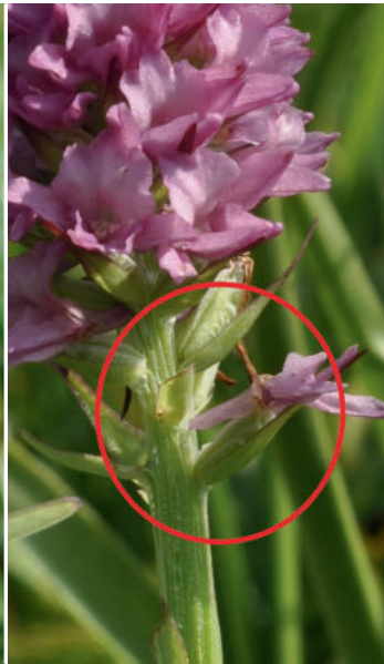
Abb. 18: Sporn von ×Gymnigritella hubertii mit einer Länge von fast 5 mm, 15.07.2010, Gailtaler Alpen, Lumkofel, Kärnten.