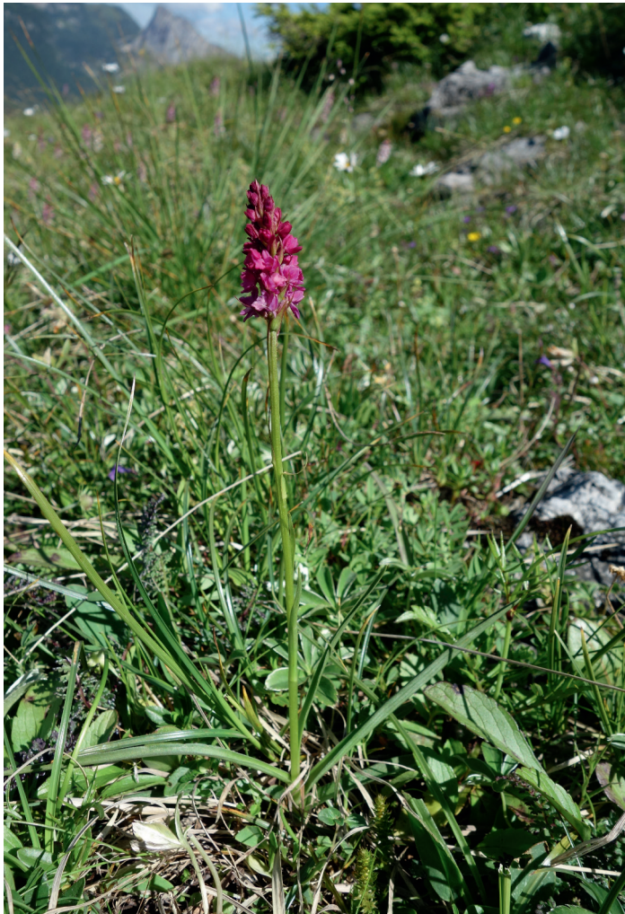
Abb. 27: ×Gymnigritella odorata , Spital am Pyhrn, Lahnerkogel, Bosruckgebiet, 01.07.2018, OÖ.