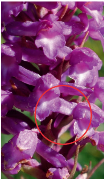
Abb. 21: Sporn von Gymnadenia odoratissima erreicht eine Länge von 5–8 mm, 01.07.2018, Spital am Pyhrn, Lahnerkogel, OÖ.