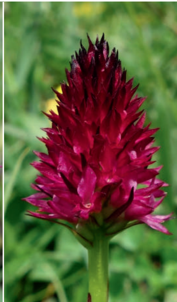
Abb. 7: Nigritella bicolor var. rubida , Ardning, Ederhütte, 03.06.2018, Stmk.