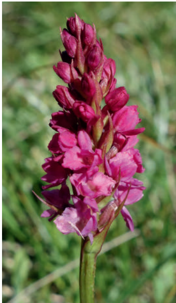
Abb. 1: ×Gymnigritella odorata , Spital am Pyhrn, Lahnerkogel, 01.07.2018, OÖ.