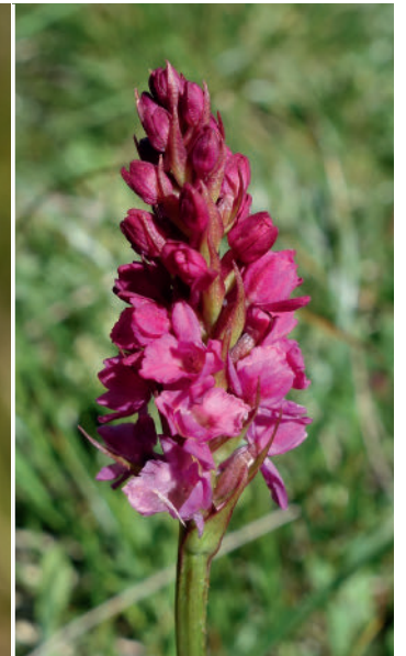
Abb. 16: ×Gymnigritella odorata , Spital am Pyhrn, Lahnerkogel, 01.07.2018, OÖ.

näheren Umgebung der neuen Hybride zu finden ist. Auch eine Beteiligung von Pseudorchis albida (Abb. 25) kann wegen der Form der Laubblätter und des Sporns ausgeschlossen werden.