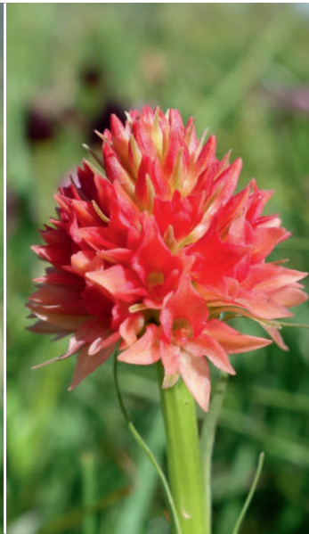
Abb. 10: Nigritella rhellicani var. subcarnea , Spital am Pyhrn, Lahnerkogel, 01.07.2018, OÖ.