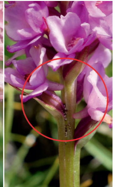
Abb. 20: Sporn von ×Gymnigritella odorata mit einer Länge von 3,0–3,5 mm, 21.07.2020, Spital am Pyhrn, Lahnerkogel, OÖ.