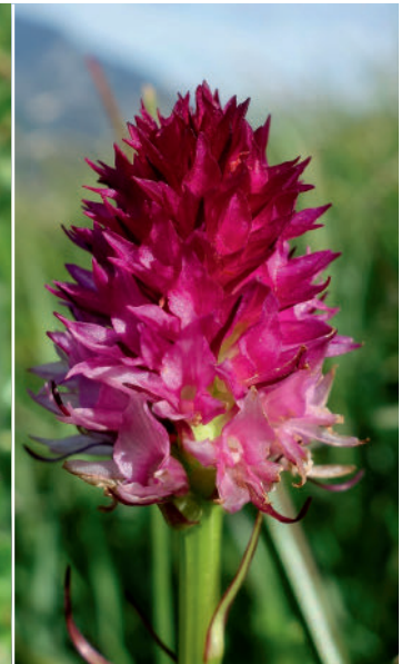
Abb. 8: Nigritella bicolor var. bicolor , Spital am Pyhrn, Lahnerkogel, 14.07.2020, OÖ.

gemeinsam mit Gymnadenia odoratissima und den vom Autor gefundenen Hybriden am selben Standort vorkommen, würde diese Kombination auch als Eltern der neu gefundenen Hybride ×Gymnigritella (im Jahr 2018 insgesamt 11 Exemplare) in Frage kommen. Die Hybride ×Gymnigritella suaveolens (Abb. 13, 17, 28) mit den Eltern Gymnadenia conopsea \times Nigritella rhellicani , würde ich wegen ihrer dunklen Blütenfarbe, den größeren, weiter geöffneten duftlosen Blüten, einem längeren Sporn (Länge 5 mm) und den wesentlich breiteren Laubblättern vorerst