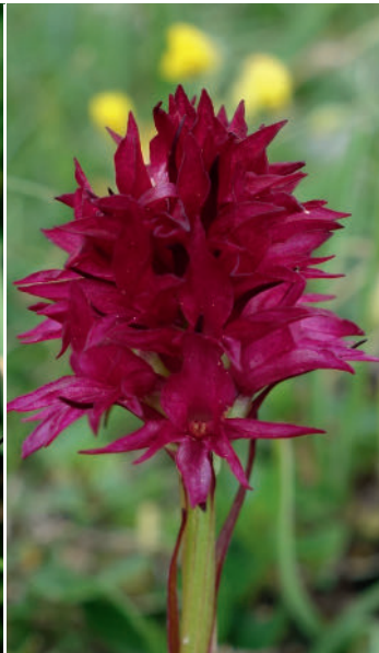
Abb. 6: Nigritella hygrophila , Hinterstoder, Bärenalm, 17.06.2018, OÖ.