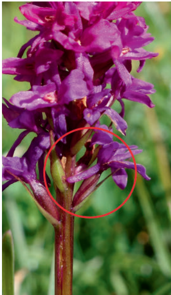
Abb. 17: Sporn von ×Gymnigritella suaveolens mit einer Länge von 5 mm, 20.07.2020, Nockberge, Heiligenbachalm, Kärnten.