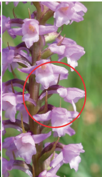
Abb. 22: Sporn von Gymnadenia odoratissima erreicht eine Länge von 5–8 mm, 01.07.2018, Spital am Pyhrn, Lahnerkogel, OÖ.