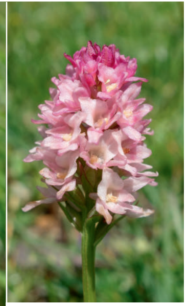
Abb. 12: ×Gymnigritella heufle-ri , Nockberge, Heiligenbachalm, 20.07.2020, Kärnten.