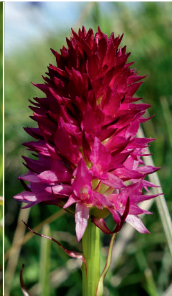
Abb. 3: Nigritella bicolor var. bicolor , Spital am Pyhrn, Lahnerkogel, 14.07.2020, OÖ.