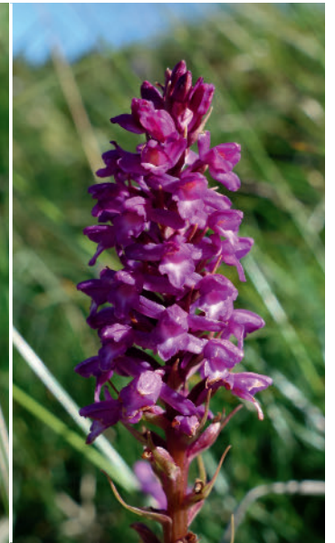
Abb. 4: Gymnadenia odoratissima , Spital am Pyhrn, Lahnerkogel, 01.07.2018, OÖ.