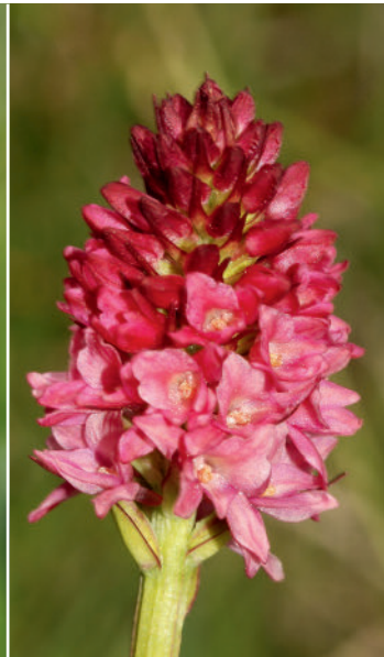
Abb. 15: ×Gymnigritella odorata, Madulain, Graubünden, 10.07.2016, Schweiz