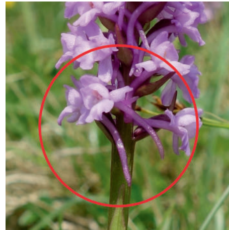
Abb. 26: Der Sporn von Gymnadenia conopsea var. alpina , ist 15,2–17 mm lang und spitz zulaufend, 03.07.2019, Spital am Pyhrn, Wurzeralm, Halssattel, OÖ.

von Nigritella bicolor Pollenpakete an den Saugrüssel angeheftet bekommen und beim Besuch einer Gymnadenia -Pflanze Pollen auf deren Narbe abgeben.