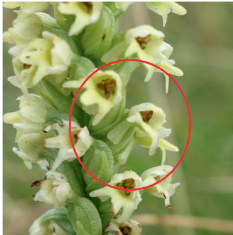
Abb. 25: Der Sporn von Pseudorchis albida ist am Ende stumpf und gegabelt, 3,8–4 mm lang, 03.07.2019, Spital am Pyhrn, Wurzeralm, Halssattel, OÖ.