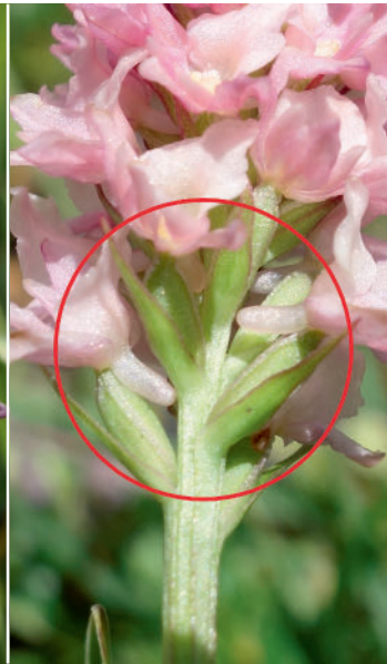
Abb. 19: Sporn von ×Gymnigritella heuffleri mit einer Länge von ca. 3,5 mm, 20.07.2020, Nockberge, Heiligenbachalm, Kärnten.