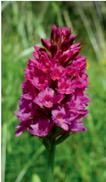
Abb. 13: ×Gymnigritella suaveo-lens , Turracherhöhe, oberhalb des Grünsees, 19.07.2020, Kärnten.