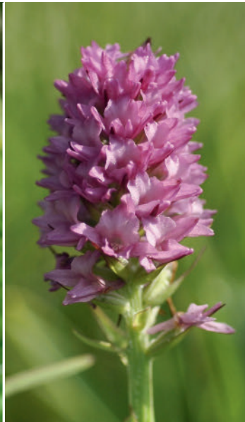
Abb. 14: ×Gymnigritella hubertii, Gailtaler Alpen, Lumkofel, 15.07.2010, Kärnten