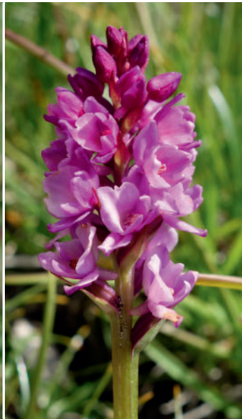
Abb. 2: ×Gymnigritella odorata , Spital am Pyhrn, Lahnerkogel, 21.07.2020, OÖ.