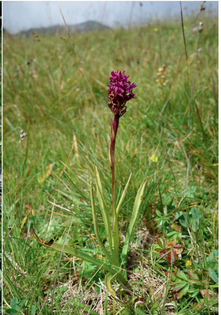
Abb. 28: ×Gymnigritella suaveolens , Hybride zwischen Nigritella rhellicani × Gymnadenia conopsea var. alpina , Spital am Pyhrn, Wurzeralm, Halssattel, 12.07.2018, OÖ.

lich, dazwischen sind Nigritella bicolor var. bicolor (Abb. 3, 8) und die seltene Variante Nigritella bicolor var. rubida (Abb. 5, 7) zu finden. Nigritella hygrophila (Abb. 6) ist nur in einigen wenigen Exemplaren vertreten und auch nicht direkt am Standort der ×Gymnigritella odorata . Pseudorchis albida (Abb. 25), Dactylorhiza sambucina (bereits verblüht) und ×Gymnigritella odorata (Abb. 1, 2, 16, 20, 27) waren zu finden. Ca. 100 m tiefer ist die Grasvegetation etwas höher (20–25 cm), dort findet man Nigritella rhellicani (Abb. 9), die sich im etwas höheren Gras offensichtlich sehr wohl fühlt. Ebenfalls wurde eine hellorange Variante von Nigritella rhellicani var. subcarnea (Abb. 10) gefunden, die auch eine Besonderheit für Oberösterreich darstellt. Weiters vorhanden war die Hybride Gymnadenia × intermedia var. alpina , deren Eltern Gymnadenia conopsea var. alpina × Gymnadenia odoratissima sind (Abb. 11). Begleitorchideen an diesem Standort sind Neotinea ustulata subsp. aestivalis , Gymnadenia densiflora mit an diesem Standort späteren Blühzeitpunkt Anfang August, Gymnadenia conopsea var. alpina (Abb. 26), Malaxis monophyllos , Coeloglossum viride , Dactylorhiza fuchsii , Traunsteinera globosa und Listera ovata .