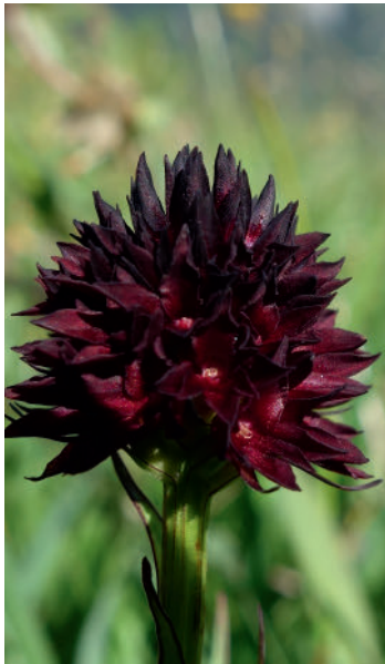
Abb. 9: Nigritella rhellicani , Spital am Pyhrn, Lahnerkogel, 01.07.2018, OÖ.