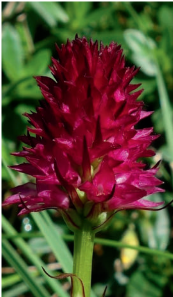
Abb. 5: Nigritella bicolor var. rubida , Ardning, Kitzstein, 01.07.2018, Grenzgebiet OÖ./Stmk.