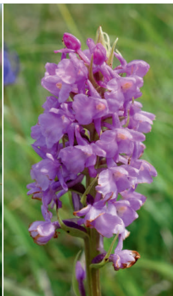
Abb. 11: Gymnadenia × intermedia , Spital am Pyhrn, Lahnerkogel, 14.07.2020, OÖ.