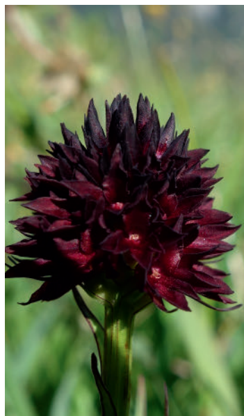
Abb. 9: Nigritella rhellicani , Spital am Pyhrn, Lahnerkogel, 01.07.2018, OÖ.