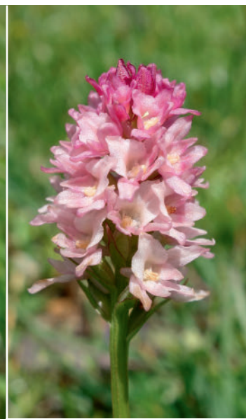
Abb. 12: × Gymnigritella heufle-ri , Nockberge, Heiligenbachalm, 20.07.2020, Kärnten.