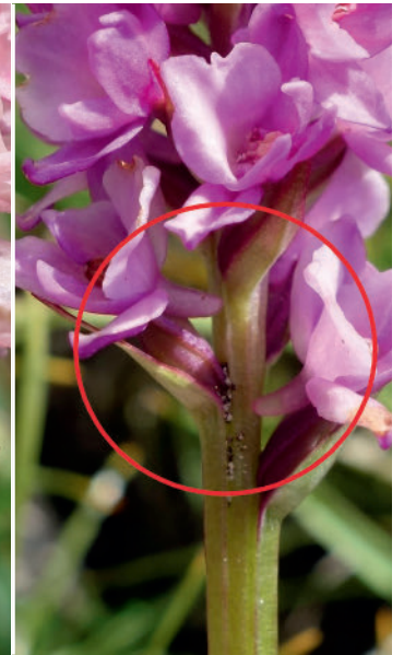
Abb. 20: Sporn von ×Gymnigritella odorata mit einer Länge von 3,0–3,5 mm, 21.07.2020, Spital am Pyhrn, Lahnerkogel, OÖ.