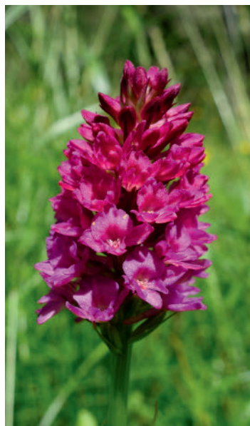
Abb. 13: × Gymnigritella suaveo-lens , Turracherhöhe, oberhalb des Grünsees, 19.07.2020, Kärnten.