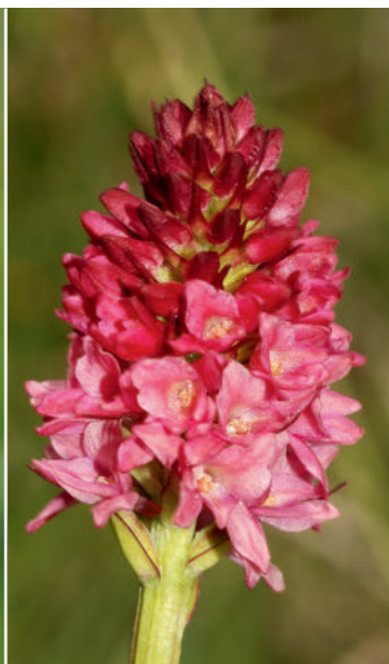
Abb. 15: × Gymnigritella odorata, Madulain, Graubünden, 10.07.2016, Schweiz