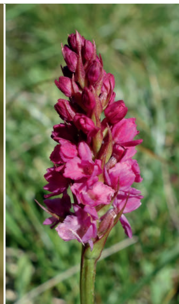
Abb. 16: × Gymnigritella odorata , Spital am Pyhrn, Lahnerkogel, 01.07.2018, OÖ.

näheren Umgebung der neuen Hybride zu finden ist. Auch eine Beteiligung von Pseudorchis albida (Abb. 25) kann wegen der Form der Laubblätter und des Sporns ausgeschlossen werden.