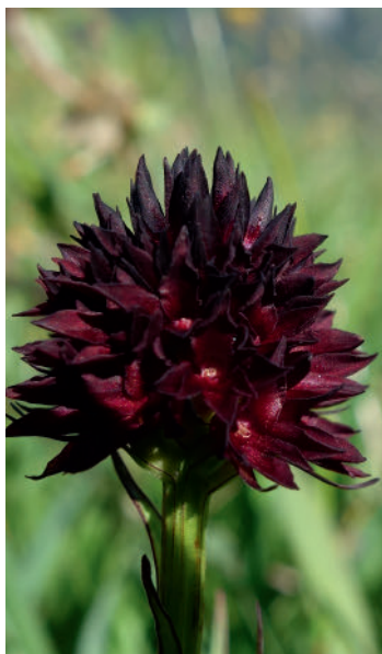
Abb. 9: Nigritella rhellicani , Spital am Pyhrn, Lahnerkogel, 01.07.2018, OÖ.