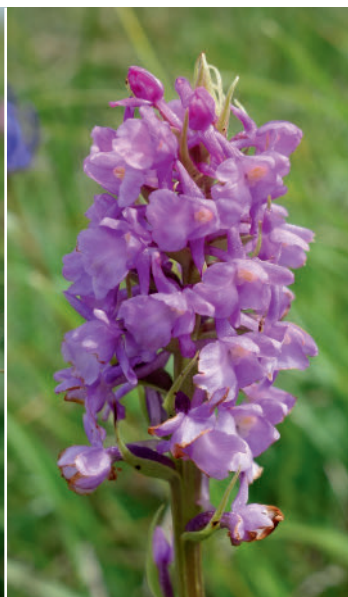
Abb. 11: Gymnadenia × intermedia , Spital am Pyhrn, Lahnerkogel, 14.07.2020, OÖ.