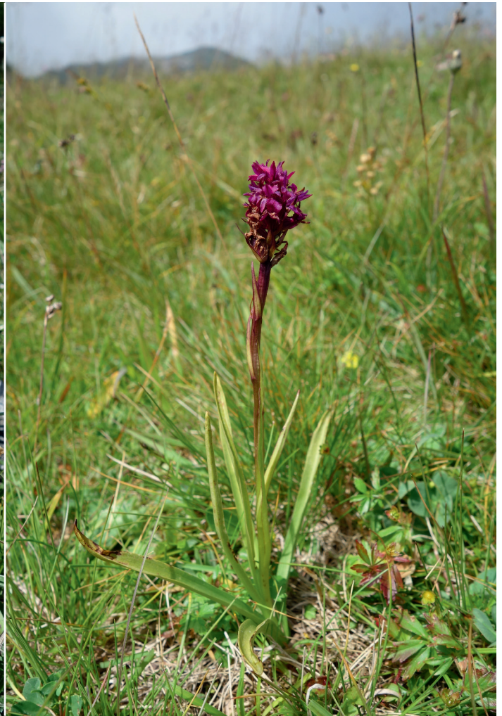
Abb. 28: ×Gymnigritella suaveolens , Hybride zwischen Nigritella rhellicani \times Gymnadenia conopsea var. alpina , Spital am Pyhrn, Wurzeralm, Halssattel, 12.07.2018, OÖ.

lich, dazwischen sind Nigritella bicolor var. bicolor (Abb. 3, 8) und die seltene Variante Nigritella bicolor var. rubida (Abb. 5, 7) zu finden. Nigritella hygrophila (Abb. 6) ist nur in einigen wenigen Exemplaren vertreten und auch nicht direkt am Standort der ×Gymnigritella odorata . Pseudorchis albida (Abb. 25), Dactylorhiza sambucina (bereits verblüht) und ×Gymnigritella odorata (Abb. 1, 2, 16, 20, 27) waren zu finden. Ca. 100 m tiefer ist die Grasvegetation etwas höher (20–25 cm), dort findet man Nigritella rhellicani (Abb. 9), die sich im etwas höheren Gras offensichtlich sehr wohl fühlt. Ebenfalls wurde eine hellorange Variante von Nigritella rhellicani var. subcarnea (Abb. 10) gefunden, die auch eine Besonderheit für Oberösterreich darstellt. Weiters vorhanden war die Hybride Gymnadenia \times intermedia var. alpina , deren Eltern Gymnadenia conopsea var. alpina \times Gymnadenia odoratissima sind (Abb. 11). Begleitorchideen an diesem Standort sind Neotinea ustulata subsp. aestivalis , Gymnadenia densiflora mit an diesem Standort späteren Blühzeitpunkt Anfang August, Gymnadenia conopsea var. alpina (Abb. 26), Malaxis monophyllos , Coeloglossum viride , Dactylorhiza fuchsii , Traunsteinera globosa und Listera ovata .