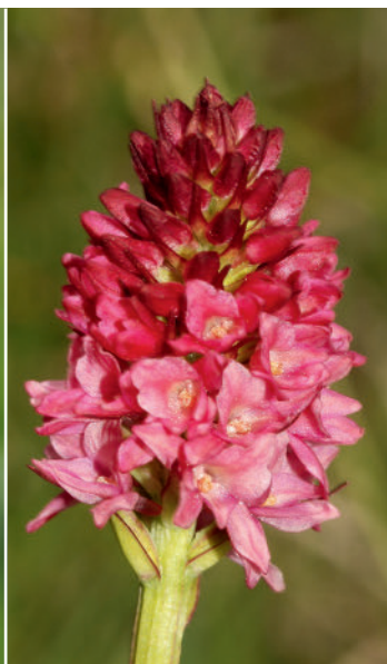
Abb. 15: ×Gymnigritella odorata, Madulain, Graubünden, 10.07.2016, Schweiz