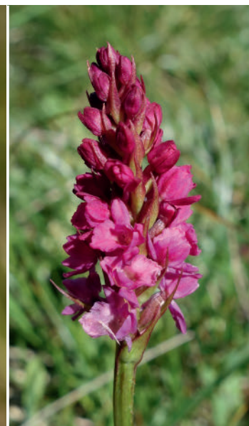
Abb. 16: ×Gymnigritella odorata , Spital am Pyhrn, Lahnerkogel, 01.07.2018, OÖ.

näheren Umgebung der neuen Hybride zu finden ist. Auch eine Beteiligung von Pseudorchis albida (Abb. 25) kann wegen der Form der Laubblätter und des Sporns ausgeschlossen werden.