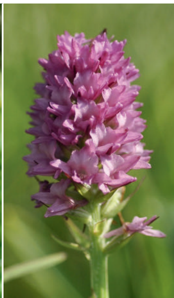
Abb. 14: ×Gymnigritella hubertii, Gailtaler Alpen, Lumkofel, 15.07.2010, Kärnten