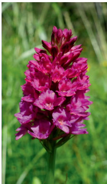
Abb. 13: ×Gymnigritella suaveo-lens , Turracherhöhe, oberhalb des Grünsees, 19.07.2020, Kärnten.