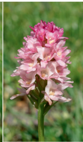
Abb. 12: ×Gymnigritella heufle-ri , Nockberge, Heiligenbachalm, 20.07.2020, Kärnten.