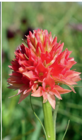
Abb. 10: Nigritella rhellicani var. subcarnea , Spital am Pyhrn, Lahnerkogel, 01.07.2018, OÖ.