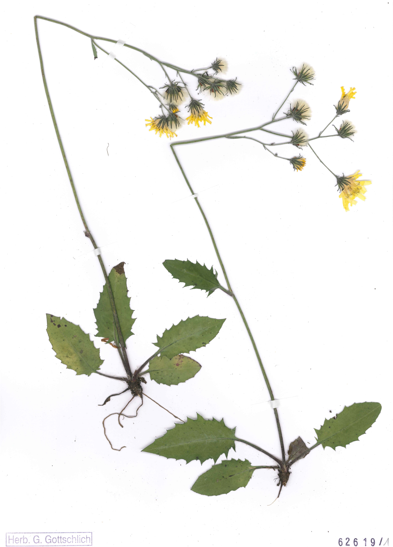
Fig. 9: Hieracium picenorum subsp. falsobifidum (Habitus).