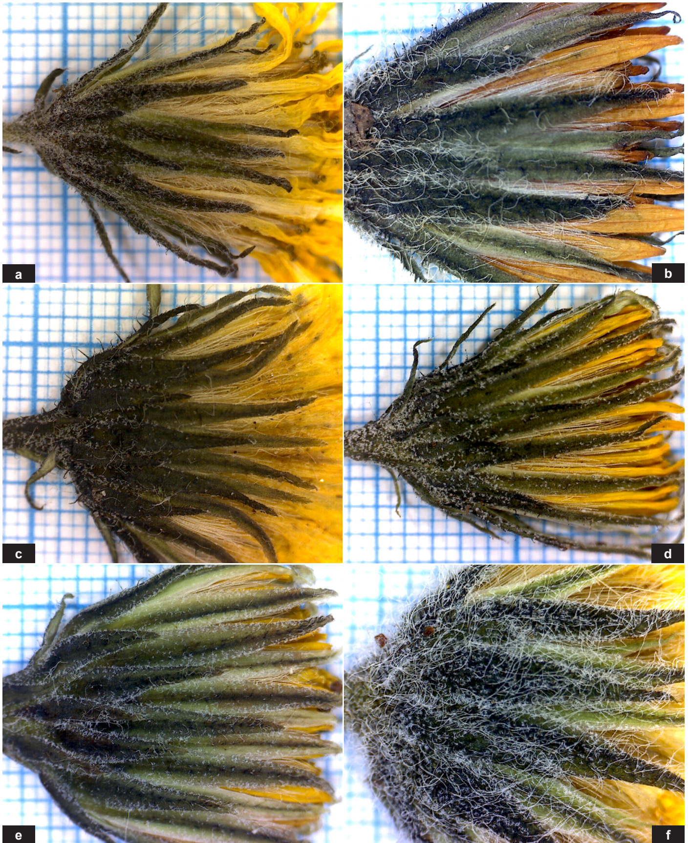
Fig. 17: Tracht der Körbe – a: H. picenorum subsp. falsobifidum , b: H. montis-florum subsp. soldanoi , c: H. orodoxum subsp. pseudonaegelianum , d: H. glaucum subsp. serenaiae , e: H. bupleuroides subsp. tririvicola , f: H. chloropsis subsp. apuianorum .