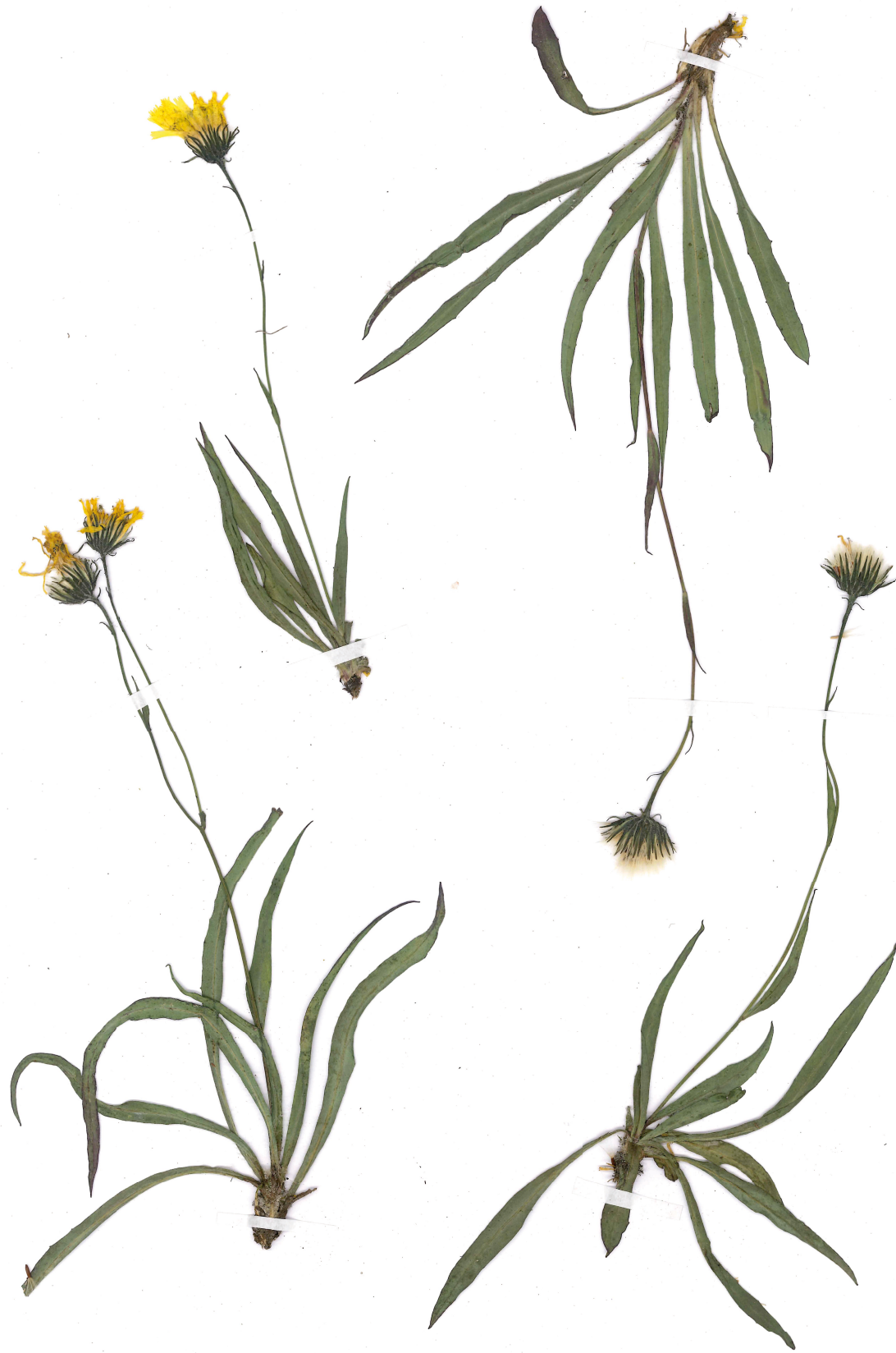
Fig. 11: Hieracium orodoxum subsp. pseudonaegelianum (Habitus).