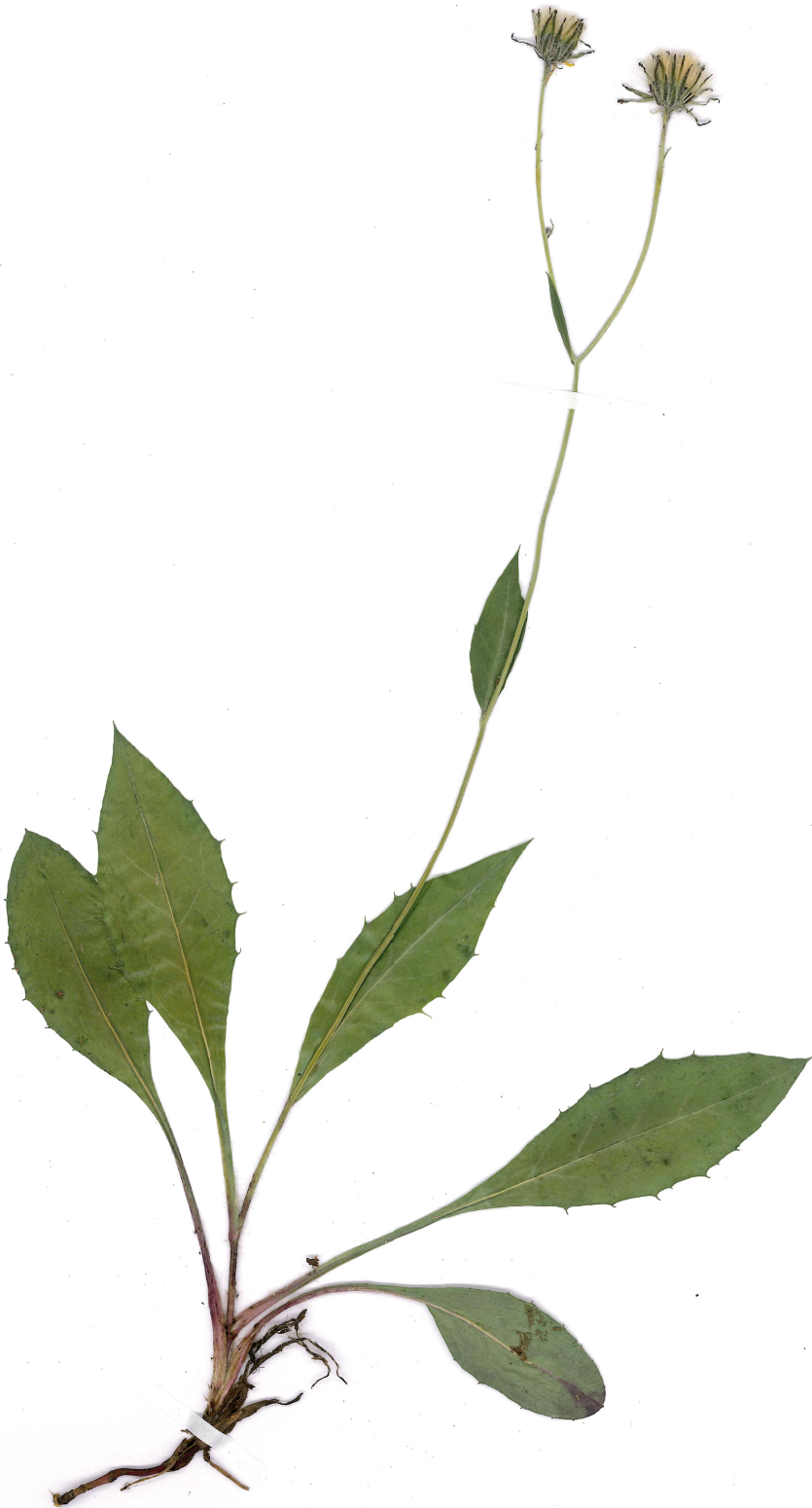
Fig. 5: Hieracium sparsivestitum (Habitus).