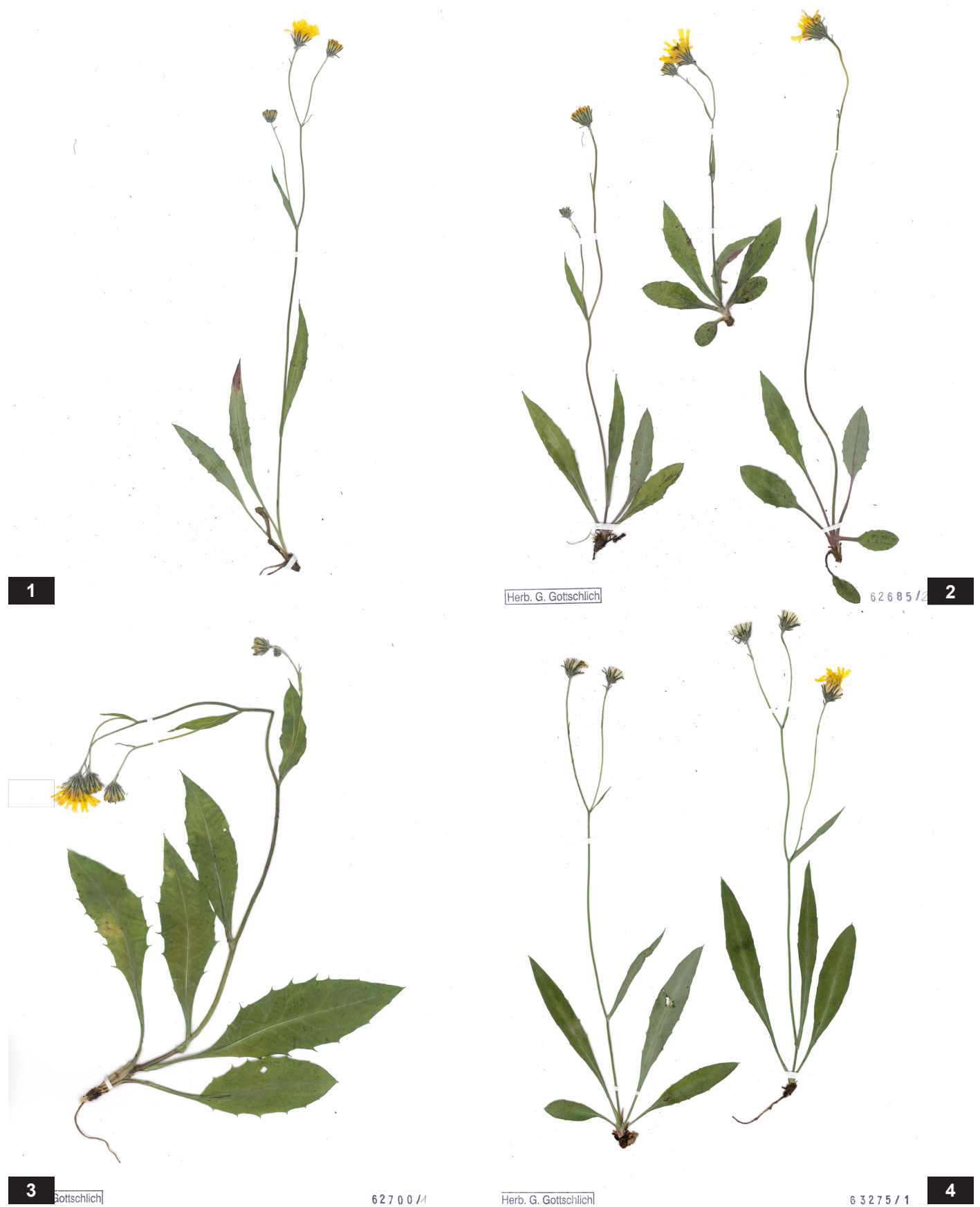
Fig. 2: Morphologische Variabilität von Hieracium juengeri .