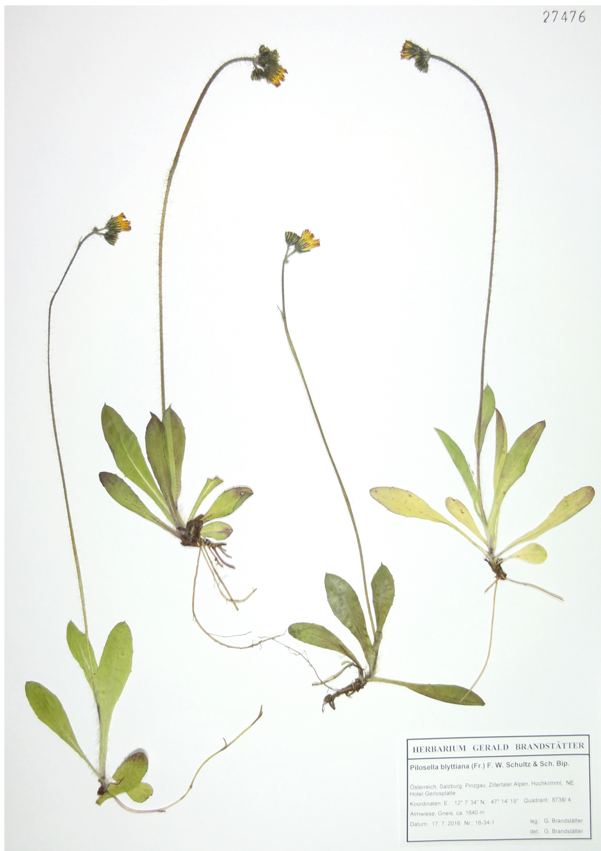
Abb. 4: Pilosella blyttiana , Habitus, Herbarium G. Brandstätter.