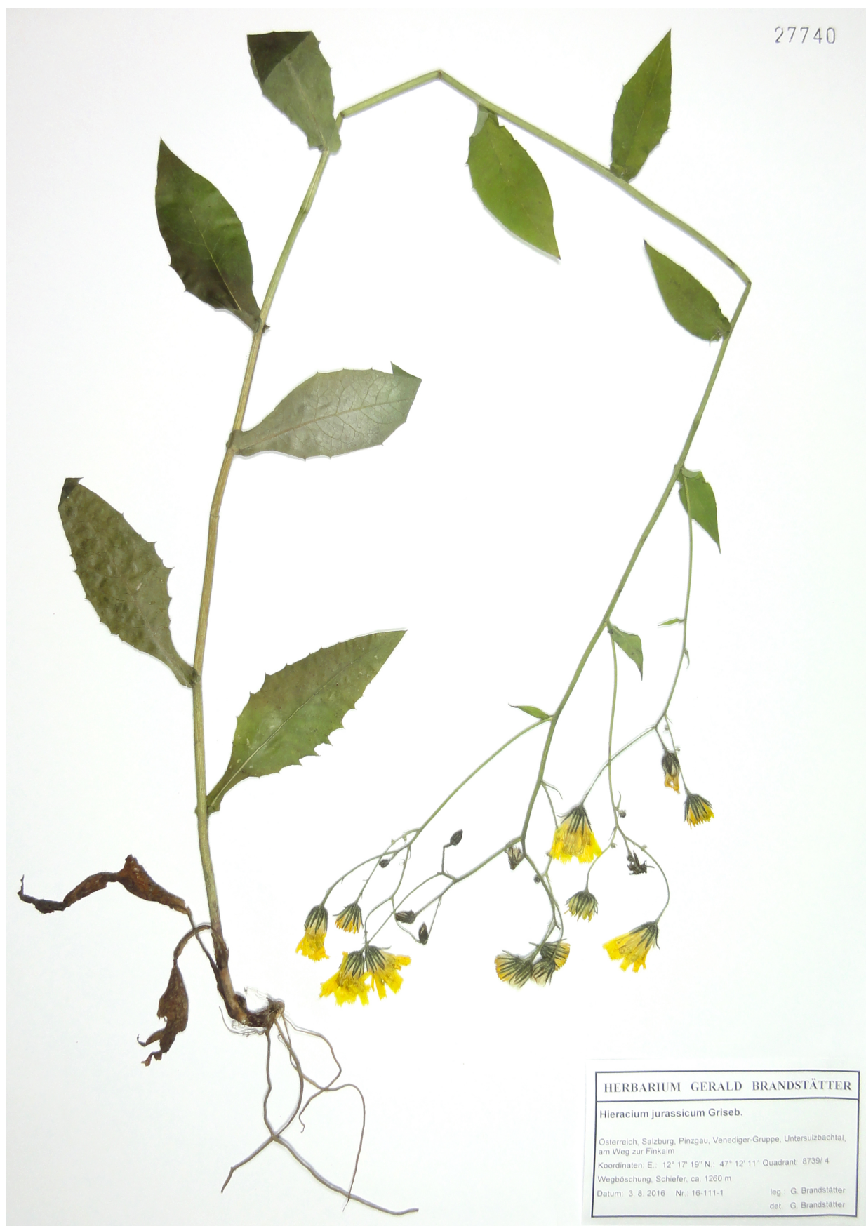
Abb. 2: Hieracium jurassicum , Habitus, Herbarium G. Brandstätter.