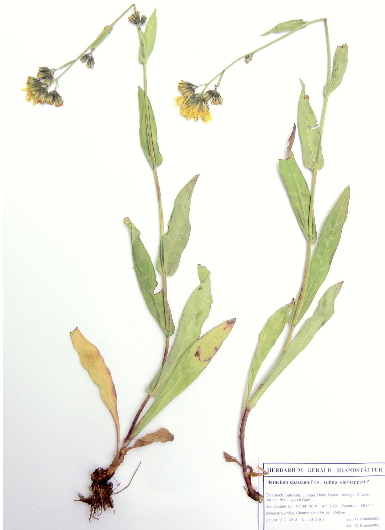
Abb. 3: Hieracium sparsum subsp. vierhapperi vom Kareck, Herbarium G. Brandstätter.