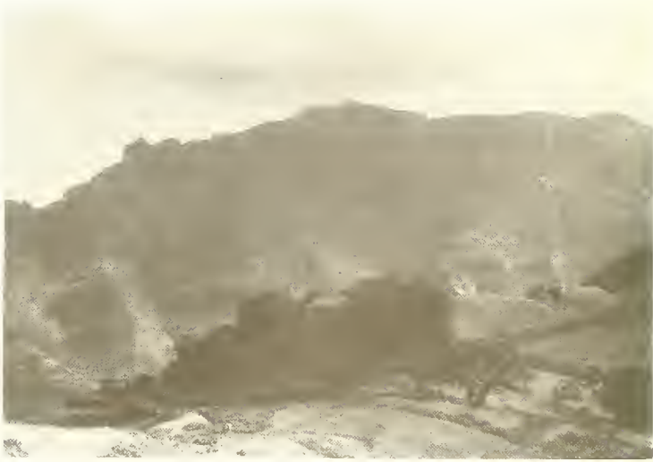
Abb. 18. Kirchenhain von Sabra Mariam (3400 m) aus Hagelia abyssinica ; hinten die Nordwände des Wäynobar (4472 m).