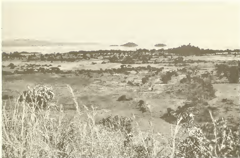
Abb. 1. Landschaft am Südufer des Tana-See westlich Bahar Dar; Blick vom Kotita Hill nach Norden; hinten von links nach rechts Halbinsel Zegie, Insel Kevran, Insel Entons, Kirchenhügel von Sesela Abo; links vorne ein gehölzfreies, sumpfiges Grasland.