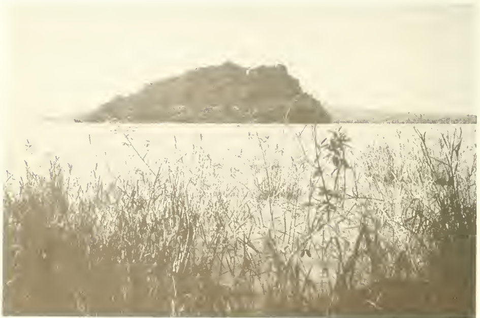
Abb. 6. Blick von der Insel Entons zur Insel Kevran; beide sind mit dichtem Mimusops kummel - Milletia ferruginea - Albizia schimperiana -Wald bedeckt; vorne Ufervegetation aus Pennisetum giganteum , Sesbania sesban , Kanahia laniflora .

Auf der „Carta geobotanica“ von R. PICHI-SERMOLLI (1957) ist die Umrandung des Tana-Sees mit „savanna (vari tipi)“ eingetragen. Die umliegenden, höher gelegenen Plateaus tragen „savanna montana“. Die Gehölze, die für die Savanne am Tana-See in den Erläuterungen zu dieser Karte aufgezählt werden, stimmen mit meinen Listen der Buschwälder gut überein.