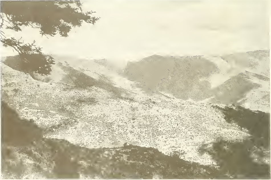
Abb. 22. Hangsavannen im Bälägäs-Tal beim Aufstieg von Schoada (2150 m) nach Baritta (3030 m); links oben Zweige von Acacia abyssinica ; ganz im Hintergrund ist auf der rechten Bildhälfte der Höhenrücken bei dem Dorf Geechie mit dem Emiet Gogo (3933 m) zu sehen, hinter dem die Steilhänge und Felswände zum nördlichen Vorland Semyens abfallen; in der Mitte ist am Horizont die Gegend des Sankaber-Passes zu suchen.

africana , Rumex nervosus , Nepeta ballotifolia u. a.) bestanden. Bei 3150 m Höhe begann ein etwas flacher geneigter Hang, der teilweise von abgeernteten Gerstenfeldern bedeckt war. Bei 3300 m sah ich wieder die ersten Büsche von Hypericum lanceolatum und Erica arborea . Andererseits fand ich noch bei 3500 m die letzten, kümmerlichen Bäume von Juniperus procera . Knapp vor der in 3860 m Höhe liegenden Hochflächenkante begann das Festuca abyssinica -Grasland mit zahlreichen Riesenlobelien. Auf dem flach nach Westen zum Doräna Wåns einfallenden Hang schlossen die Lobelien stellenweise zu richtigen Hainen zusammen. Auch größere Flächen mit Erica arborea -Gebüsch waren vorhanden. Auf dem jenseitigen, westlichen Hang dieses nicht besonders stark eingetieften Tales lagen die Ackerfluren des Dorfes Sakba, wo wir für eine Nacht lagerten.