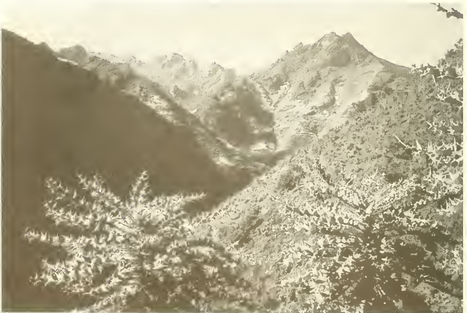
Abb. 19. Blick aus dem Tällak-Tal zum Walya Käänd (4256 m) links und zur Amba Dawit (3852 m) rechts; die hellen Partien an den Hängen der Amba Dawit sind Gerstenfelder; vorne eine montane Hangsavanne mit Erica arborea und Echinops (im Vordergrund).

thunbergianum ; letzteres erinnerte sehr an unser einheimisches G. rotundifolium . Die Talhänge waren locker mit Sträuchern bewachsen. An allen einigermaßen geeigneten Stellen waren immer wieder kleine Gerstenfelder eingestreut. Auf einem steilen Südwesthang in 3100 m Höhe nahm ich eine hochmontane Hangsavanne auf (Liste 12):