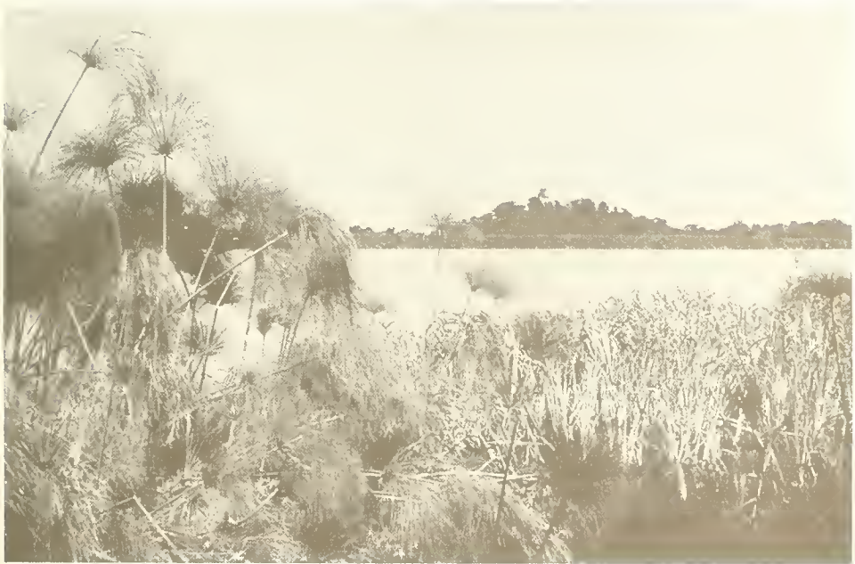
Abb. 4. Blick von der Halbinsel Shimbet Michael zum Kirchenhügel von Sesela Abo; links vorne Cyperus papyrus , ebenso am jenseitigen Ufer der Bucht vor dem Hügel.

Die Ufervegetation des Tana-Sees wird besonders in den Buchten von einem Gürtel von Cyperus papyrus gebildet (Abb. 4). Sein Boden ist gewöhnlich schlammig und auch in der Trockenzeit noch feucht oder überschwemmt. In Lücken des Papyrus -Sumpfes wachsen einige hohe Gräser ( Pennisetum giganteum , Echinochloa stagnina ), Commelina nudiflora , Alternanthera sessilis und andere Cyperus -Arten.