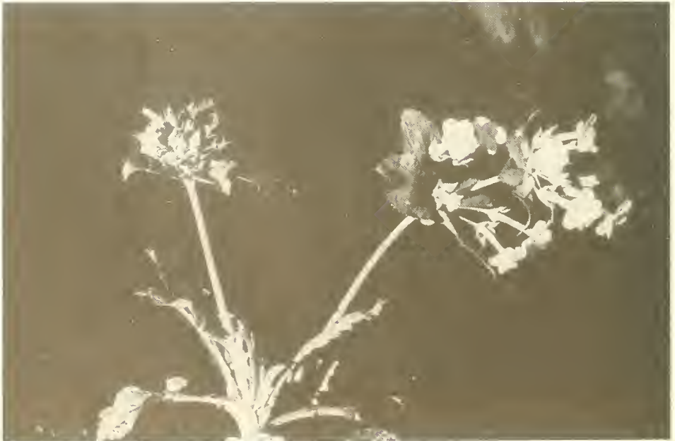
Abb. 20. Primula verticillata ssp. semiensis in der Bachklamm bei dem Dorf Madsche (3500 m).

Am 17. November traten wir wieder den Rückweg von Sabra über den Mätälal-Paß ins May-Schaha-Tal an. Auf der östlichen Talflanke ging es jetzt in südlicher Richtung abwärts. Bei dem Dorf Madsche machten wir für eine Nacht Zwischenstation (38°20'36"E, 13°15'17"N, 3500 m NN). Dieses Dorf liegt unmittelbar am