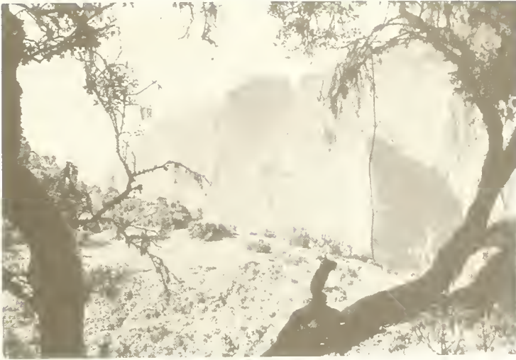
Abb. 11. Die tiefe Felsenschlucht des Marons-Baches bei dem Dorf Geechie; vorne Erica arborea mit Bartflechten ( Usnea ) behangen. Dieses Bild schließt ungefähr an das vorige nach rechts an.