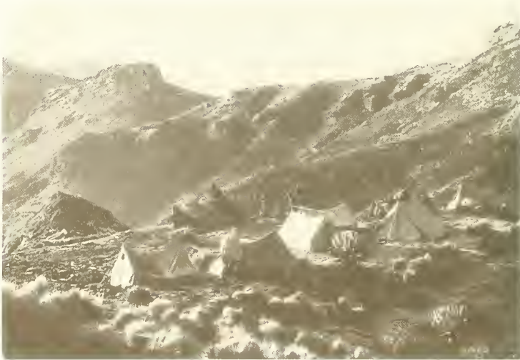
Abb. 17. Blick von Tiguna (3650 m) zum Mätälal-Paß; im Hintergrund links schaut noch der Ras Dedschän hervor; an den Hängen hinter dem Lager frisch umgepflügte Felder, die bis 3700 m hinaufreichen.

Der Madsche Wåns war neben dem Lager klammartig in die Basaltfelsen eingeschnitten. In den Felsspalten wurzelte in großer Zahl gelbblühende hauswurzähnliche Aeonium leucoblepharum . Später fand ich diese Art noch häufig an den Felsen bis in 4000 m Höhe. In ihrer Verbreitung ist sie auf Äthiopien und Südarabien beschränkt. Ihre nächsten Verwandten bewohnen das Mittelmeergebiet und die Kanaren. Im Bett des Baches wuchs die einzige Weidenart Äthiopiens, die Salix subserrata . Sie trug im November reife Fruchtkätzchen.