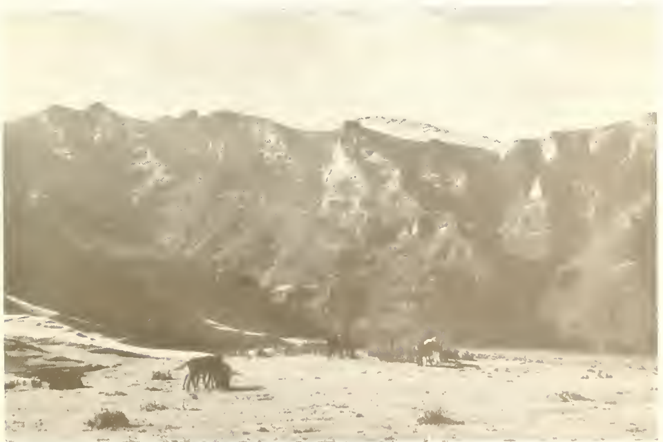
Abb. 16. Blick von der Kirche bei Lori (3400 m) auf die Nordhänge des Buahit (4437 m); oben in der Bildmitte ist das flache Hochtal zu sehen, über das der Karawanenweg führt; in den Nordhängen große Bestände von Erica arborea .

Von Lori aus besuchten wir eine der Schluchten am Nordabfall des Buahit (Abb. 16). Überraschend war für mich in der Schlucht Pflanzen zu finden, die mir aus der Heimat schon bekannt waren. Allerdings waren es nicht dieselben Arten, doch nah verwandte. Unsere Waldgräser Festuca gigantea , Bromus ramosus und Brachy-