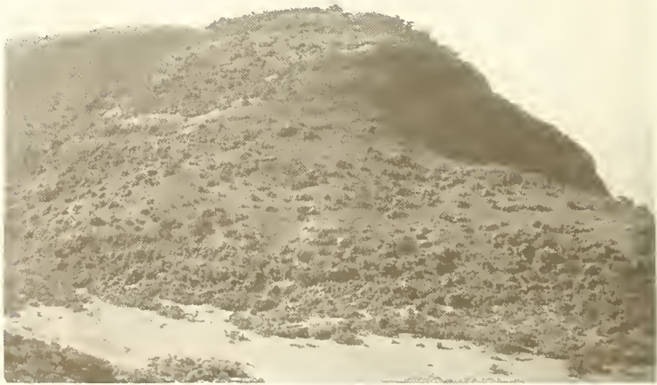
Abb. 10. Geköpfter Oberlauf eines Seitentales des Bälägäs; der Talhang ist mit Gebirgssavanne und Büschen von Erica arborea und Hypericum lanceolatum bedeckt, die Talsohle ist versumpft; rechts hinten der Steilabfall nach Norden.

Wieder auf der Hochfläche angelangt, ging es noch mehrere Stunden lang über fast baumlose Ackerfluren, bis wir bei einbrechender Nacht in einer grasigen Mulde bei dem Dorf A u t a g e v (3450 m; etwa 38^{\circ}7'E , 13^{\circ}13'N ) unsere Zelte aufschlugen. Hier war die Holzknappheit so groß, daß es nur mit einiger Mühe gelang, den Leuten etwas Holz abzukaufn. Am Morgen des 9. XI. stiegen wir oberhalb des benachbarten Dorfes Amba Ras am flach geneigten Südhang des gleichnamigen Berges (4077 m)