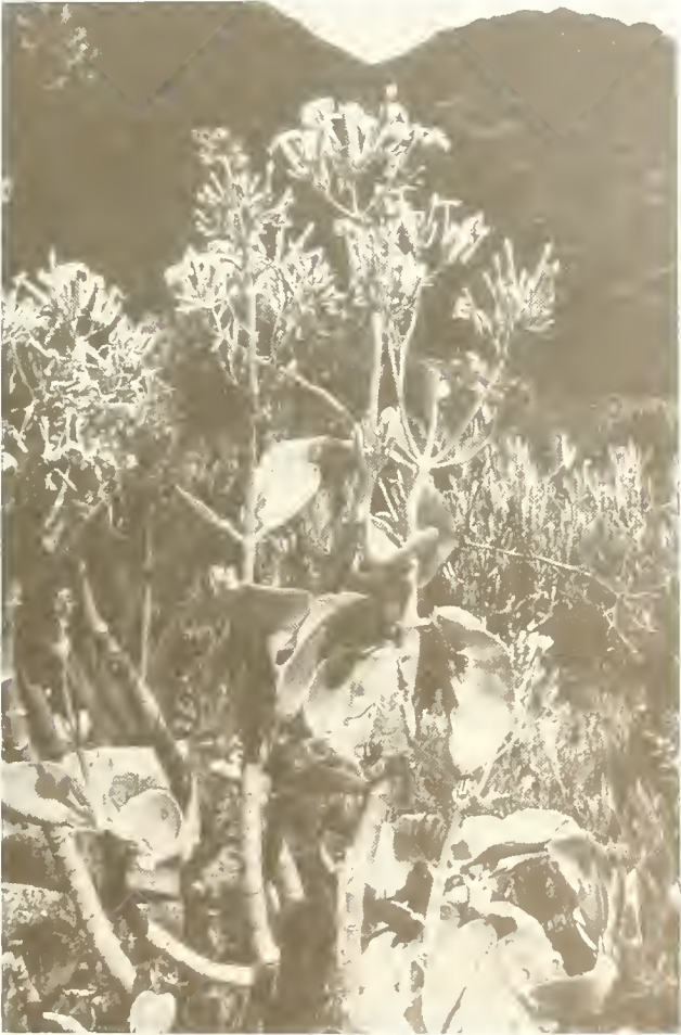
Abb. 21. Kalanchoe quartiniana , eine häufige Pflanze im trockenen May-Schaha-Tal; links dahinter ist noch der verbreitete Rumex nervosus zu sehen.

Die Flanken des May-Schaha-Tales sind in ihren untersten und obersten Partien sehr steil, in den mittleren aber nur mäßig geneigt und vorwiegend von Gerstenfeldern bedeckt. Auf dem Ackerbau ungünstigen Standorten wuchs nur eine lockere, manchmal schon fast an eine Halbwüste erinnernde Vegetation. Von 3400 m an abwärts tauchten die ersten Aloen auf. Auch Mesembryanthemum abyssinicum und Kalanchoe quartiniana , zwei ebenfalls sukkulente Arten, waren ziemlich häufig (Abb. 21).