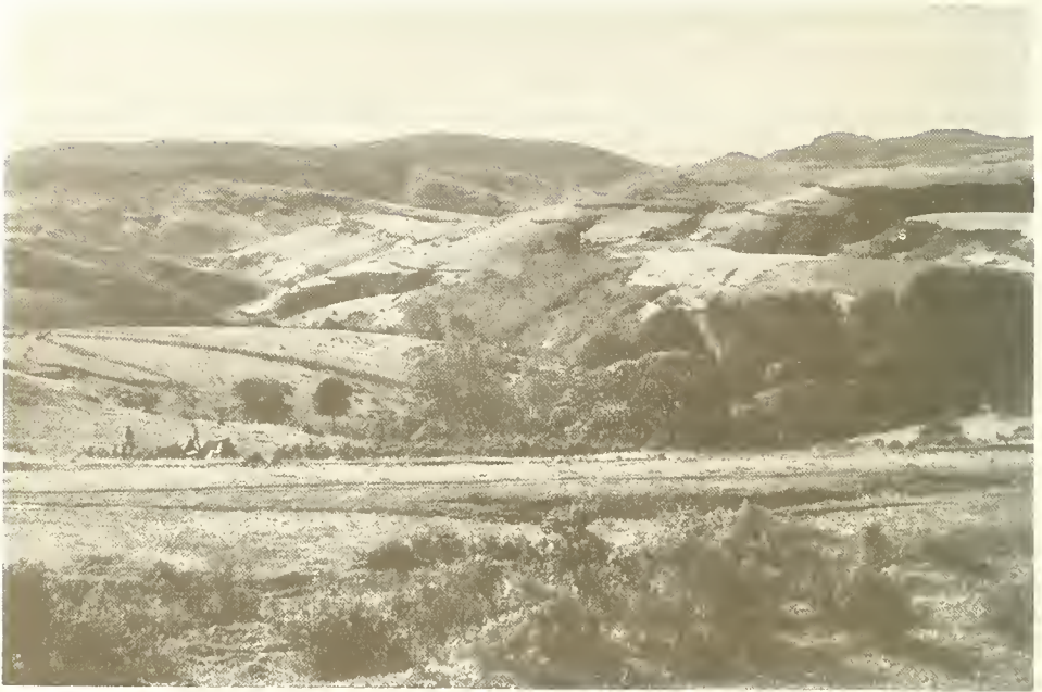
Abb. 9. Blick von Mildekapsa Mariam (3150 m) über die Hochfläche von Woggera nach Süden; vorne Gebirgssavanne mit Hypericum lanceolatum , Mitte Kirchenhain aus Hagenia abyssinica und Juniperus procera ; das Tal im Hintergrund entwässert zum Bälägäs.