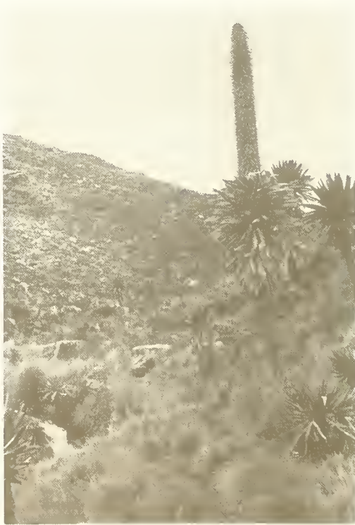
Abb. 15. Lobelia rhynchopetalum bei Kurbät Mätaya.

Eine interessante Gemeinschaft fand ich auf Basaltgrus in flachen Mulden auf Felsen. Dieser Standort wechselt zwischen starker Austrocknung und stauender Nässe. Die dichten Polster von Sagina abyssinica und Senecio nanus , die Blattsukkulente Sedum sediformis und Cerastium octandrum waren die Komponenten.