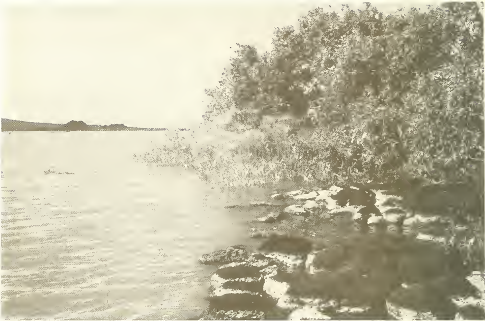
Abb. 5. Ufer auf der Halbinsel von Shimbet Michael mit Basaltblöcken, dahinter Galerie von Dokme-Bäumen ( Syzygium guineense ); links im Hintergrund die Inseln Kevran und Entons, hinter denen sich die Halbinsel Zegie zeigt.

Bahar Dar liegt in der Zone der äußeren Tropen mit einer sommerlichen Regenzeit. In den Tieflagen ist dies die Zone der tropischen, laubabwerfenden Savannenwälder und Savannen. Die kühleren und niederschlagsreicheren Hochländer liegen im Bereich der tropischen, immergrünen Gebirgswälder. Mit der Höhenlage von 1800 m liegt Bahar Dar gerade in einer Zwischenstufe zwischen dem Tiefland, äthiopisch „Kolla“ genannt, und dem eigentlichen Hochland, als „Dega“ bezeichnet. Diesen Übergangsbereich nennen die Äthiopier „Woina Dega“. Die Einordnung der als ursprünglich anzusehenden Wälder um Bahar Dar in Gliederungen für große Vegetationsräume bereitet einige Schwierigkeiten. Bei J. MILDBRAED (1966) findet man die allerdings sehr vage Bezeichnung „Mischwald“ für Übergänge zwischen mehr oder minder trockenen Savannenwäldern und den montanen Regenwäldern.