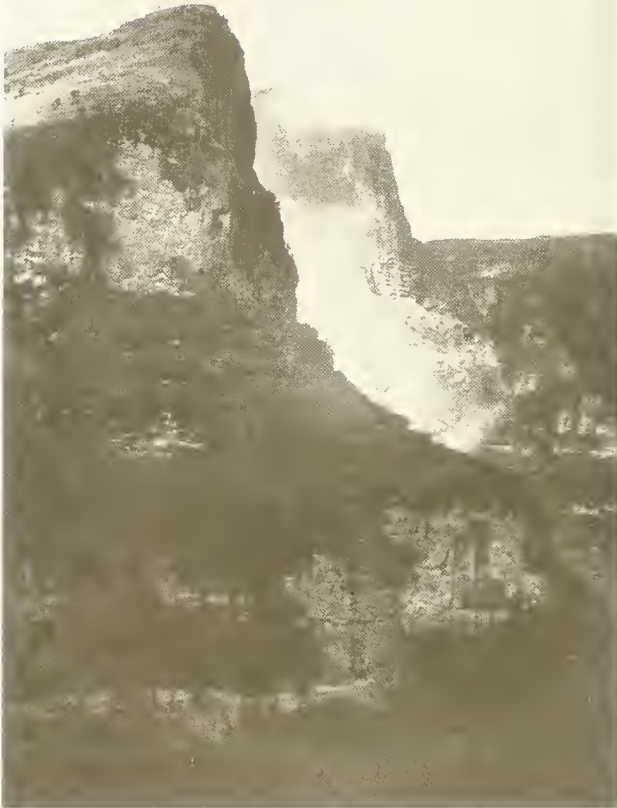
Abb. 13. Blick von Kurbät Mätaya (3600 m) in die Nordwände des Amba Ras (4077 m); die Steilhänge sind dicht mit Erica arborea bewachsen; oben links der flacher geneigte Südhang mit afroalpinen Matten und Fluren von Lobelia rhynchopetalum .

Nach einiger Zeit zog sich der Pfad wieder am Hang entlang abwärts in den Oberlauf des Bälägäs-Tales hinein. Selbst steilere Hänge waren hier noch mit Gerste bebaut. Wo es zu steil wurde, sahen wir die Bauern mit der Hacke an der Arbeit. Es scheint in Semyen eine Art von Flurzwang zu herrschen. Ein Teil der Ackerfläche jedes Dorfes war zusammenhängend angebaut, ein anderer Teil war umgebrochen. Oberhalb des Dorfes Argän erreichten wir bei 3600 m den Talgrund und schlugen unser Lager auf. Kurbät Mätaya — so hieß diese Stelle — war wegen seines Reichtums an gutem Wasser und Holz ein sehr günstiger allerdings wegen der hohen Lage auch kalter Lagerplatz.