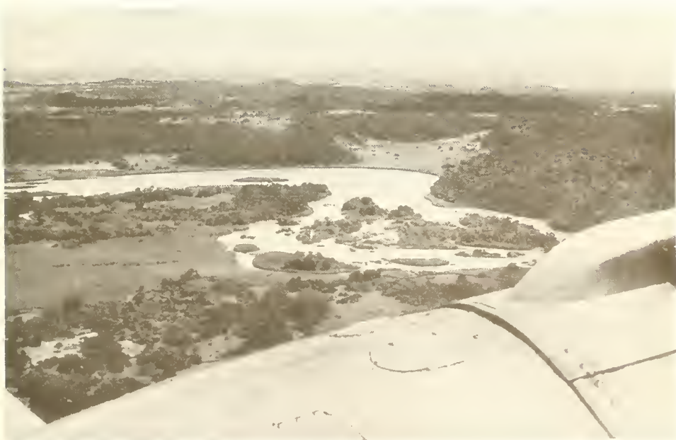
Abb. 2. Niltal wenige Kilometer unterhalb Bahar Dar; die Hänge jenseits des Nils sind mit Savannen-Buschwäldern bewachsen; links vorne ein gehölzfreier Sumpf von Cyperus papyrus ; im Hintergrund die höheren Plateaus von Begemder.