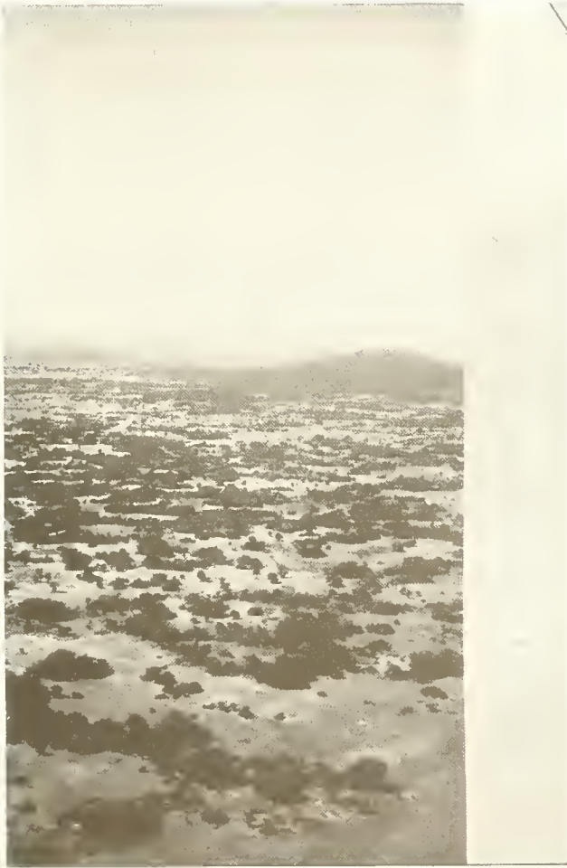
Abb. 3. Landschaft südwestlich Bahar Dar mit kleinflächigem Vegetationsmosaik.

ist auch um Bahar Dar der Wald stark zurückgedrängt worden zugunsten des Ackerbaus und der Weidewirtschaft. Die Besiedlung ist für unsere Begriffe aber keineswegs besonders dicht.