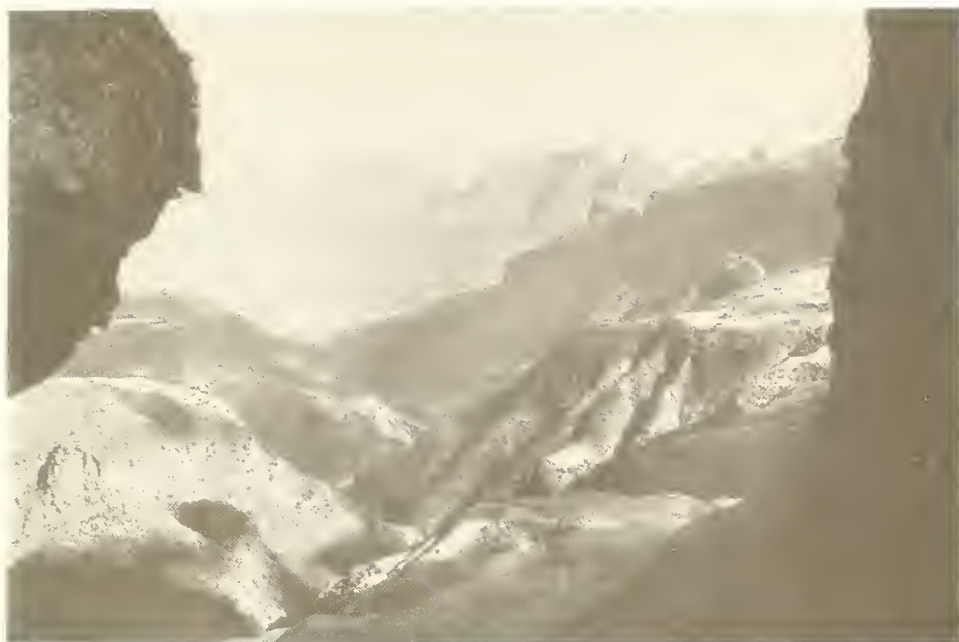
Abb. 14. Blick von Kurbät Mätaya auf das Vorplateau mit den Dörfern Dihuara (3022 m) und mehr rechts Ami Walka (3100 m); in der Mitte das tiefe Anzia-Tal, soweit auf dem Bild sichtbar bis etwa 1600 m eingetieft; im Hintergrund von links nach rechts Amba Toloka (2700 m), Amba Ton (2880 m) und mehrere unbenannte Amben (2900—3100 m).

Aufnahme Nr. 7: Kurbät Mätaya, 3600 m, 9. XI. 66, 100 qm.