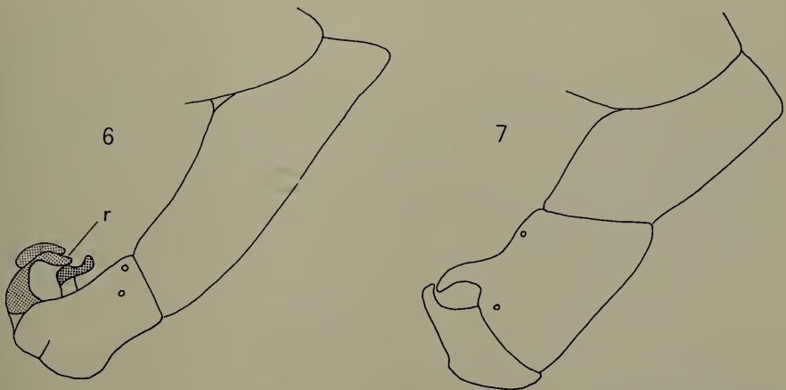
Abb. 6—7. Postabdomen und 5. Segment von Polybiocoptera plaumanni Guimaraes, Männchen (6) und Weibchen (7). Die membranöse Aushöhlung des Epandriums ist hinten von dem herausragenden und umgebogenen Rand (r) überdeckt. Raster wie in Abb. 4 und 5.

Das Stuttgarter Museum besitzt 1 \sigma^7 und 2 ♀ von P. plaumanni , die ebenso wie der Typus in Nova Teutonia (Brasilien) von F. PLAUMANN gesammelt worden sind. Sie stimmen mit der Beschreibung gut überein, doch ist der Flügel nicht hyalin, sondern im vorderen Teil (Grenze entlang m bis r-m und dann durch die Mitte der Zelle R_5 bis zu deren Mündung) auffallend gebräunt. Das \sigma^7 ist dem ♀ sehr ähnlich, es hat dieselbe Fühlerproportion (3. Glied 4mal so lang wie das zweite), dieselbe Stirnbreite (0,6 eines Auges) und auch die nach vorn gebogene Prävertikale, die GUIMARAES als proklinierte Orbitale bezeichnet. Die Krallen sind beim \sigma^7 deutlich vergrößert, aber nicht länger als das letzte Tarsenglied. Die Form des Abdomens ist in beiden Geschlechtern gleich: Das 2. Segment verengt sich in seinem basalen \frac{1}{3} zu einer Taille, die weniger als halb so breit ist wie das Scutellum, und verdickt sich danach auf das 3fache. Postabdomen wie in Abb. 6 und 7 dargestellt.