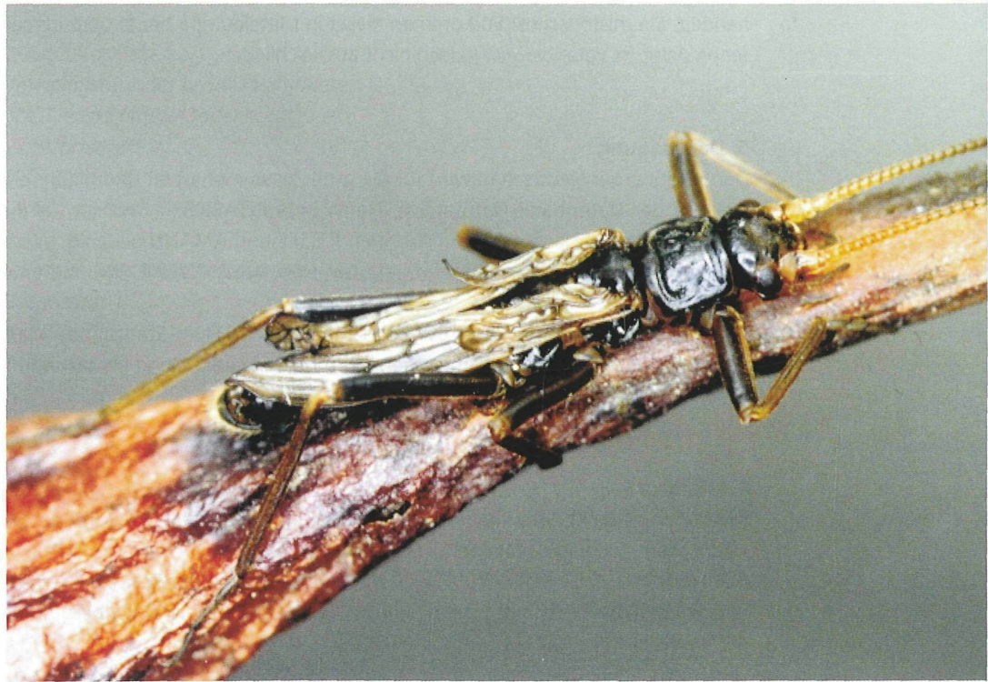
Abb. 1 (o.): Brachyptera risi vom Gwiggerbach, Hohenweiler