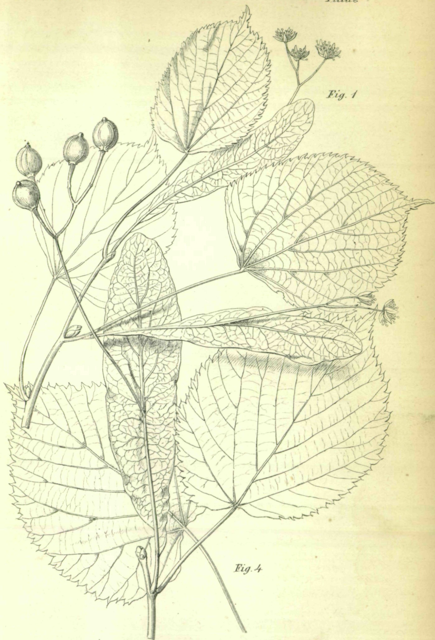
Fig. 1 Tilia parvifolia Ehrh. var. ovalifolia Spch. Fig. 4. Tilia neglecta Spch.