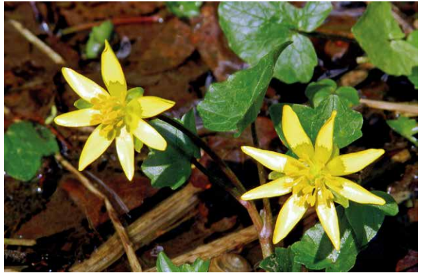
Abb. 20 Der auffällige Glanz der Blüten des Scharbockskrautes kommt durch die starke Reflexion des Lichtes zustande. Nur an ihrem matt schimmernden Grund wird wenig Licht reflektiert. Solche Stellen werden „Flecksaftmale“ genannt und dienen Insekten zur Orientierung.