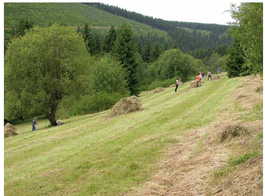
Abb. 58, 59

Eine ökologisch sinnvolle Biotop-Pflege, wie hier im Naturschutzgebiet Zechengrund bei Oberwiesenthal, ist die Voraussetzung für den Erhalt selten gewordener Pflanzengesellschaften und gefährdeter Arten.