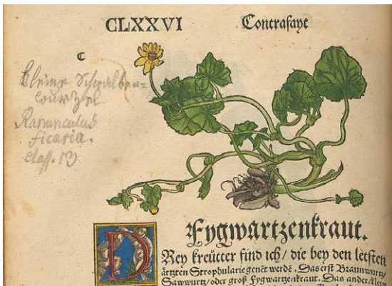
Abb. 47, 48 und 49 Otto Brunfels legte mit seinem „Contrafayt Kreüterbuch“, eine wesentliche Grundlage für weitere deutschsprachige Kräuterbücher im 16. Jahrhundert. Abb. 47 zeigt das Titelblatt der Ausgabe Straßburg 1532. „Klein Fygwartzenkraut“ oder „Pfaffenhödlin“ bezeichnet Otto Brunfels hier unser Scharbockskraut. Ein früherer Nutzer hat am Rand des Blattes „Klein Fygwartzenkraut“ handschriftlich den volkstümlichen Namen „kleine Schwalbenwurzel“ und die lateinische Bezeichnung Ranunculus Ficaria vermerkt (Abb. 48 und 49). Das kolorierte Bild zeigt alle wesentlichen Merkmale der Art.

Obwohl bei Leonhart Fuchs und Hieronymus Bock bei den deutschen Bezeichnungen von Ficaria verna auch der Name „Scherbockskraut“ mit aufgezählt wird, fehlen Hinweise zur Anwendung gegen Skorbut. Das hatte mehrere Gründe. Zum einen ergab sich diese Nutzung kaum aus der Signaturenlehre. Zum anderen kam es erst im Zuge der großen Entdeckungen zu den weit verbreiteten Skorbutfällen bei den Seefahrern. Entsprechende Aussagen zum Scharbockskraut finden sich auch in den Kräuterbüchern von Rembert Dodoens (1516/17-1588), Adam Lonitzer (1528-1586), Matthias de L’Obel (1538-1616) und Valerius Cordus (1515-1544). 13