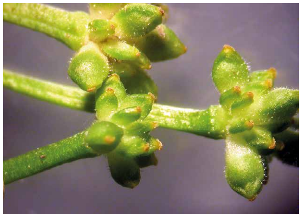
Abb. 22 Nur selten kann man beim einheimischen Knöllchen-Scharbockskraut ( Ficaria verna ssp. bulbifera ) reife Früchte beobachten, hier an einzelnen Pflanzen einer Population am Großsolbersdorfer Bach im Mündungsbereich zur Zschopau. Die von feinen Härchen bedeckten Nüsschen waren auffällig größer und bildeten eine feste Schale aus. Ob der im Inneren befindliche längliche, relativ flache Körper ein reifer Samen oder doch nur die eingetrocknete Samenanlage ist, könnte erst durch einen Keimversuch geklärt werden.