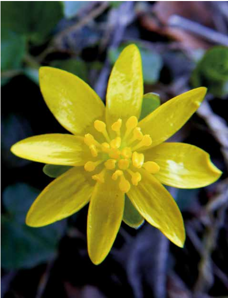
Abb. 19 Der leuchtend gelbe Blütenstern des Scharbockskrautes besteht aus 6 bis 12 lackartig glänzenden Kronblättern. Im Zentrum überragen die längeren Staubblätter die ebenso zahlreichen Fruchtblätter.