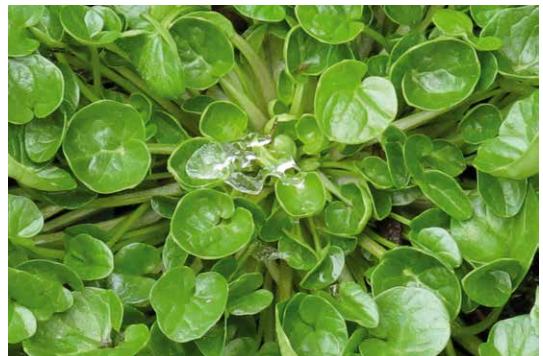
Abb. 44a, 44b

Das Echte Löffelkraut galt lange Zeit als eine „Sammelart“ ( Cochlearia officinalis agg.) aus mehreren „Kleinarten“. Diese sind inzwischen genetisch und taxonomisch genauer untersucht und erlauben eine Abtrennung als eigene Arten. Das abgebildete Bayerische Löffelkraut ( Cochlearia bavarica ) ist ein seltener Endemit im bayerischen Voralpenraum und wächst dort in skelettreichen Waldquellfluren und Kalkquellmooren. Die Wuchsgebiete der abgebildeten Pflanzen werden wie folgt angegeben: Abb. 44 a „Glonnquellen“ (Hangquellmoor Mühlthal), Lkr. Ebersberg, 24.04.2012; Abb. 44 b Kupferbachtal (Tuffhang nördlich Spielberg), Lkr. München-Land, 01.02.2014.