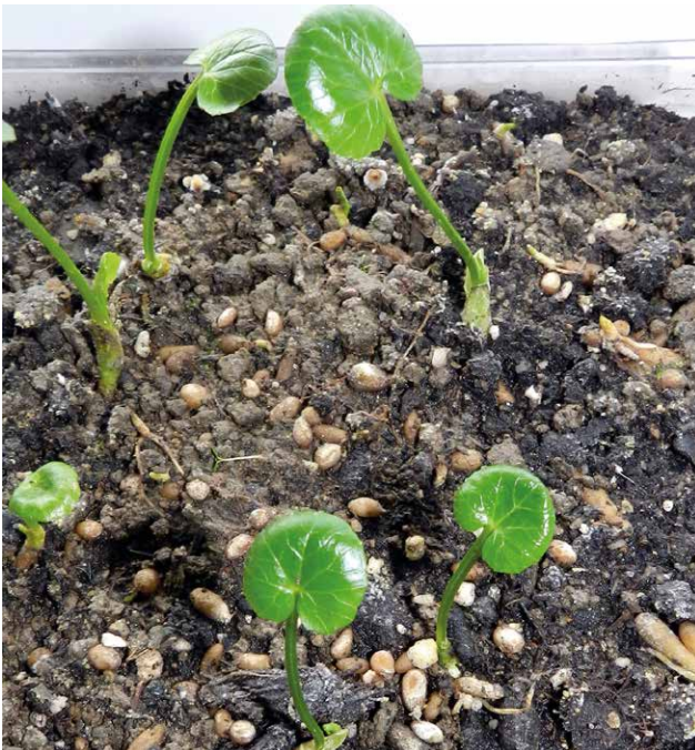
Abb. 29 Ein angesetzter Kulturversuch auf dem Fensterbrett im November 2014 verlief zunächst viel versprechend. Aus den grünen Knospen sprossen im Laufe des Monats November mehrere Laubblätter, die an langen Stielen 5 - 8 cm senkrecht nach oben wuchsen. Ab der 2. Dezemberwoche stagnierte die weitere Entwicklung der grünen Pflanzenteile. Die Bulbillen blieben schon zu Beginn des Kulturversuchs sitzen. Mitte Dezember waren alle oberirdischen Teile abgestorben.

H. G. L. Reichenbach das Scharbockskraut Ficaria ranunculoides MNCH. (REICHENBACH 1844). Zu Beginn des 20. Jahrhunderts wurde von Otto Wünsche der Name Ranunculus ficaria L. verwendet (WÜNSCHE 1904). Im „Wünsche-Schorler“, einem Nachfolgewerk seit 1912, findet man erst spät Ficaria verna HUDS. (FLÖSSNER et al. 1956). Im „Rothmaler“, der für das gesamte Gebiet der DDR