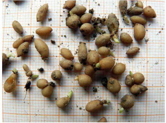
Abb. 27, 28 Bereits im Herbst kann man beim Scharbockskraut zahlreiche auskeimende Sprosssteile beobachten; auch manche Bulbillen zeigen kurze Keimspitzen.