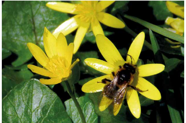
Abb. 21 Die Blüten des Scharbockskrautes produzieren reichlich Pollen und Nektar und werden häufig von Schmetterlingen, Bienen und anderen Insekten besucht. Trotz Bestäubung der zwittrigen Blüten kommt es bei der heimischen Unterart kaum zur Ausbildung reifer Früchte.