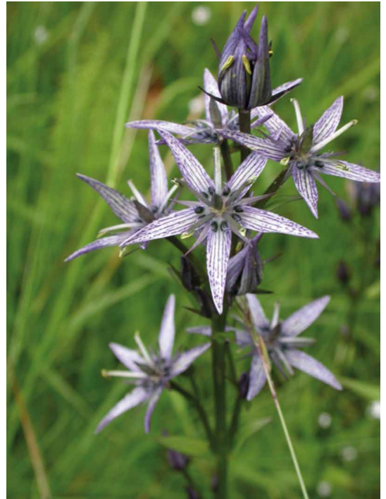
Abb. 60, 61

Glieder solcher montanen Pflanzengesellschaften im Gebiet des NSG „Zechengrund“ sind z. B. die Mondraute ( Botrychium lunaria ), eine seltene und versteckt lebende Farnpflanze, und der Blaue Tarant oder Sumpfenzian ( Swertia perennis ), eine in Sachsen nur noch im oberen Erzgebirge vorkommendes Kaltzeitrelikt.