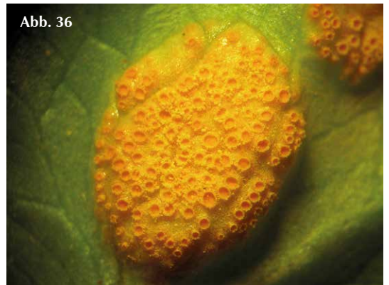
Abb. 30-36 Verschiedene Entwicklungsstufen von Rostpilzen, die Sprosstiele des Scharbockskrautes befallen:

Abb. 30-32 Telien von Uromyces ficariae auf der Unterseite von Laubblättern und an Blattstielen;