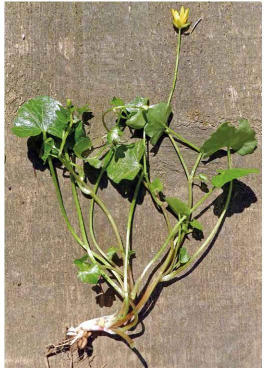
Abb. 17, 18

Scharbockskraut kann an nassen Standorten ziemlich groß werden. Mit ca. 15 cm hat diese Pflanze einen sehr langen, sich verzweigenden und relativ schlaffen Stängel ausgebildet. Auch die Blatt- und Blütenstiele sind einige Zentimeter lang. An relativ trockenen und lichtreichen Wiesenstandorten wachsen die Scharbockskrautpflanzen nur wenige Zentimeter hoch.