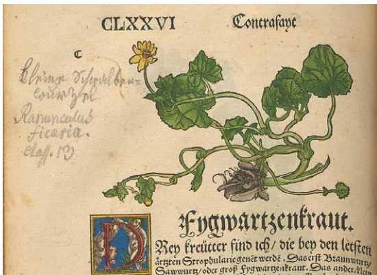
Abb. 47, 48 und 49 Otto Brunfels legte mit seinem „Contrafayt Kreüterbuch“, eine wesentliche Grundlage für weitere deutschsprachige Kräuterbücher im 16. Jahrhundert. Abb. 47 zeigt das Titelblatt der Ausgabe Straßburg 1532. „Klein Fygwartzenkraut“ oder „Pflaffenhödlin“ bezeichnet Otto Brunfels hier unser Scharbockskraut. Ein früherer Nutzer hat am Rand des Blattes „Klein Fygwartzenkraut“ handschriftlich den volkstümlichen Namen „kleine Schwalbenwurzel“ und die lateinische Bezeichnung Ranunculus Ficaria vermerkt (Abb. 48 und 49). Das kolorierte Bild zeigt alle wesentlichen Merkmale der Art. (Bayerische Staatsbibliothek München Rar.2264-1/2; Titelblatt und Blatt CLXXVI; urn:nbn:de:vbv:12-bsb00054201-5).

Obwohl bei Leonhart Fuchs und Hieronymus Bock bei den deutschen Bezeichnungen von Ficaria verna auch der Name „Scherbockskraut“ mit aufgezählt wird, fehlen Hinweise zur Anwendung gegen Skorbut. Das hatte mehrere Gründe. Zum einen ergab sich diese Nutzung kaum aus der Signaturenlehre. Zum anderen kam es erst im Zuge der großen Entdeckungen zu den weit verbreiteten Skorbutfällen bei den Seefahrern. Entsprechende Aussagen zum Scharbockskraut finden sich auch in den Kräuterbüchern von Rembert Dodoens (1516/17-1588), Adam Lonitzer (1528-1586), Matthias de L’Obel (1538-1616) und Valerius Cordus (1515-1544). 13