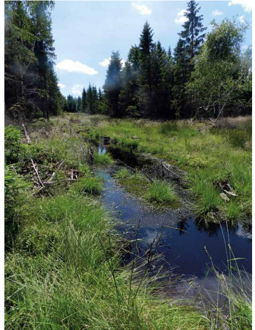
Abb. 65, 66

Die Naturwaldzelle in Steinbach ist ein gutes Beispiel für erfolgreichen Prozessschutz. Ob das in der Philippeide bei Satzung, einem kürzlich „revitalisiertem“ Moor, ebenso gelingen wird, hängt sowohl von der Intensität der initiierten „Wiederbelebung“ des ehemaligen Moorgebietes als auch von der Wirkung klimatischer Faktoren ab.