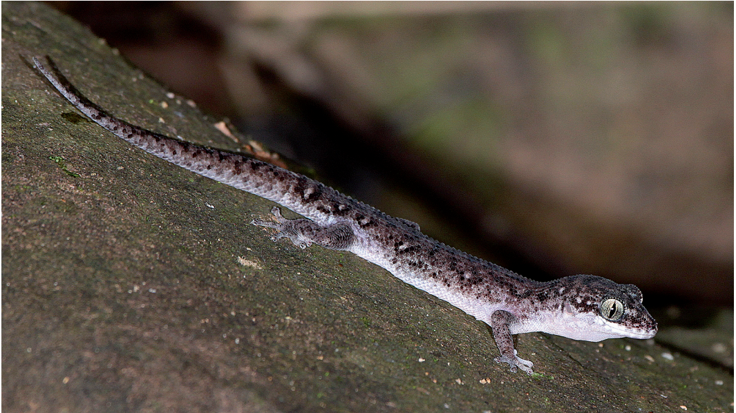
Abb. 2: Männchen von Dixoninius siamensis auf einem Gesteinsblock an einem Waldbach nahe der Siedlung Lat Krachoe im Phu Pan-Gebirge (Nordost-Thailand).