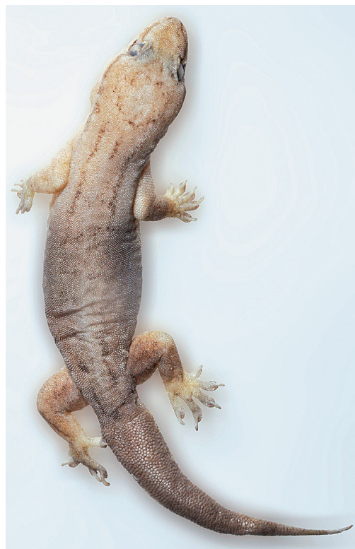
Abb. 3: Hemidactylus aquilonius vom Phou Fa (Laos) – NME R 870/13.

NME R 870/13 – Männchen, Phou Fa, Prov. Phongsali,