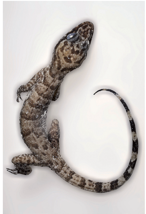
Abb. 1: Papua-Bogenfingergecko ( Cyrtodactylus papuensis ) von Misool - Erstfund außerhalb Neu-Guineas.

NME R 869/13 – juvenil, Ban Wang Yao, Ressort am Nationalpark Nam Nao, Prov. Phetchabun, Thailand, 16°44'53"N, 101°26'17"E; leg. Ulrich Scheidt & Thomas Ihle, 16.10.2007–17.10.2007.