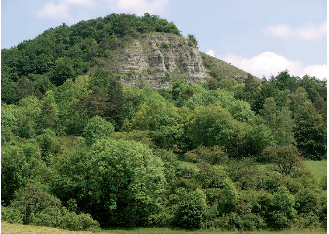
Abb. 2: Zahlreiche xerophytische Moosgesellschaften sind für den felsigen Südhang der Zietschkuppe bezeichnend. 02.06.2014.