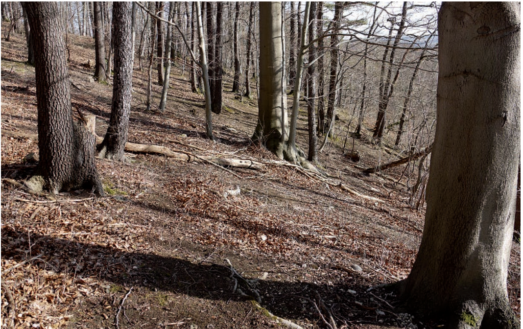
Abb. 5: Das einförmige Carici -Fagetum an Oberhängen, hier der Flachsleite, weist nur auf verhagerten Flächen Moose am Waldboden auf. 17.02.2014.