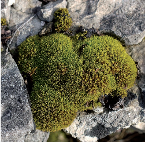
Abb. 6: Tortella inclinata bildet im Tortelletum inclinatae oft umfangreiche Bestände. Zietschkuppe. 06.02.2016.

ze ist das Astometum crispi encalyptetosum vulgaris anzutreffen, das sich durch den langlebigen Pendler Encalypta vulgaris auszeichnet.