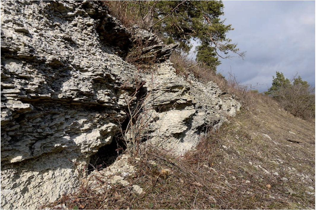
Abb. 4: Die Fugen der rissigen Kalkbänke der Oolithzone östlich der Zietschkuppe sind charakteristische Standorte des Weissietum crispatae , Trichostomo crispuli - Aloinetum aloidis und Aloinetum rigidae . 19.02.2014.