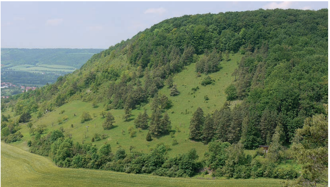
Abb. 3: Die südexponierten Unterhänge der Flachsleite zeichnen sich durch umfangreiche Bestände des Brometum erecti aus. Am Oberhang herrscht Carici-Fagetum vor. 02.06.2014.