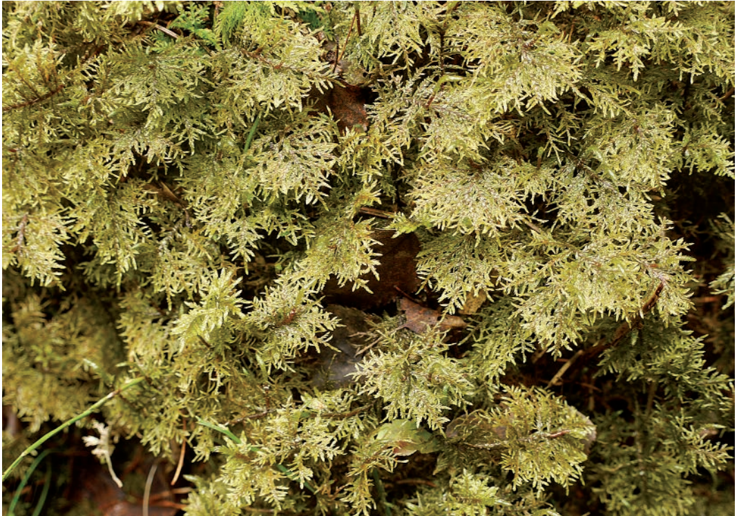
Abb. 9: Zu den selteneren Moosen gehört im NSG Hylocomium splendens . Poxdorfer Höhe. 24.03.2016.