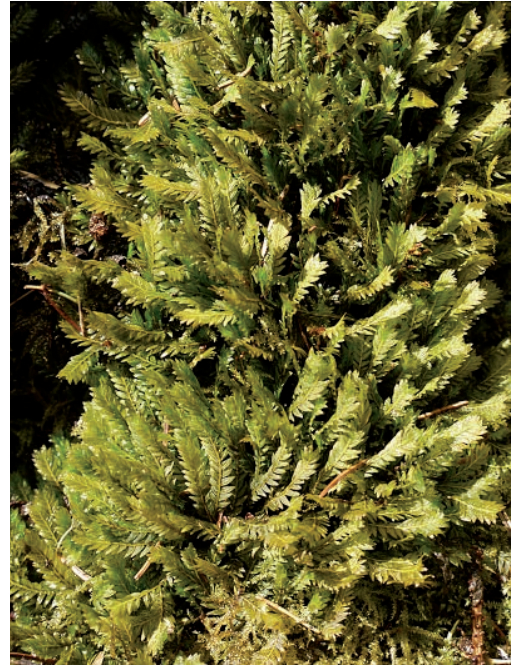
Abb. 8 (rechts): Nur an einer Quellstelle im Sperbergrund wurde Fissidens adianthoides beobachtet. 04.03.2015.