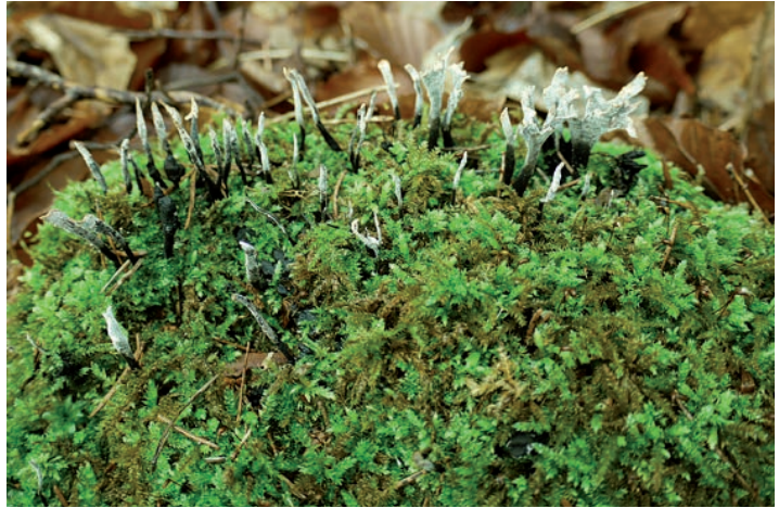
Abb. 7: Auf gering zersetzten Schnittflächen der Stümpfe von Fagus sylvatica entwickelt sich das Hypno-Xylarietum hypoxyli mit der Holzkeule Xylaria hypoxylon . Mönskuppe. 17.02.2014.

weniger Jahre von pleurokarpanen Laubmoosen und Gefäßpflanzen verdrängt. Zu den Ausdauernden mit generativer und vegetativer Reproduktion gehört außerdem die Decke Plagiothecium curvifolium . Die Assoziation gliedert sich in das häufigere Leucobryo-Tetraphidetum typicum mit der Typischen Variante und der Aulacomnium androgynum -Varinate sowie in das eine Komponente Mineralboden anzeigende, im NSG seltene Leucobryo-Tetraphidetum dicranelletesum heteromallae.