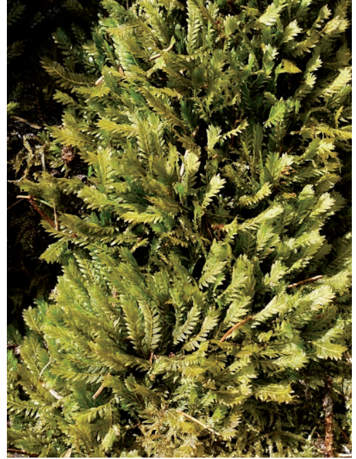
Abb. 8 (rechts): Nur an einer Quellstelle im Sperbergrund wurde Fissidens adianthoides beobachtet. 04.03.2015.