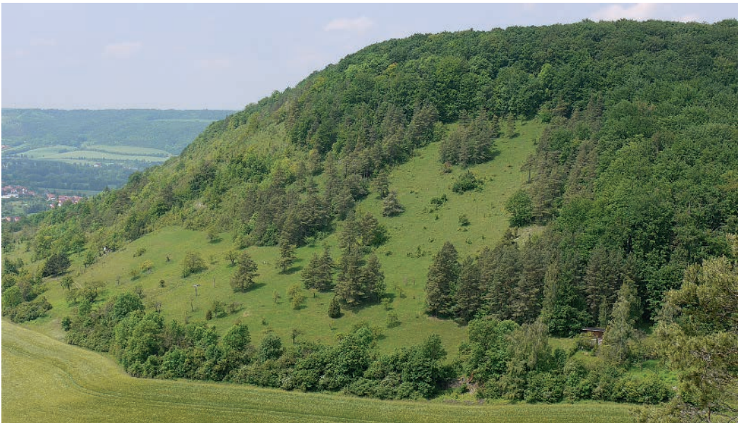
Abb. 3: Die südexponierten Unterhänge der Flachsleite zeichnen sich durch umfangreiche Bestände des Brometum erecti aus. Am Oberhang herrscht Carici-Fagetum vor. 02.06.2014.